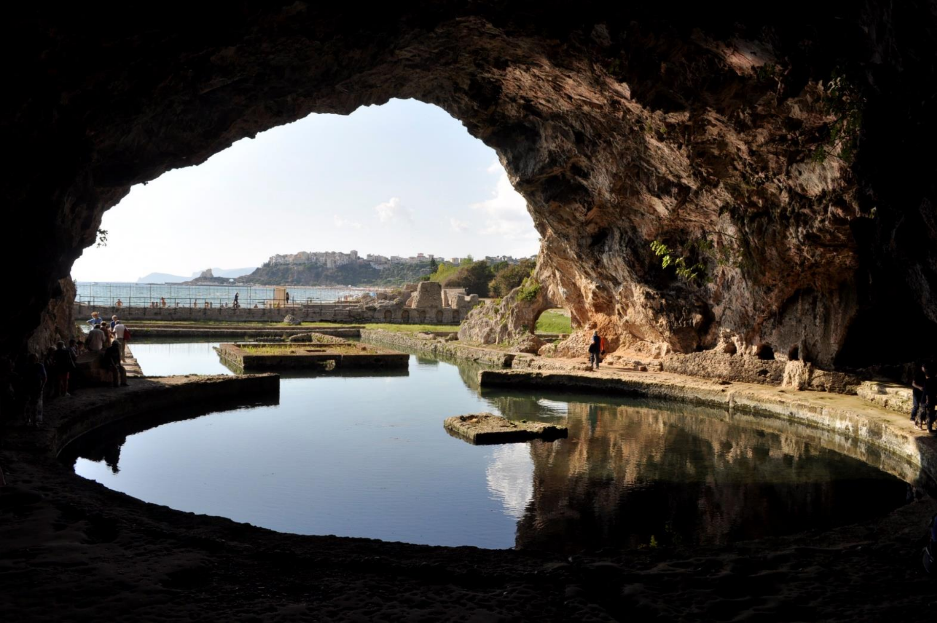
SPERLONGA – Grotta di Tiberio