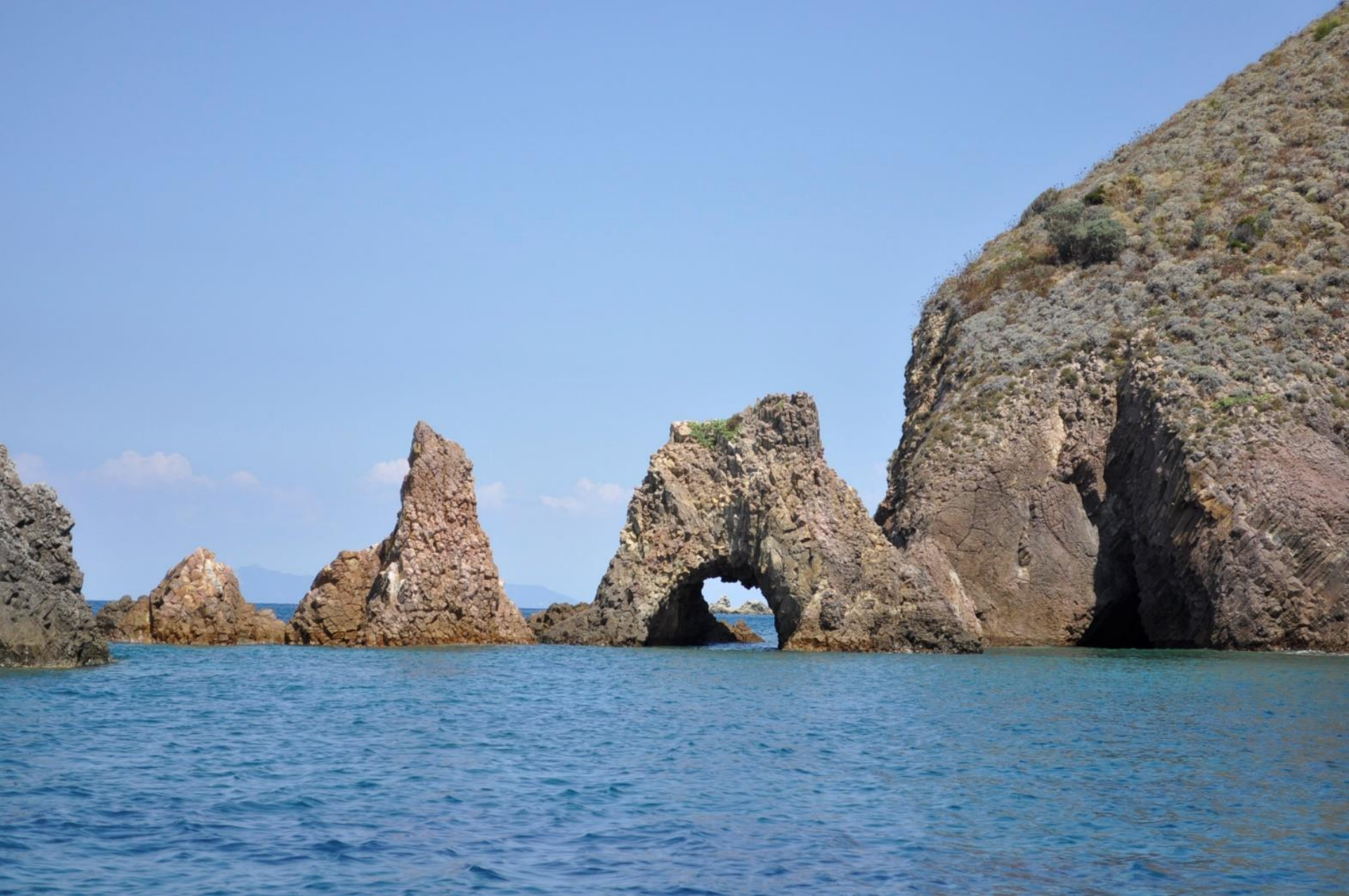
Isola di PONZA