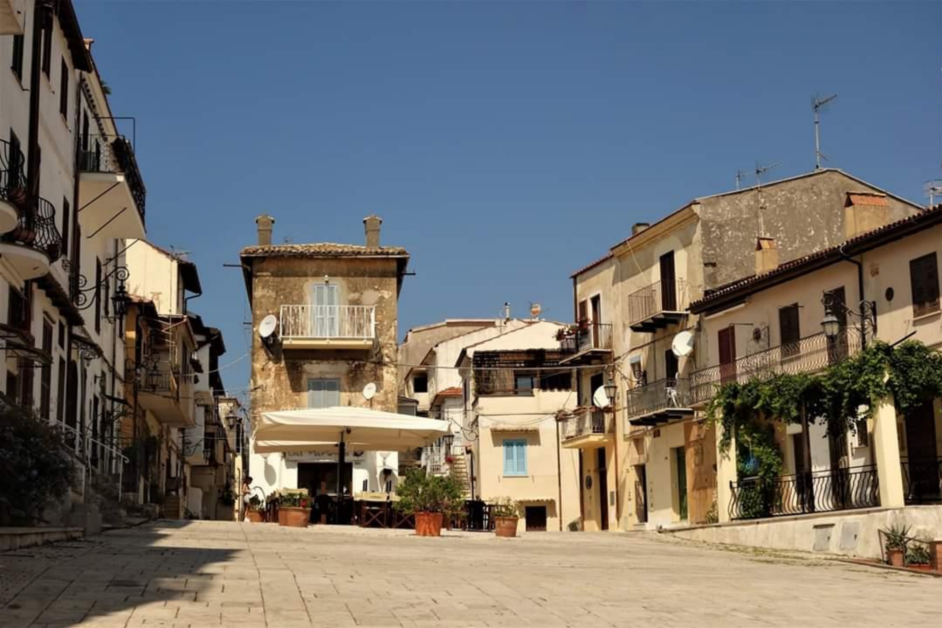
SAN FELICE CIRCEO