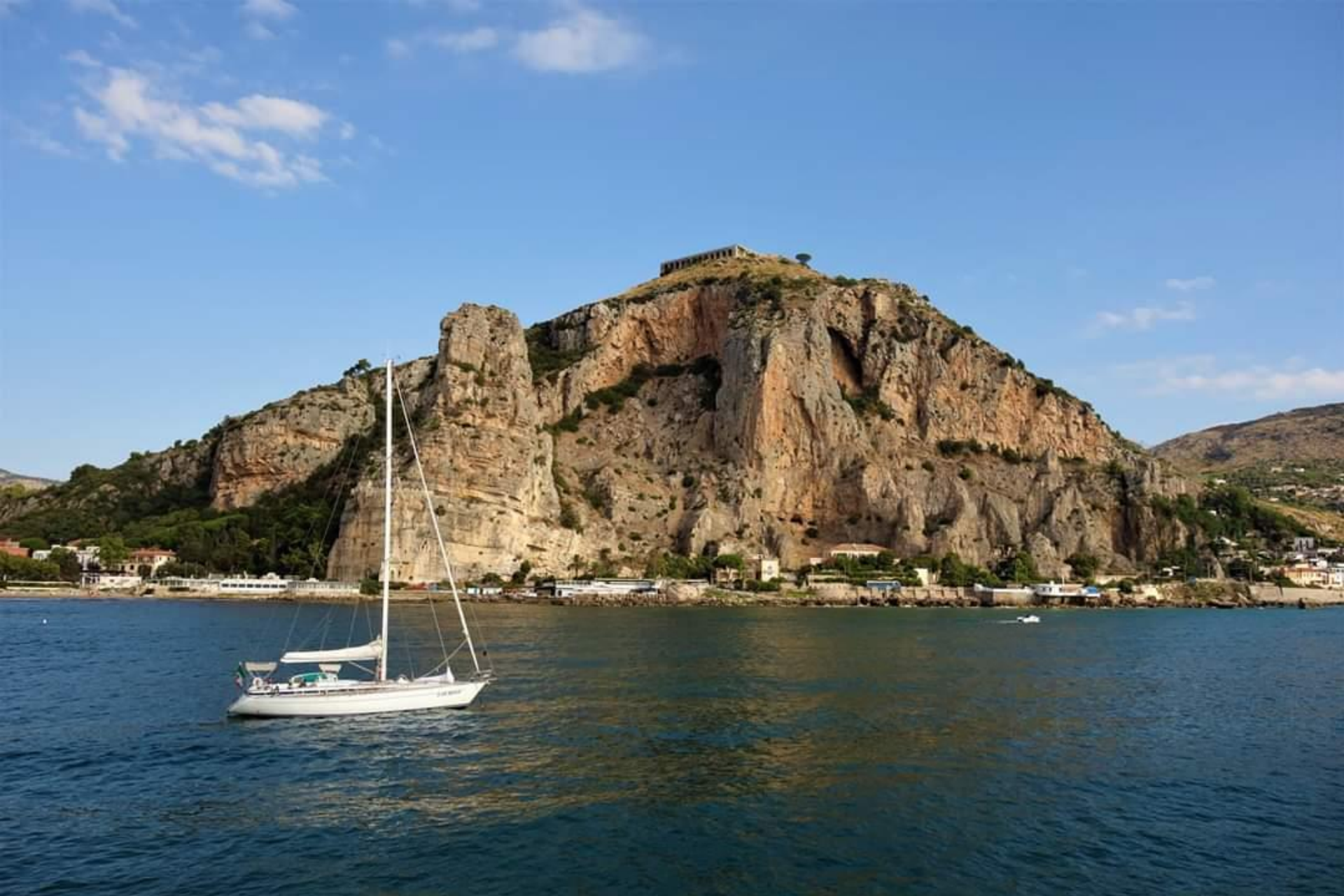
Isola di PONZA