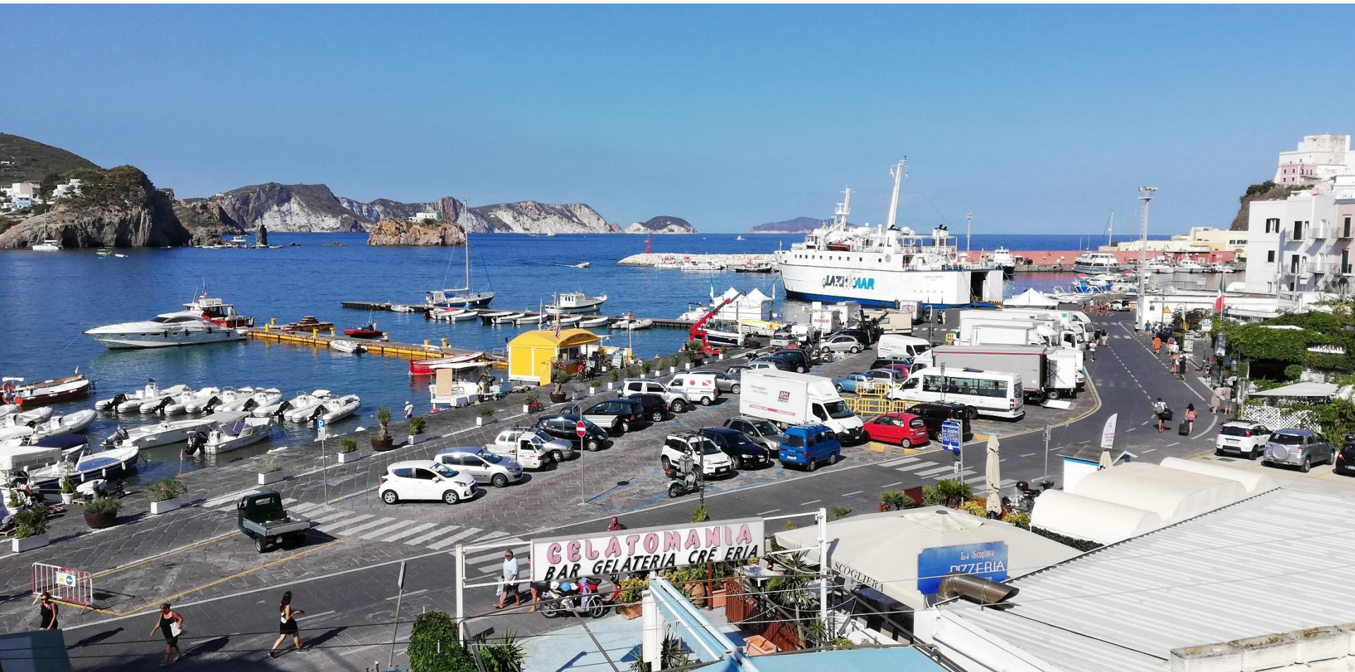
Isola di PONZA