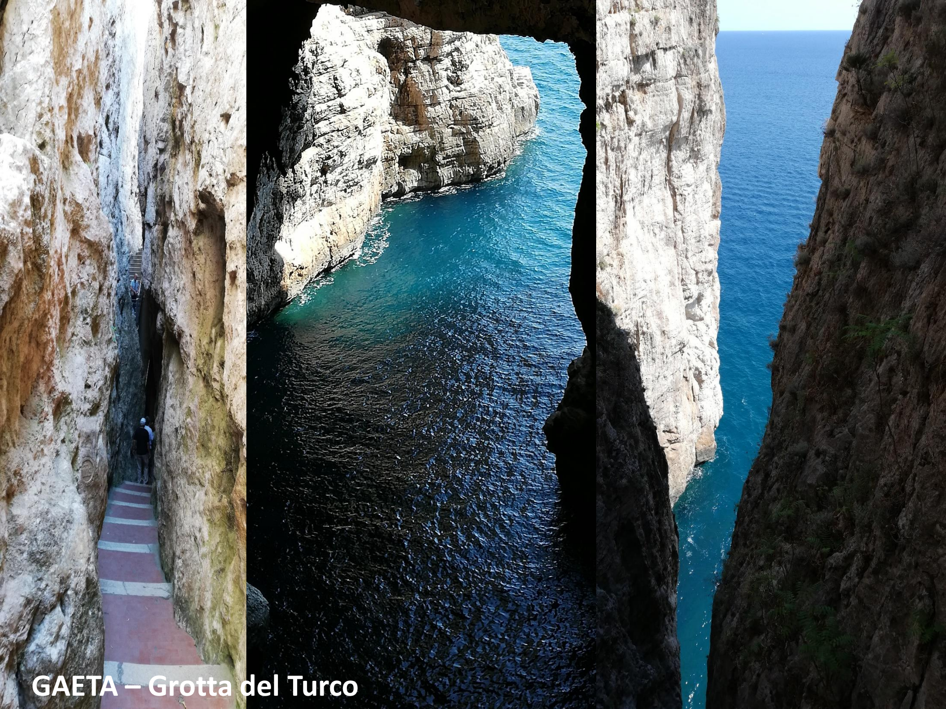
GAETA – Grotta del Turco