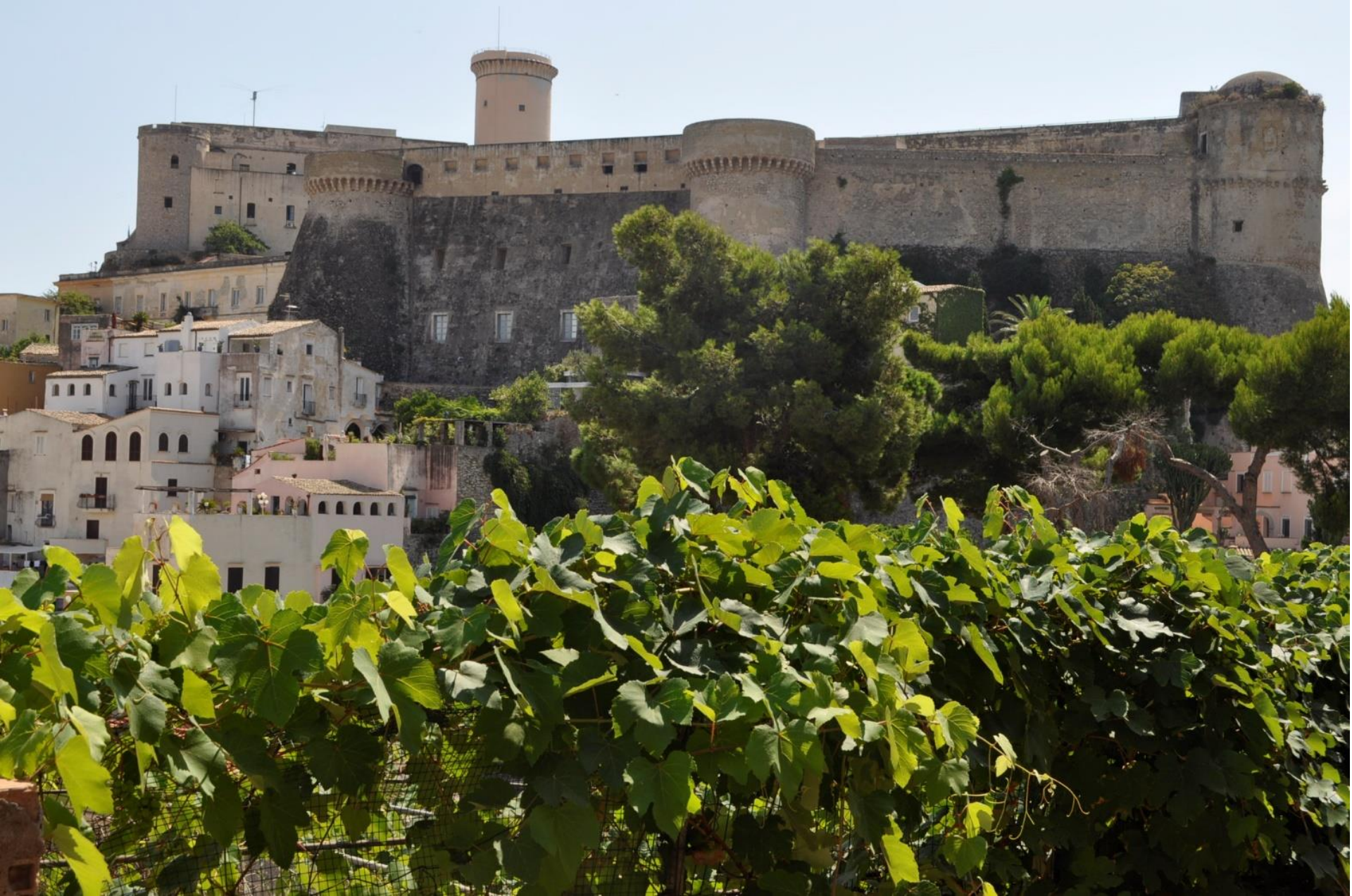
GAETA – Carcere militare (ex)