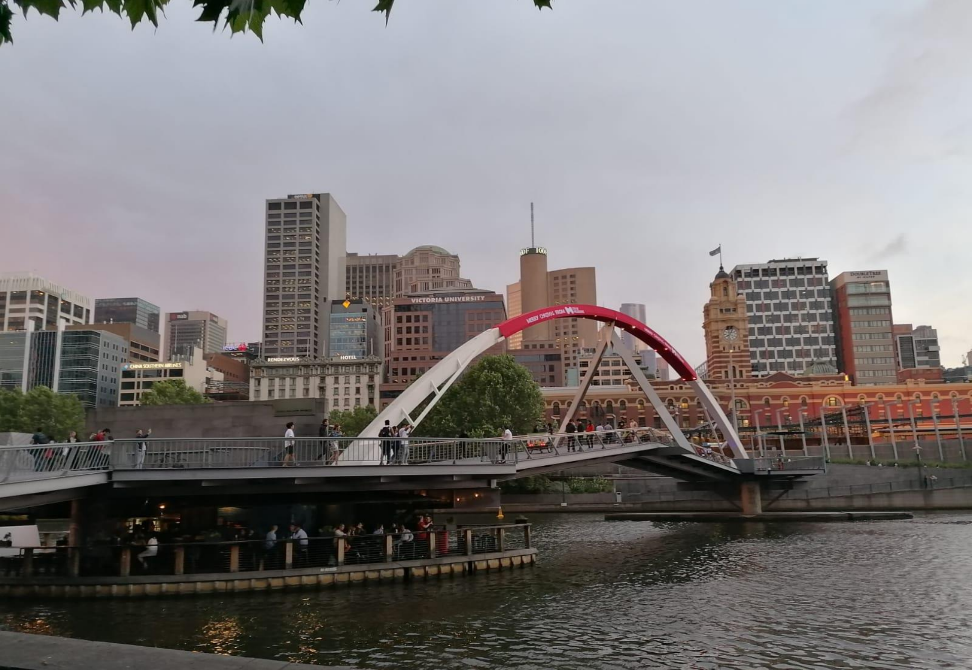
MELBOURNE (Victoria State)