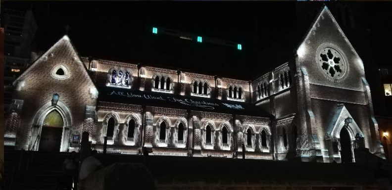
PERTH (Western Australia)