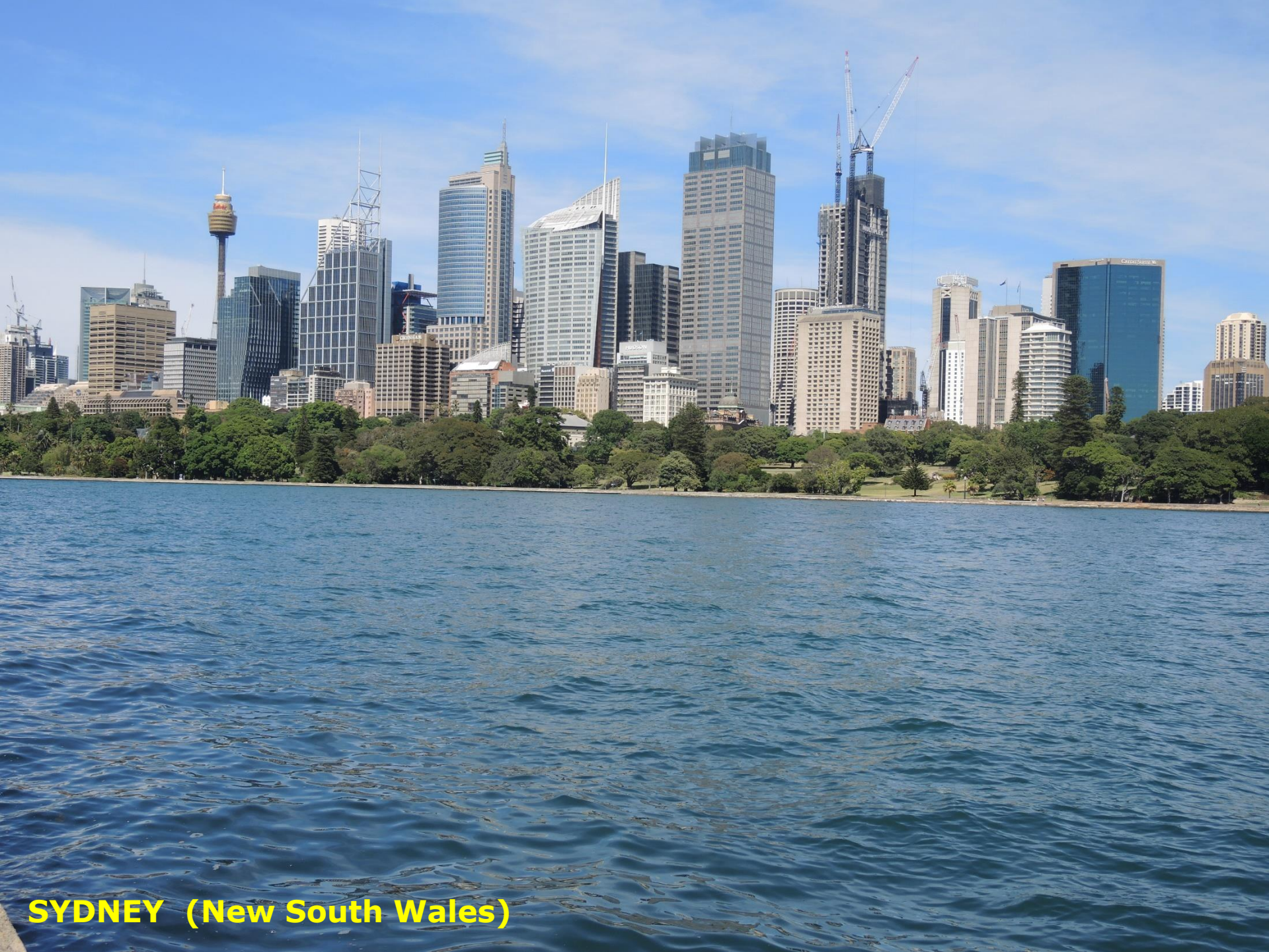
SYDNEY (New South Wales)