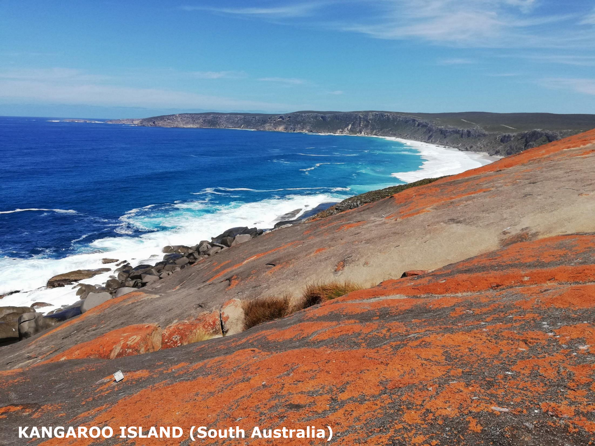
KANGAROO ISLAND (South Australia)