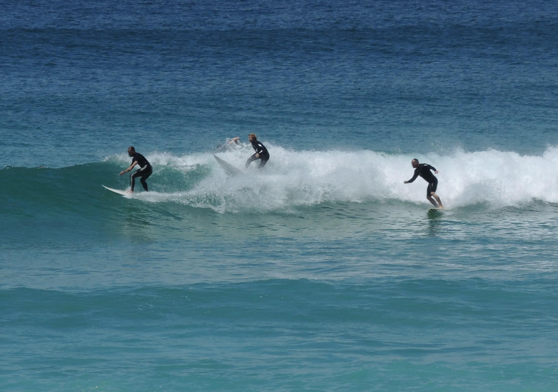
SYDNEY - Surf a Bondi Beach