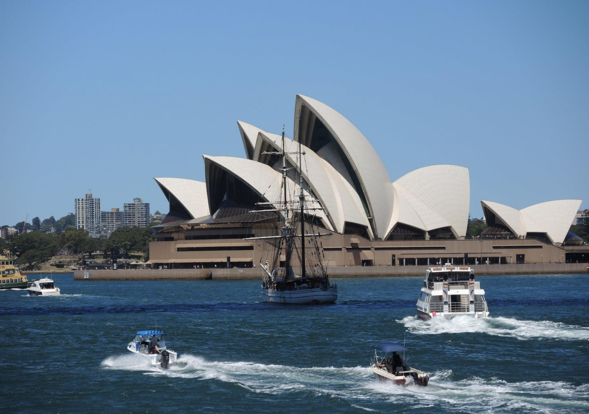
Sydney Opera House – New South Wales