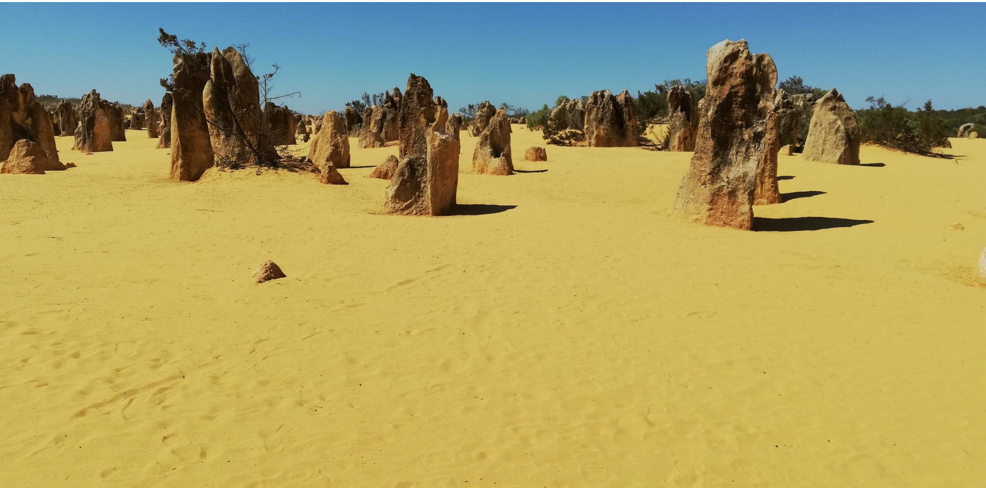
PERTH (Western Australia) - Pinnacle desert