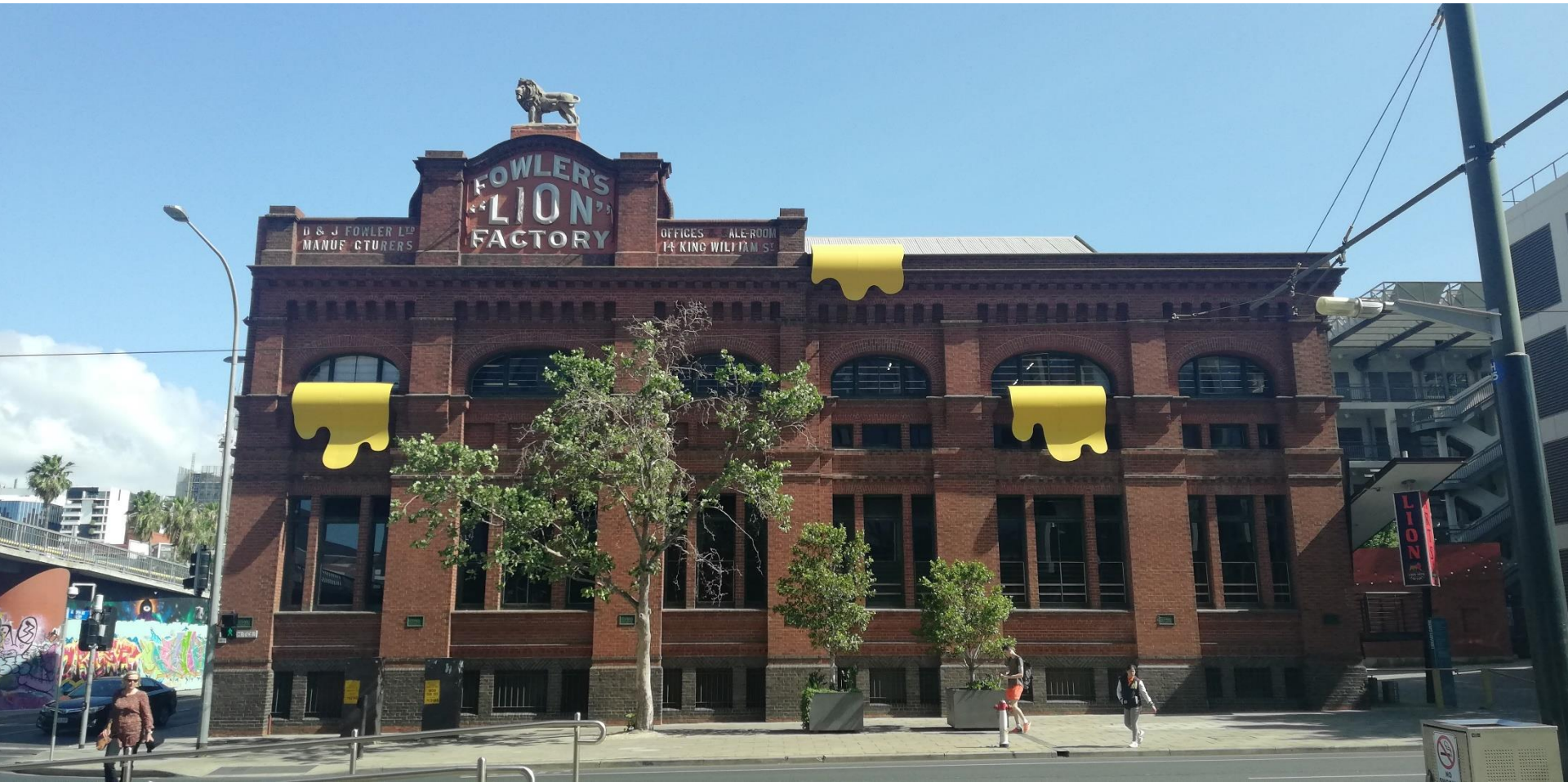
ADELAIDE (South Australia)