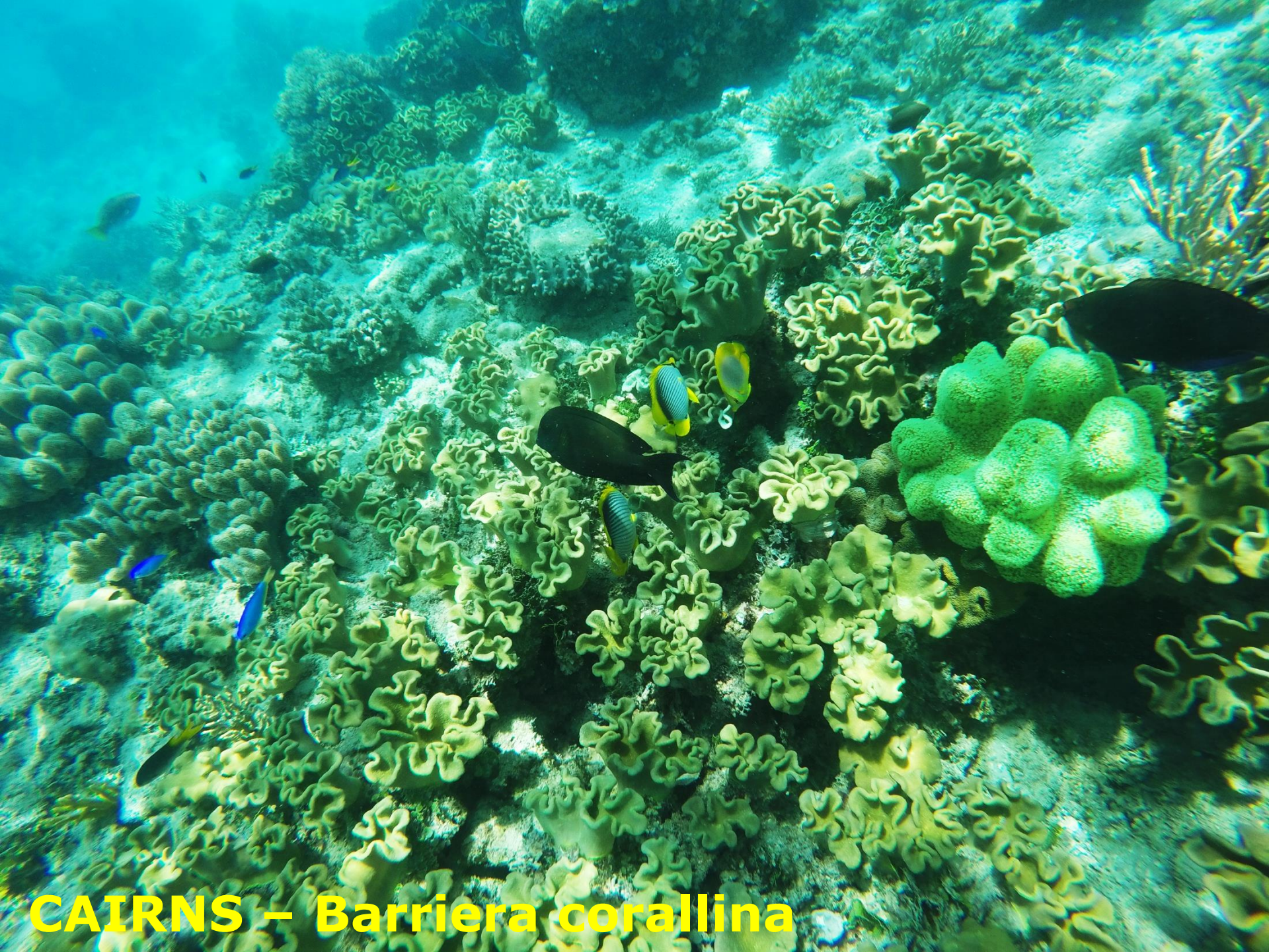
CAIRNS – Barriera corallina