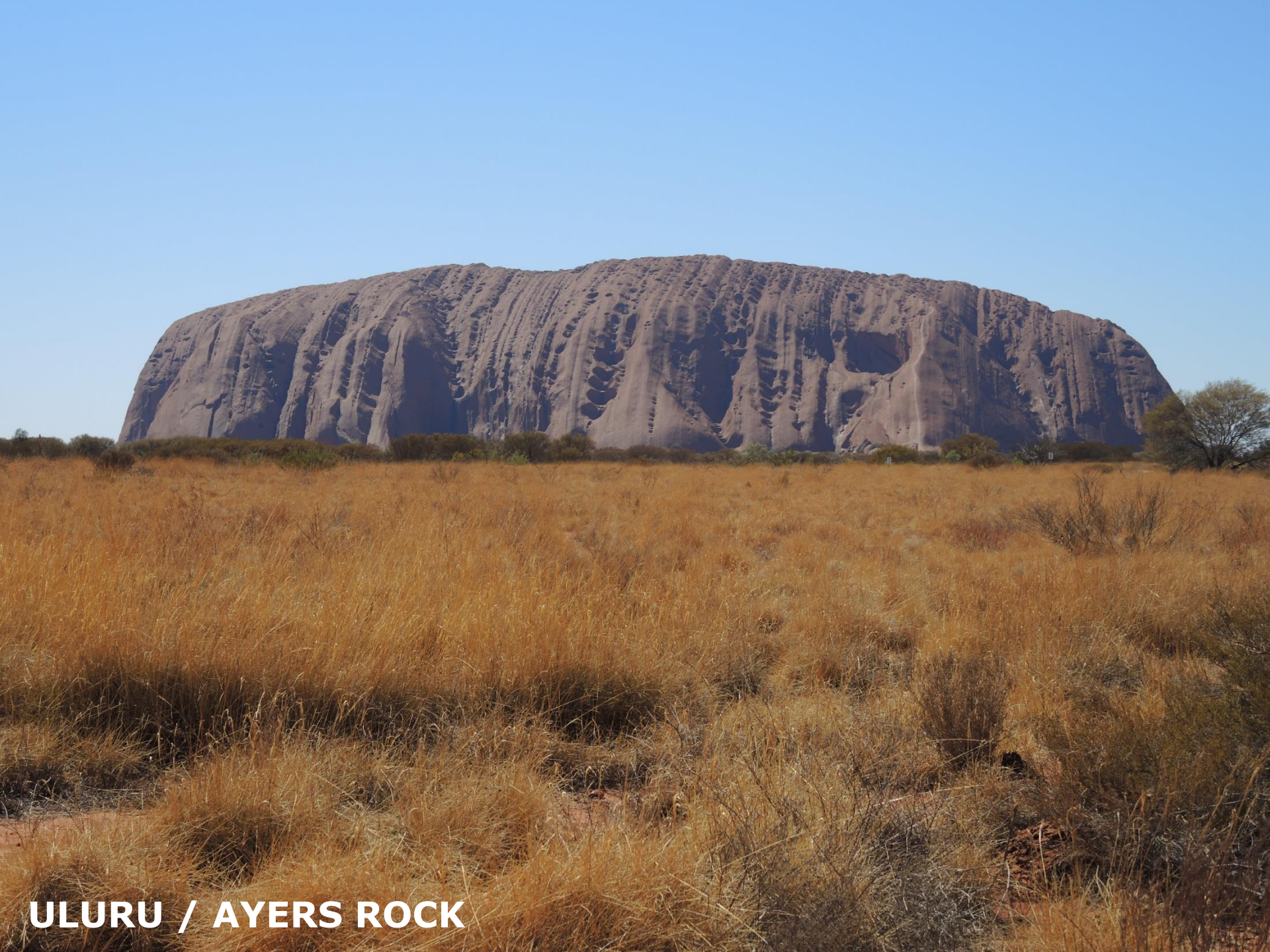
ULURU / AYERS ROCK