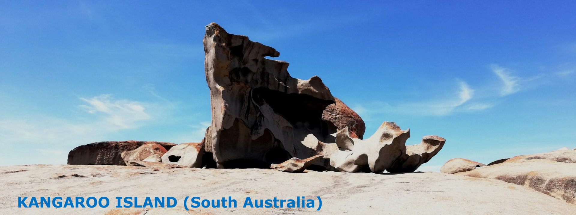
KANGAROO ISLAND (South Australia)