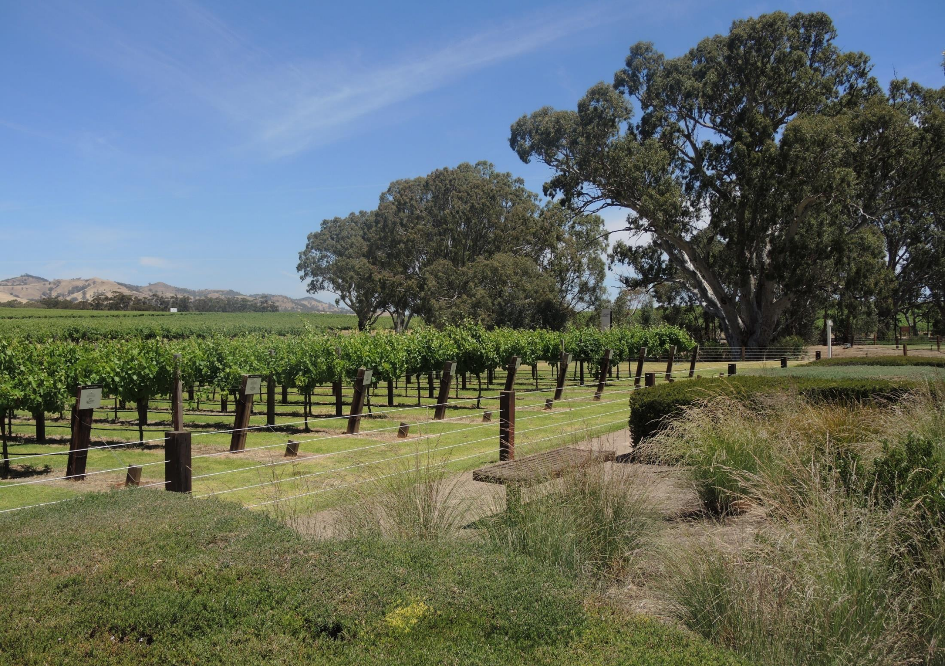
BAROSSA VALLEY (South Australia)