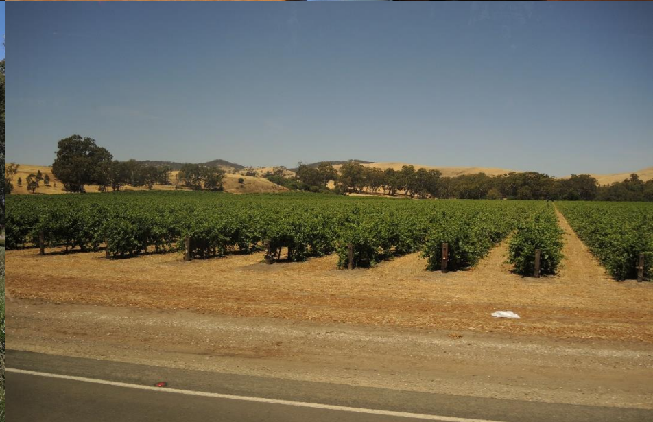
BAROSSA VALLEY (South Australia)