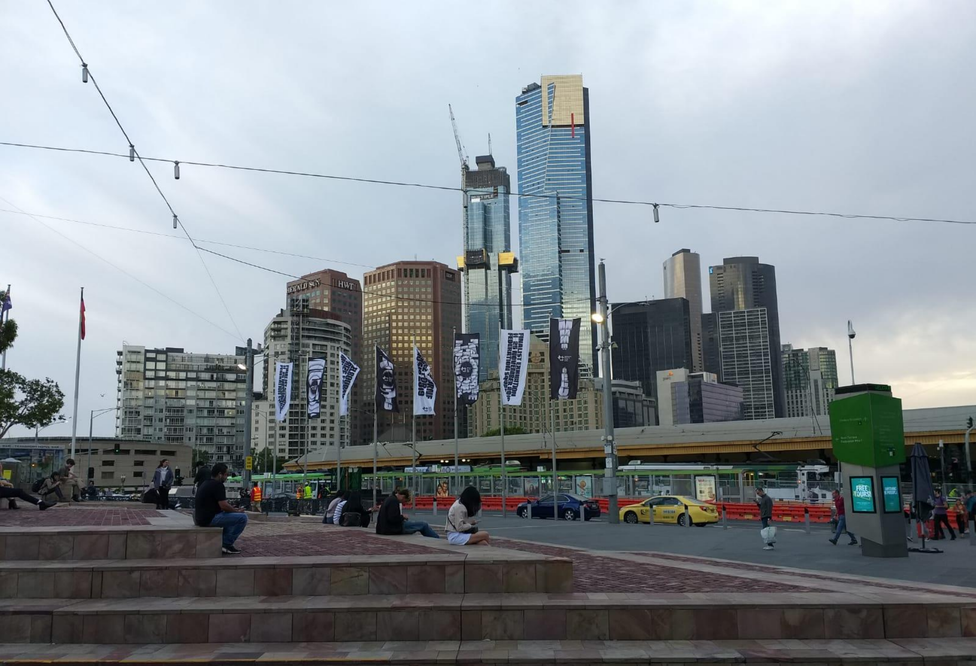
MELBOURNE (Victoria State)