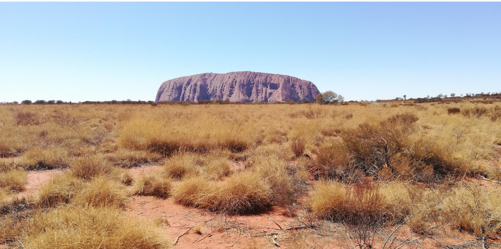
ULURU / AYERS ROCK – (Northern Territory) 1800 km ad ovest di Cairns