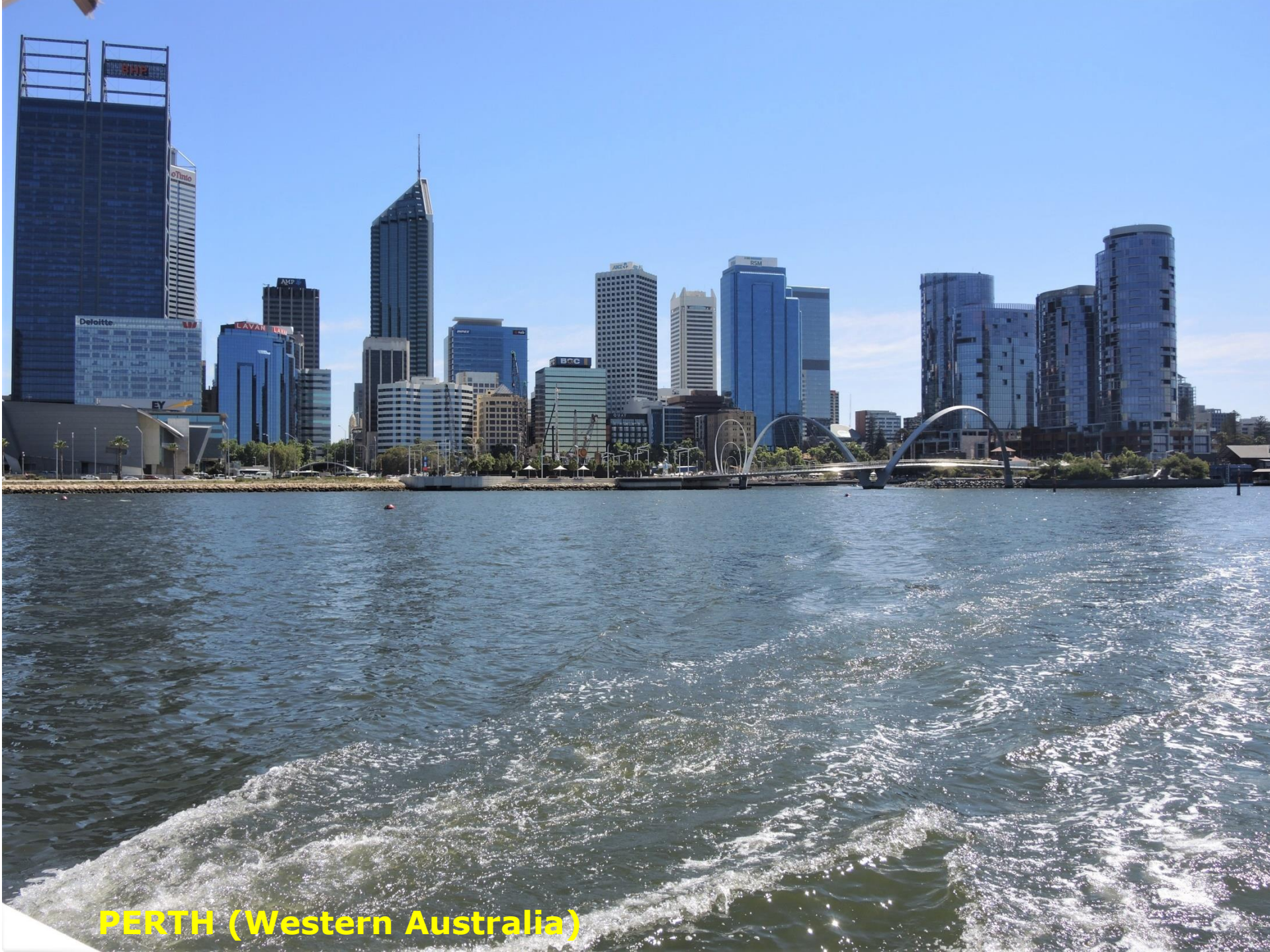
PERTH (Western Australia)