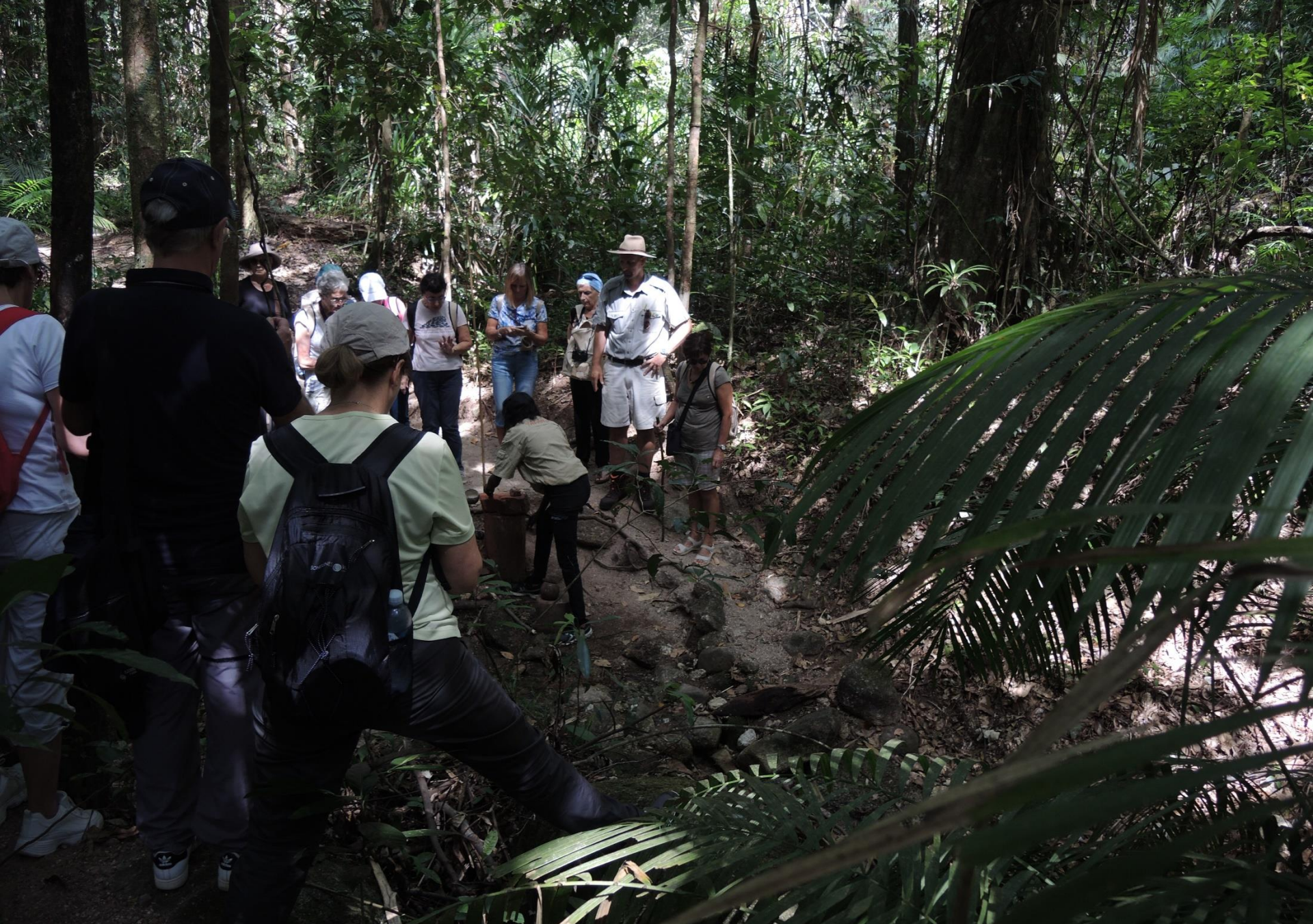
CAIRNS – Queensland (nord est Australia) – Foresta pluviale