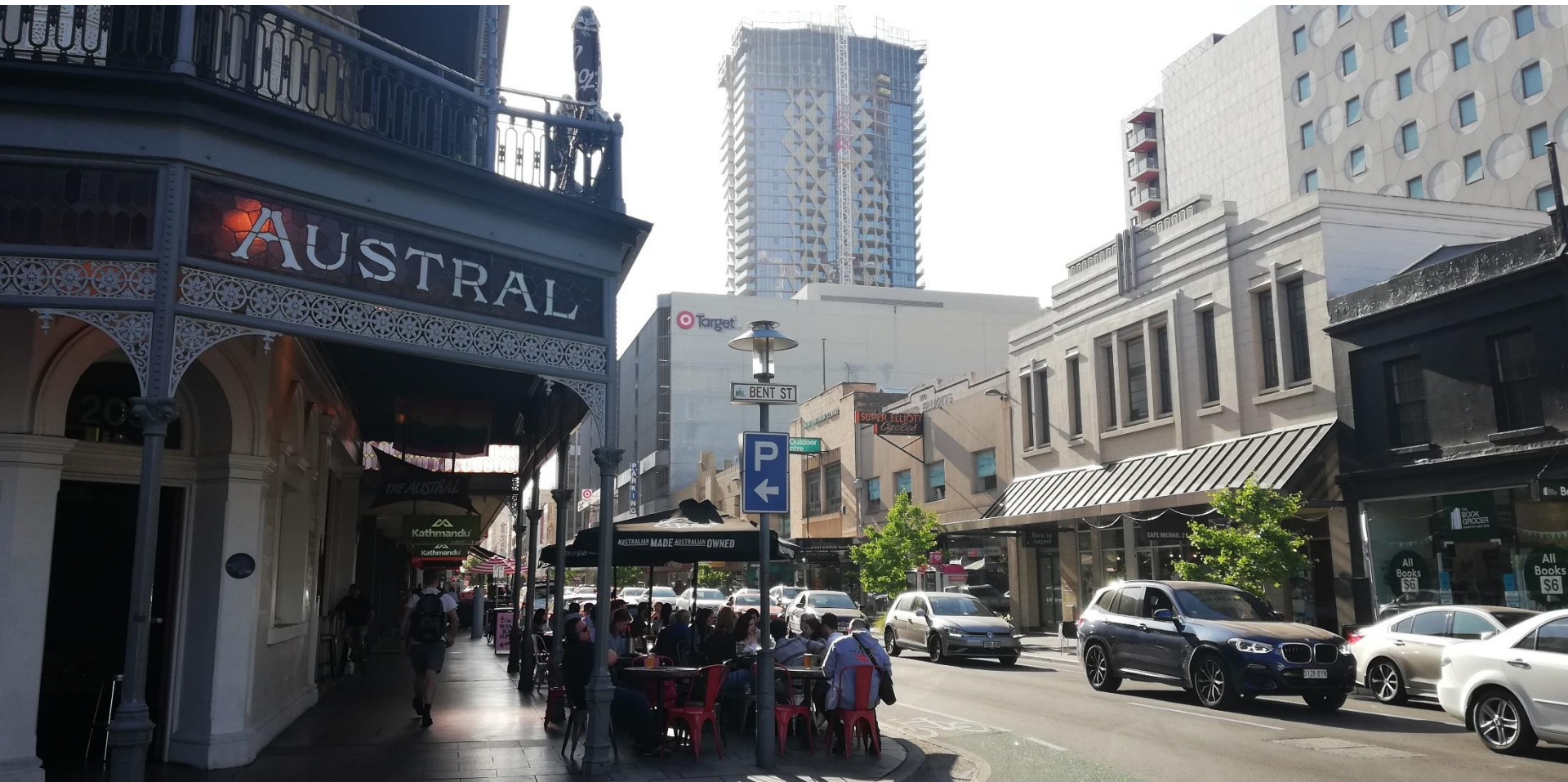
ADELAIDE (South Australia)