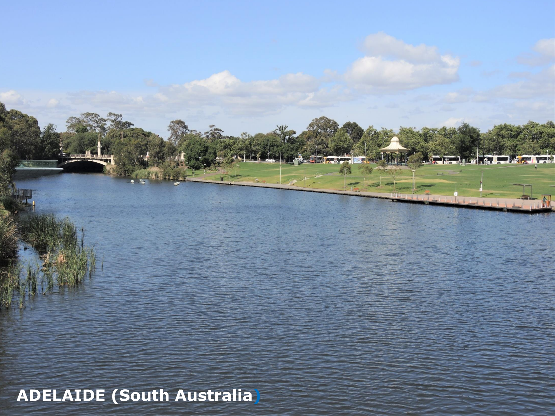
ADELAIDE (South Australia)