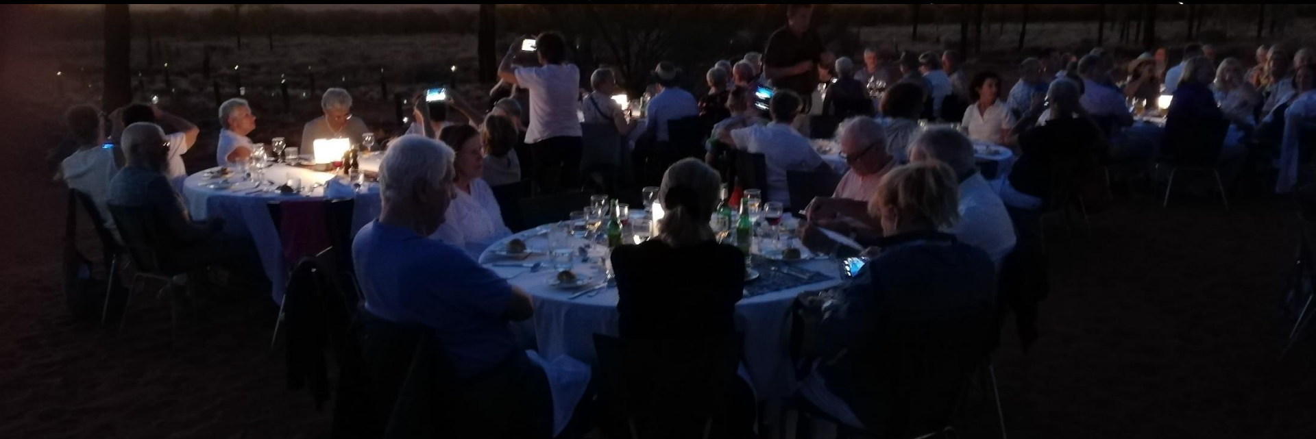
CENA ad AYERS ROCK . . . e per tetto un cielo di steele!