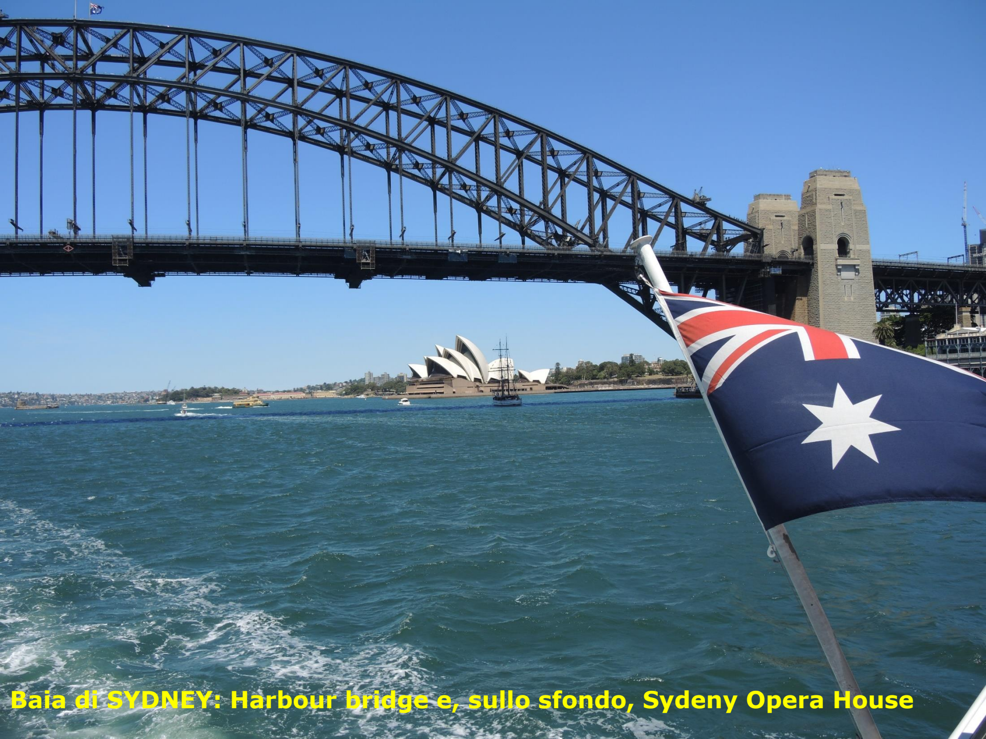
Baia di SYDNEY: Harbour bridge e, sullo sfondo, Sydeny Opera House