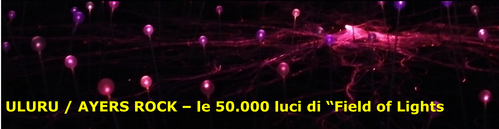
ULURU / AYERS ROCK – le 50.000 luci di "Field of Lights"