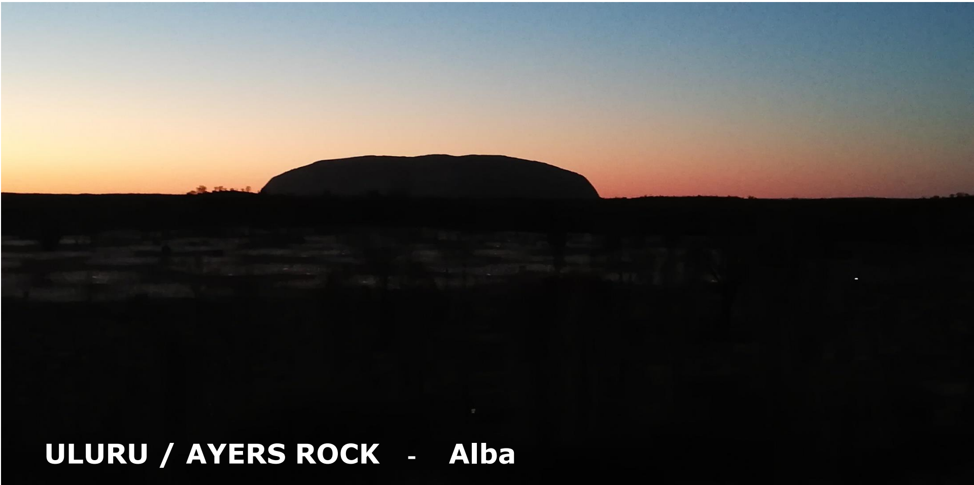
ULURU / AYERS ROCK - Alba