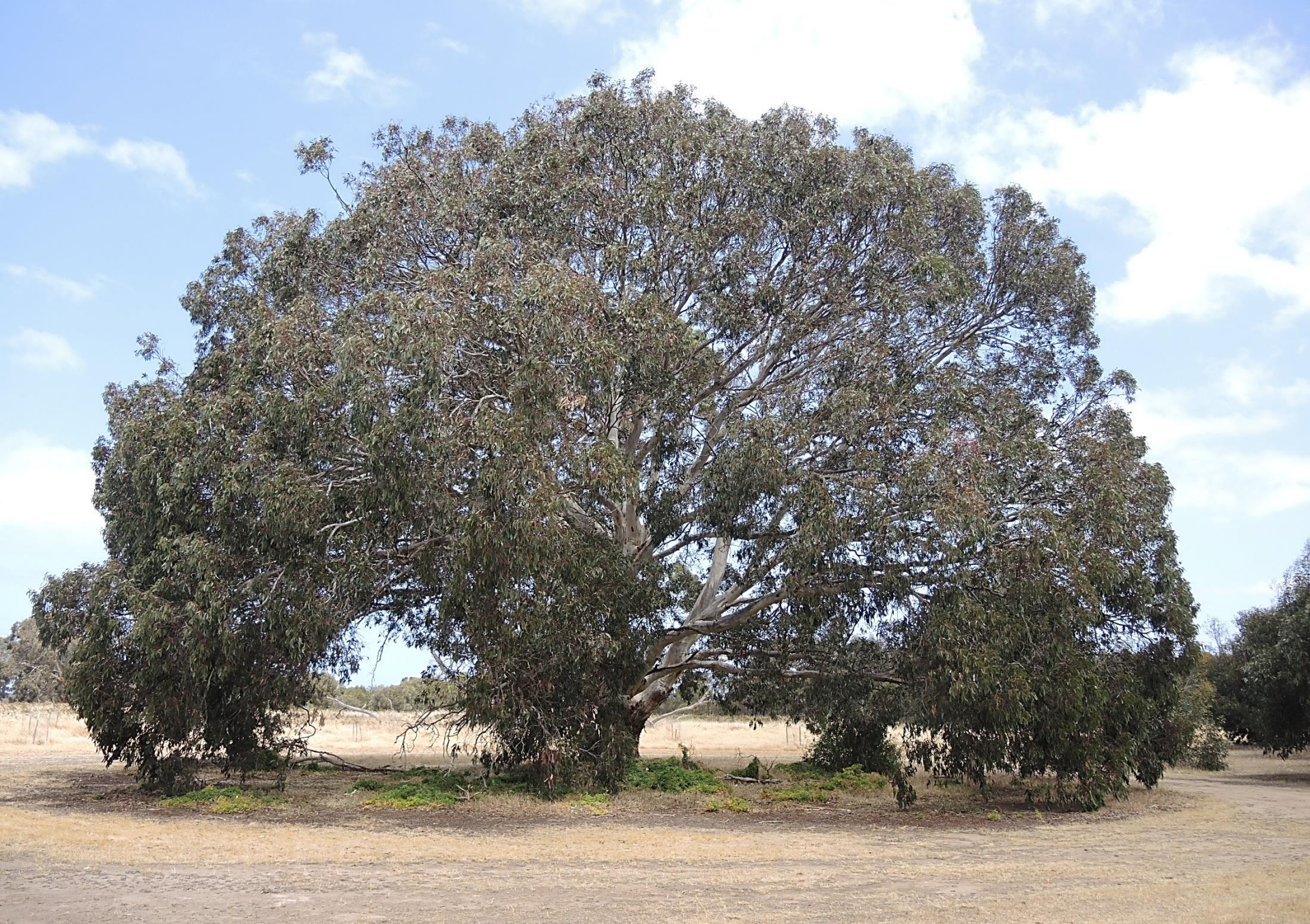
KANGAROO ISLAND (South Australia)