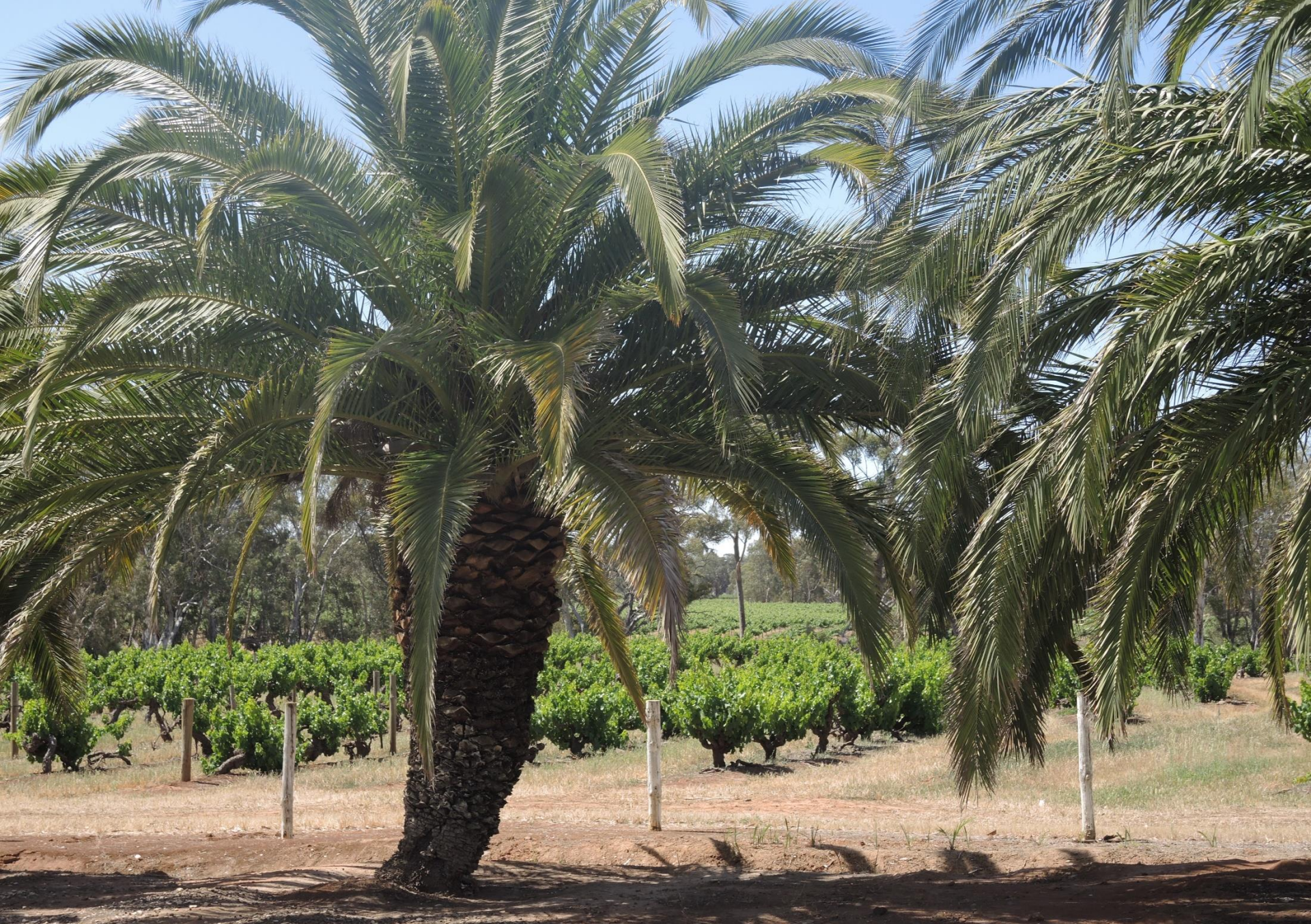
BAROSSA VALLEY (South Australia)