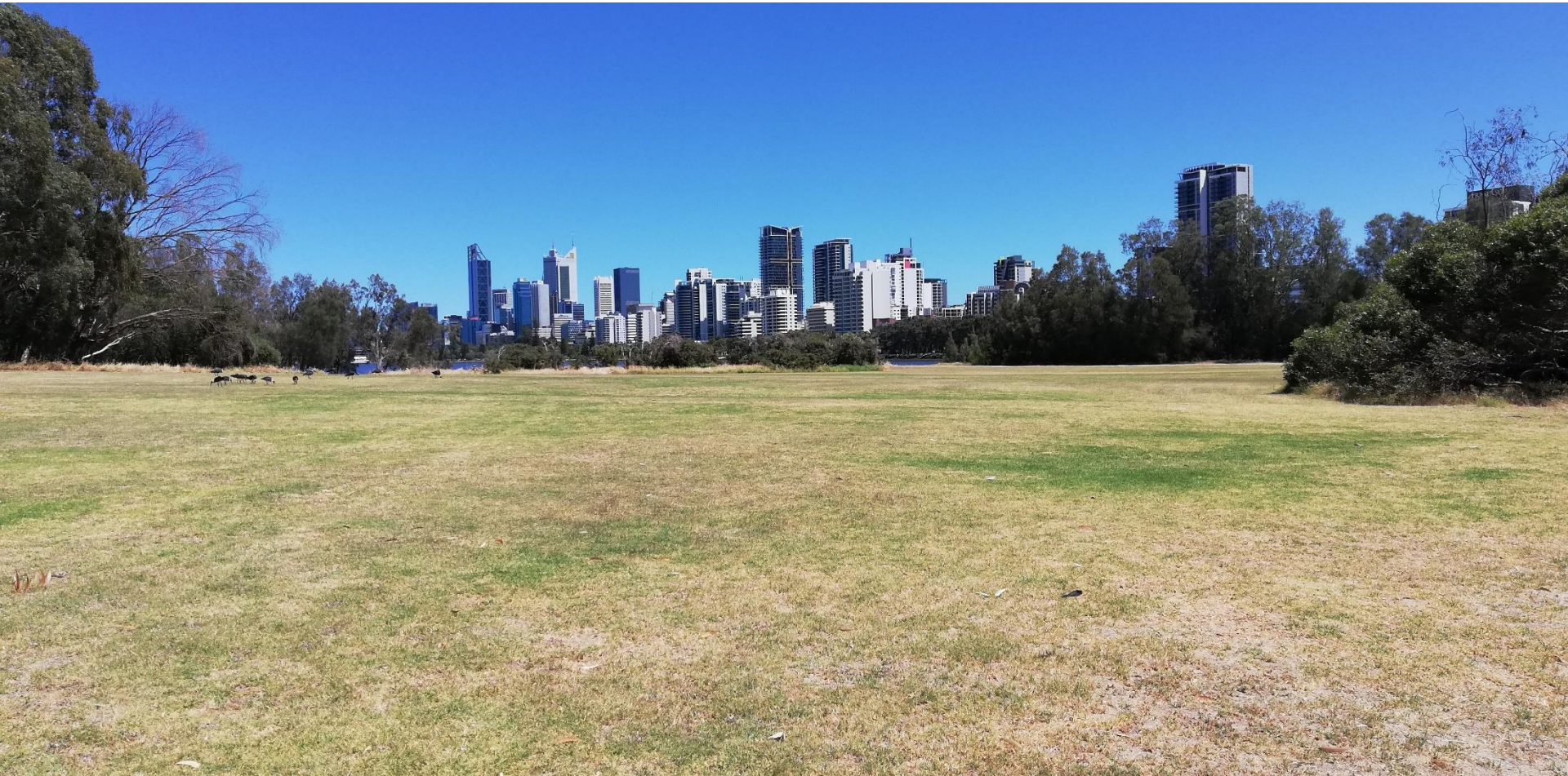
PERTH (Western Australia)