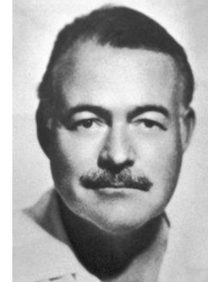
Avana Hotel Ambos Mundos.

L'hotel, ubicato nel cuore di "Avana vecchia" ha ospitato negli anni '30, per ben 7 anni, il grande scrittore americano Ernest Hemingway... e nel 2019, per due notti ha ospitato pure noi!!