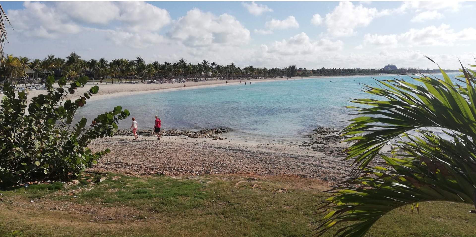
Varadero – La Playa