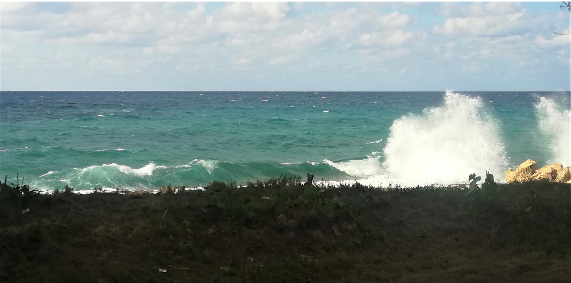
Varadero – La Playa