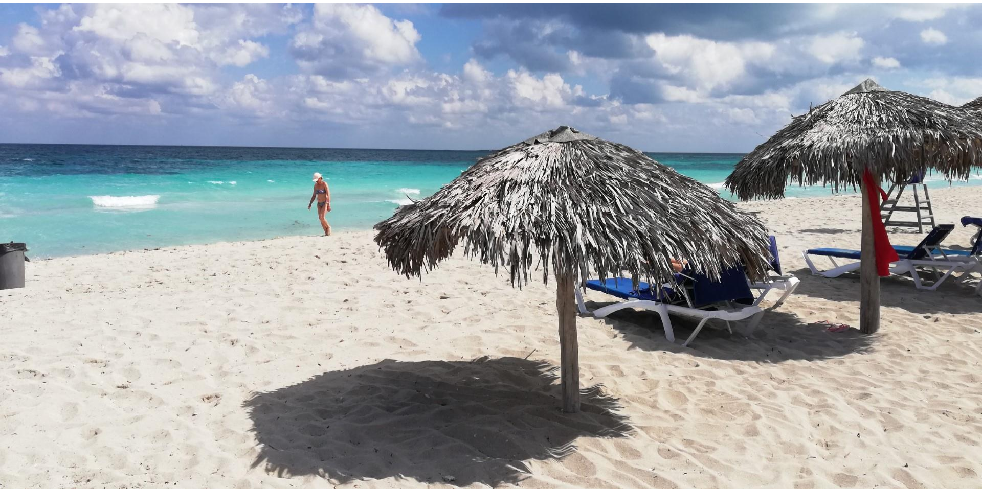
Varadero – La Playa