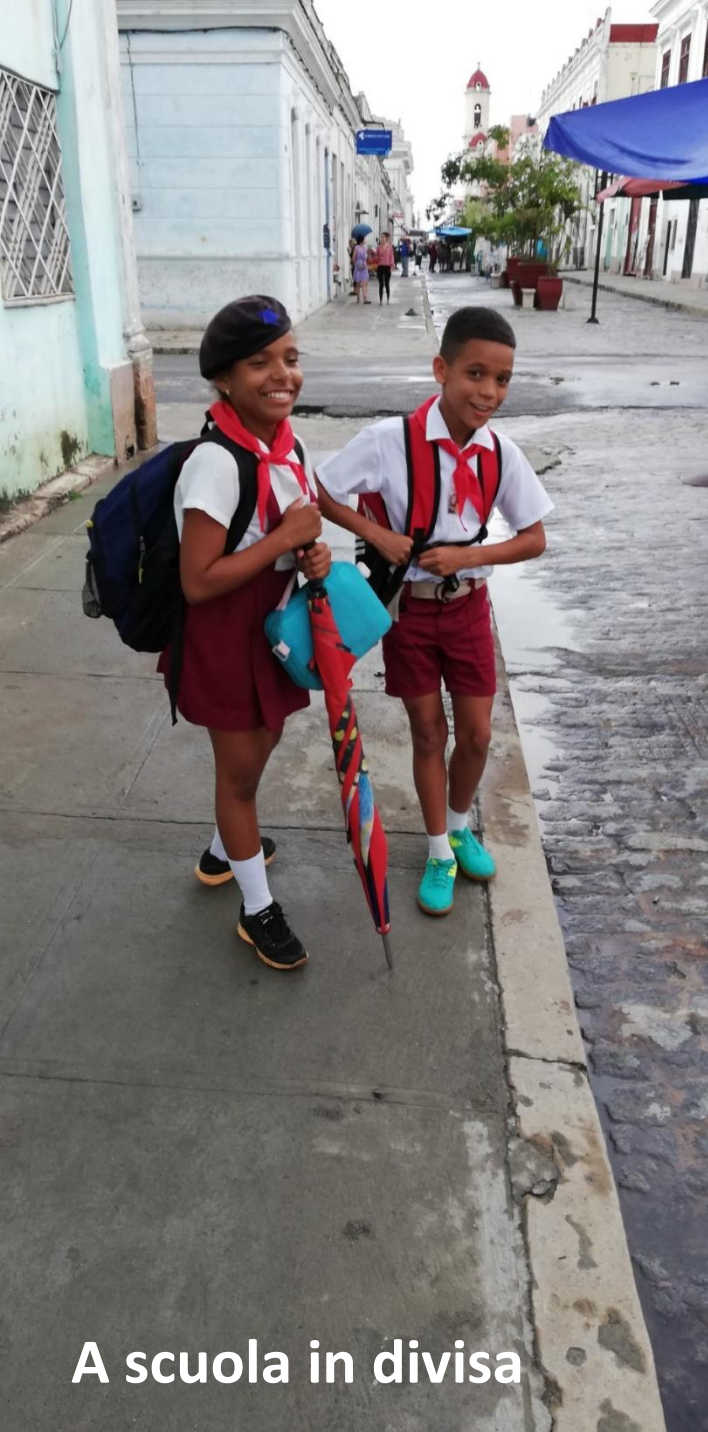
A scuola in divisa