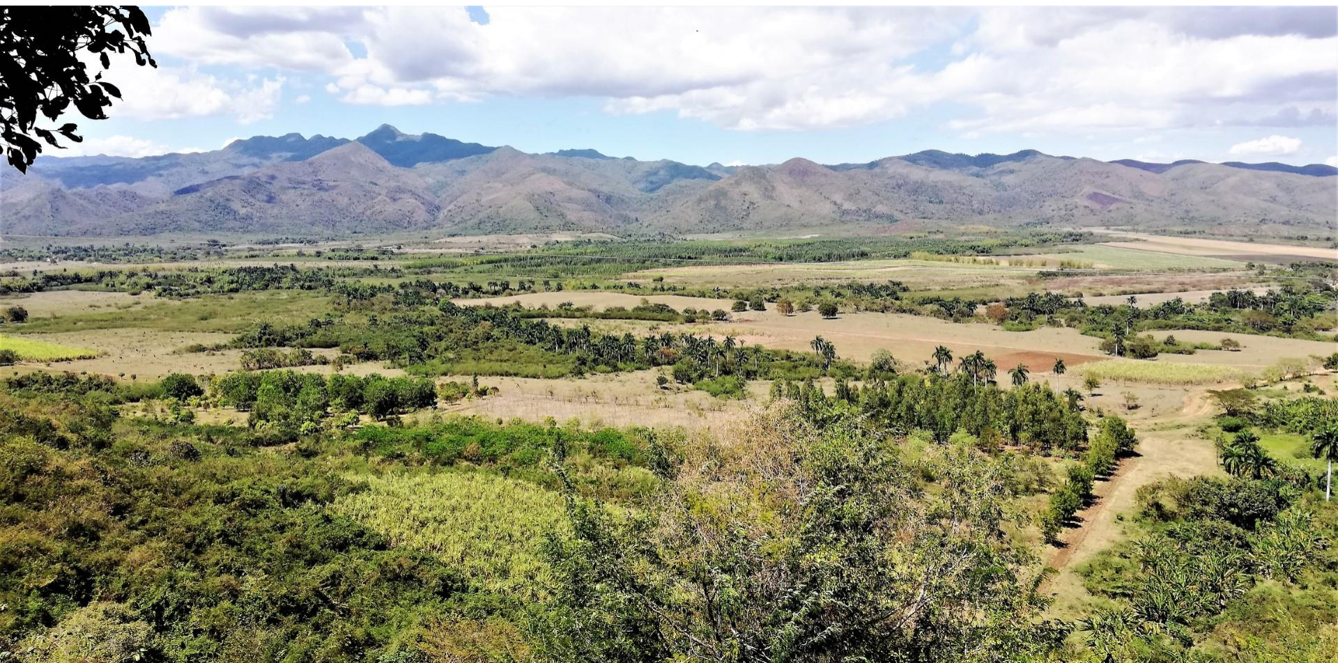
Trinidad Valle de Los Ingenios, la zona degli ex zuccherifici