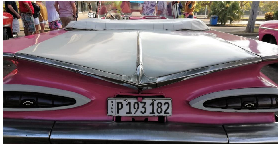
Avana – Olds . . . mobiles