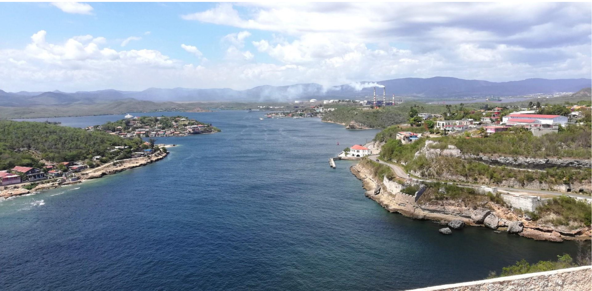
Santiago de Cuba - Panoramica dal El Morro