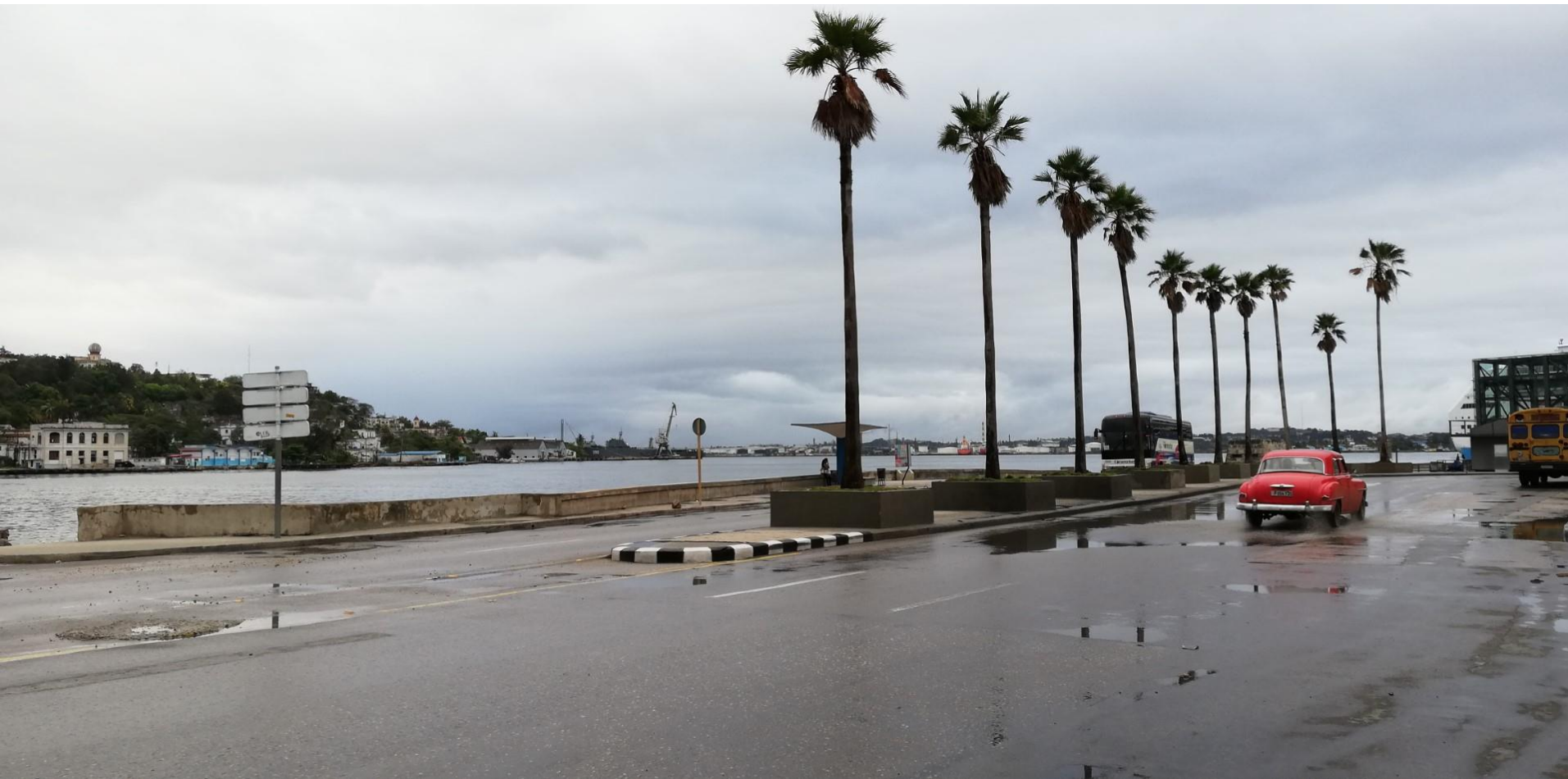
Avana – malinconico ..... Malecon