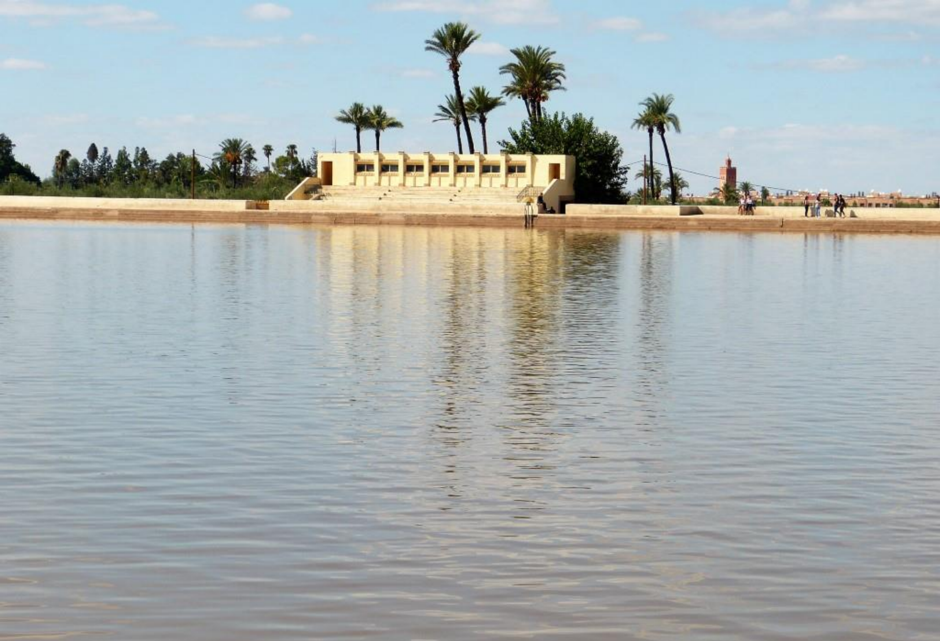
MARRAKECH – bacino della Menara