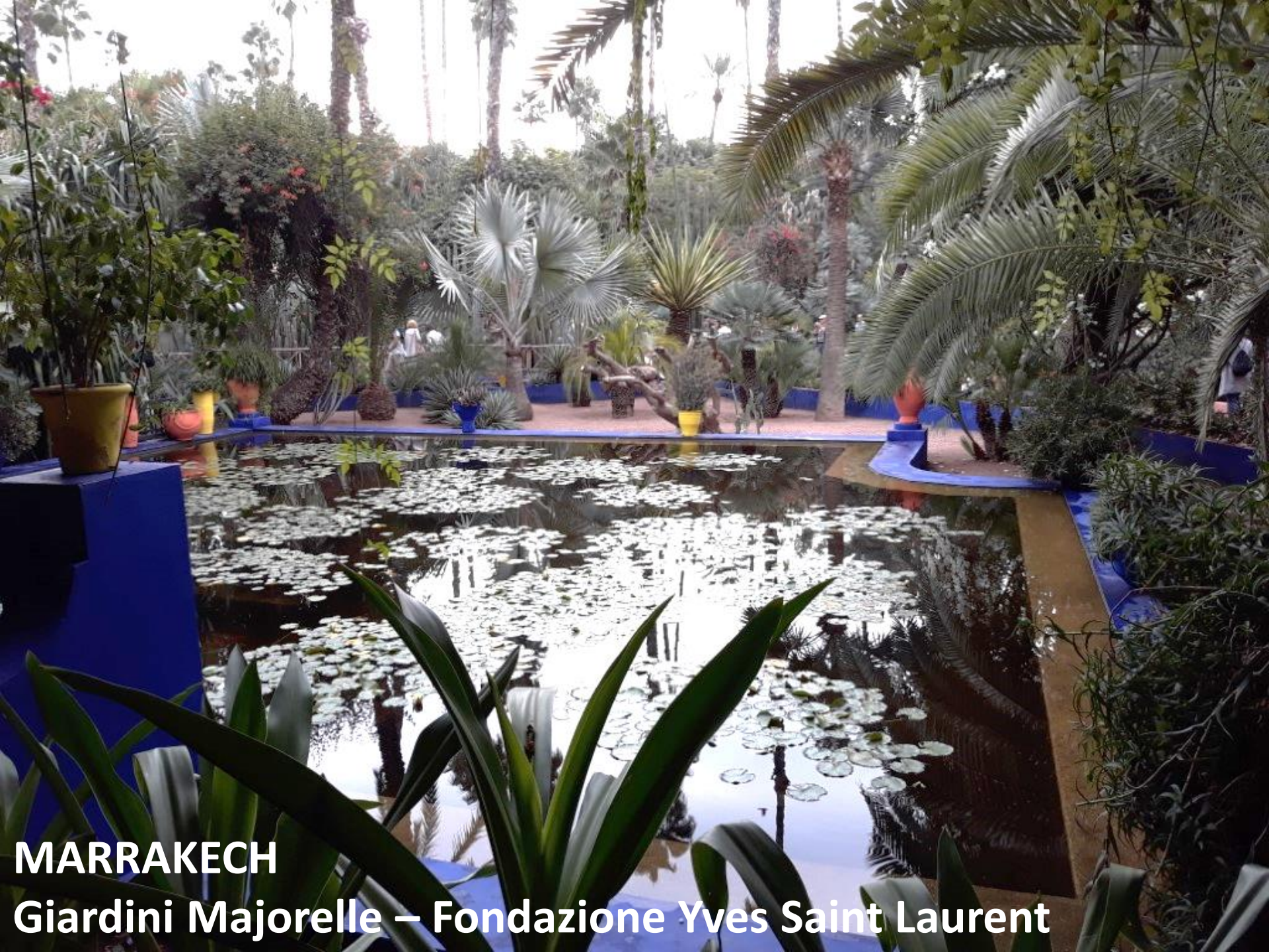
MARRAKECH Giardini Majorelle – Fondazione Yves Saint Laurent