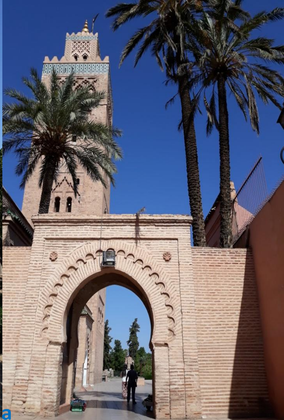
MARRAKECH – Koutoubia