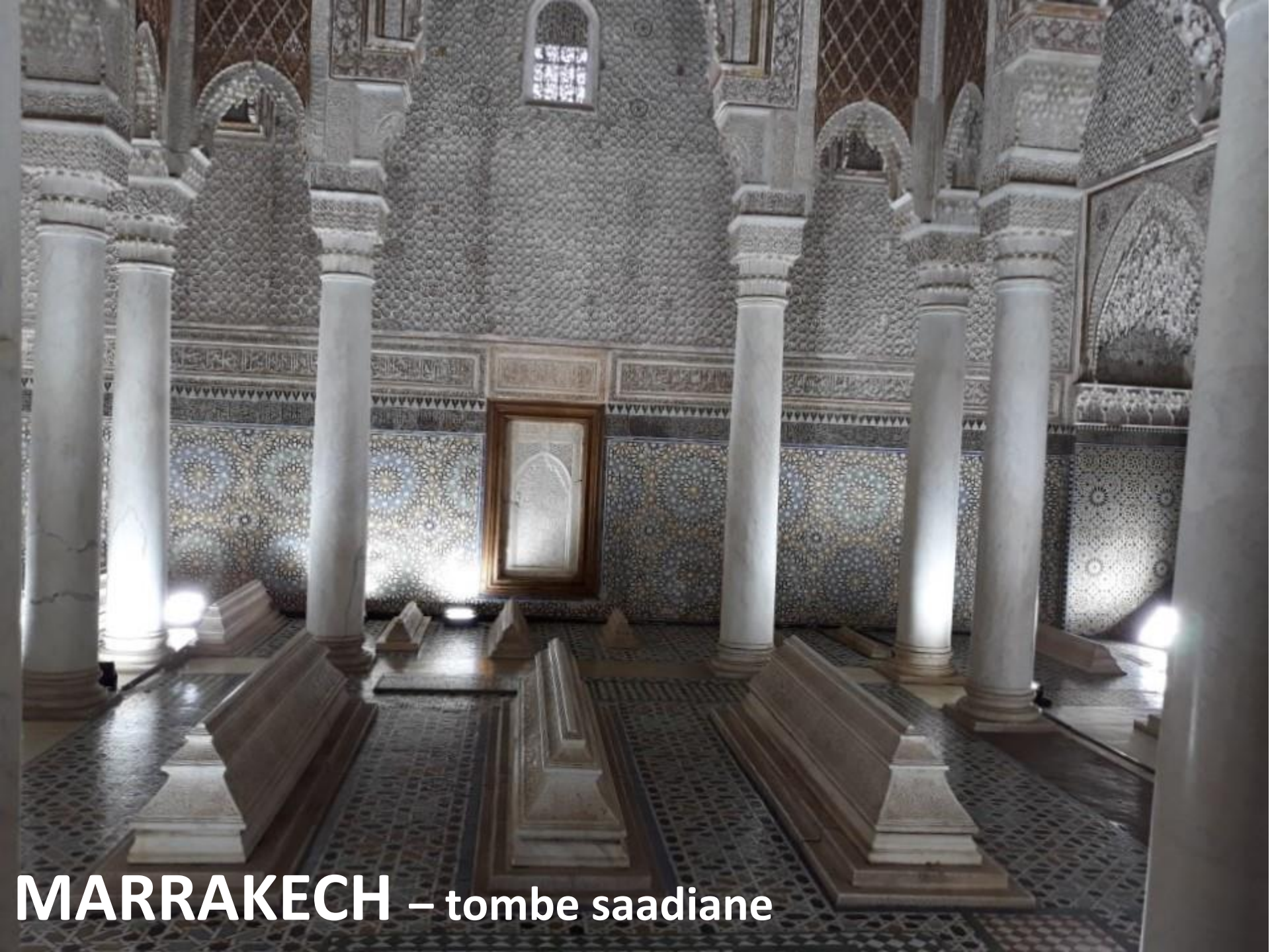
MARRAKECH – tombe saadiane