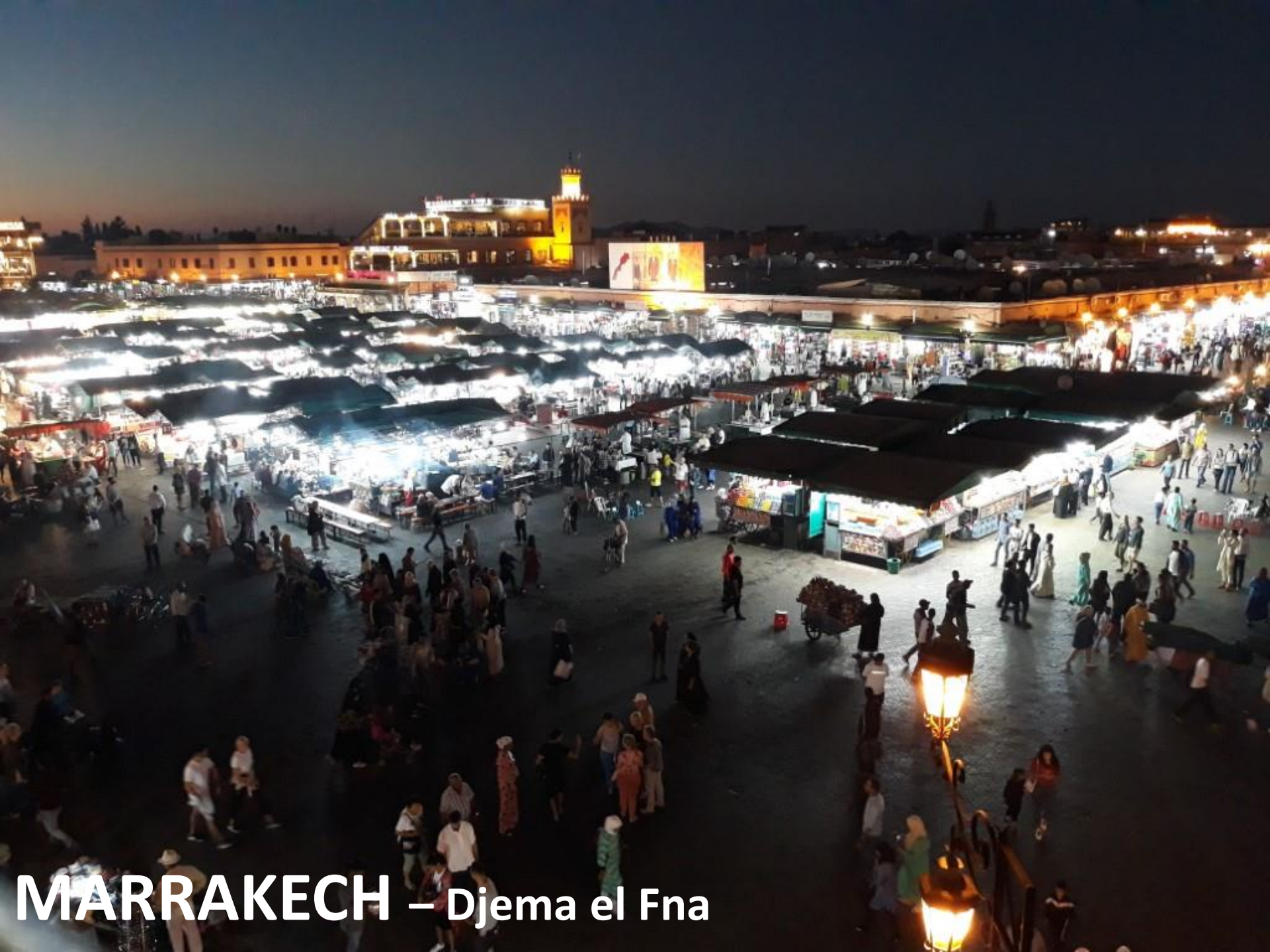
MARRAKECH – Djema el Fna