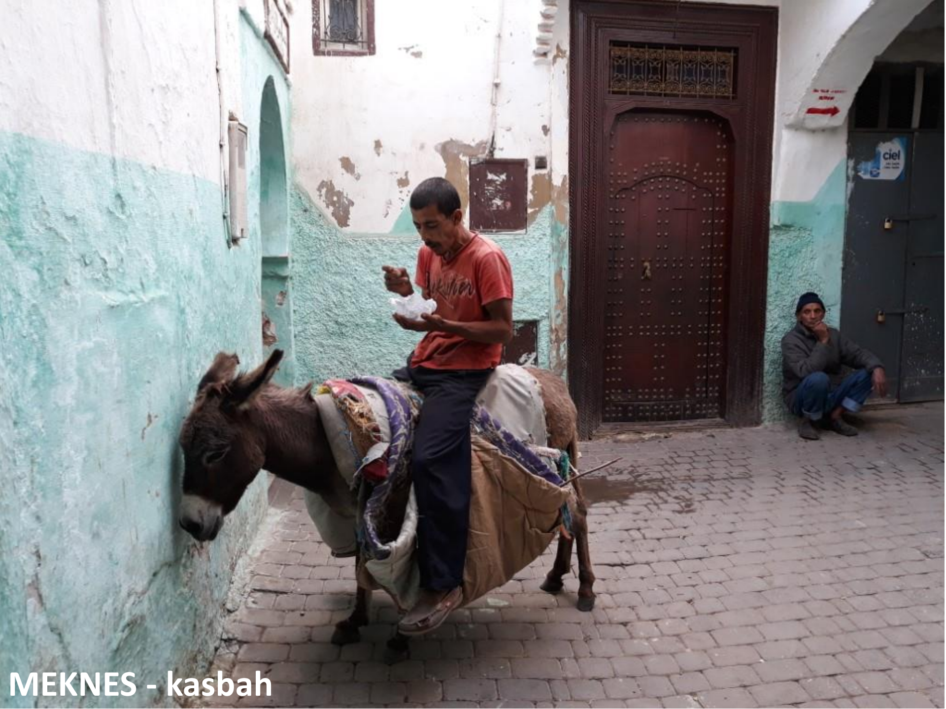
MEKNES - kasbah