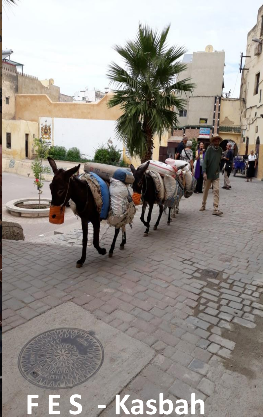
F E S - Kasbah