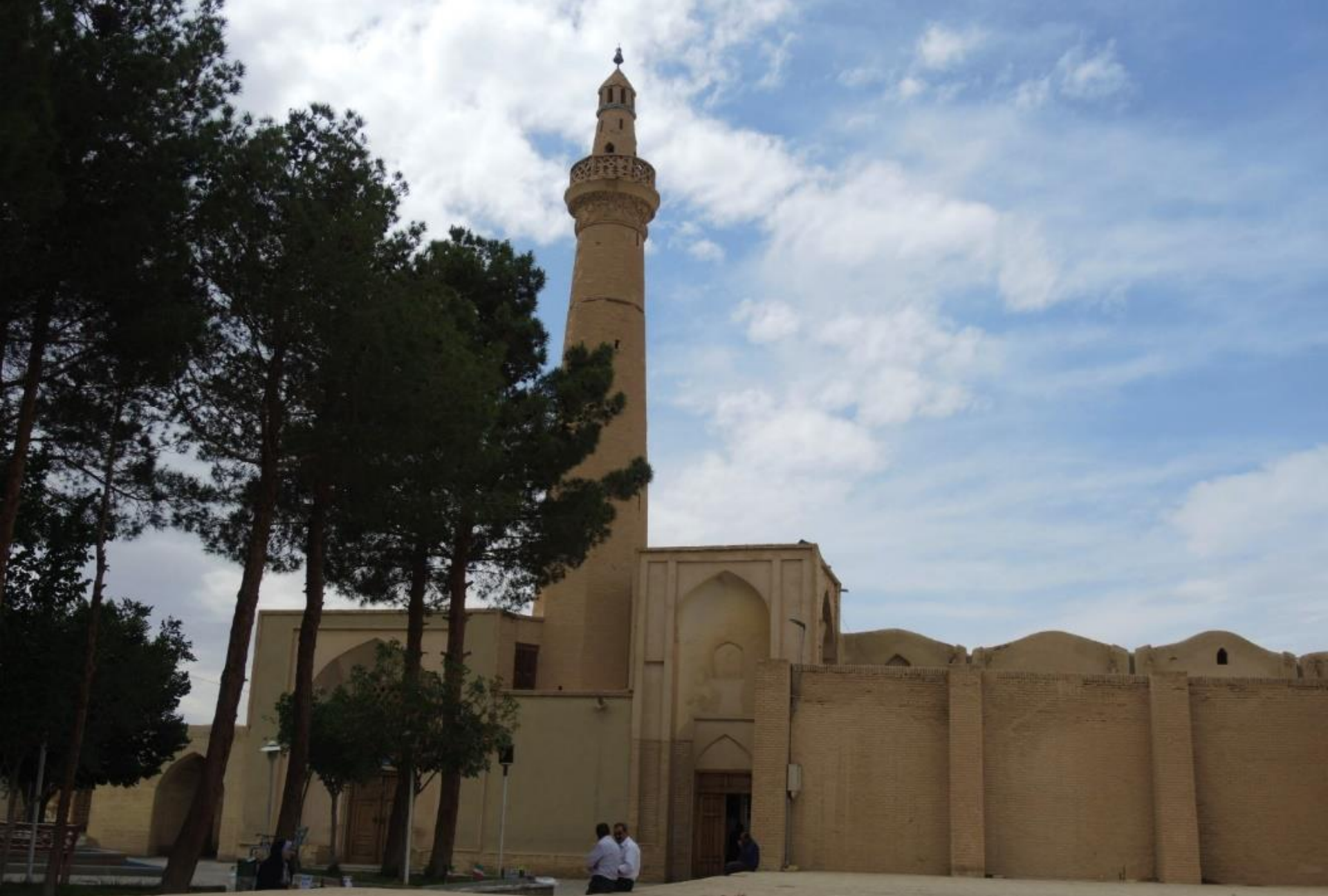
Nain – Moschea del X° secolo