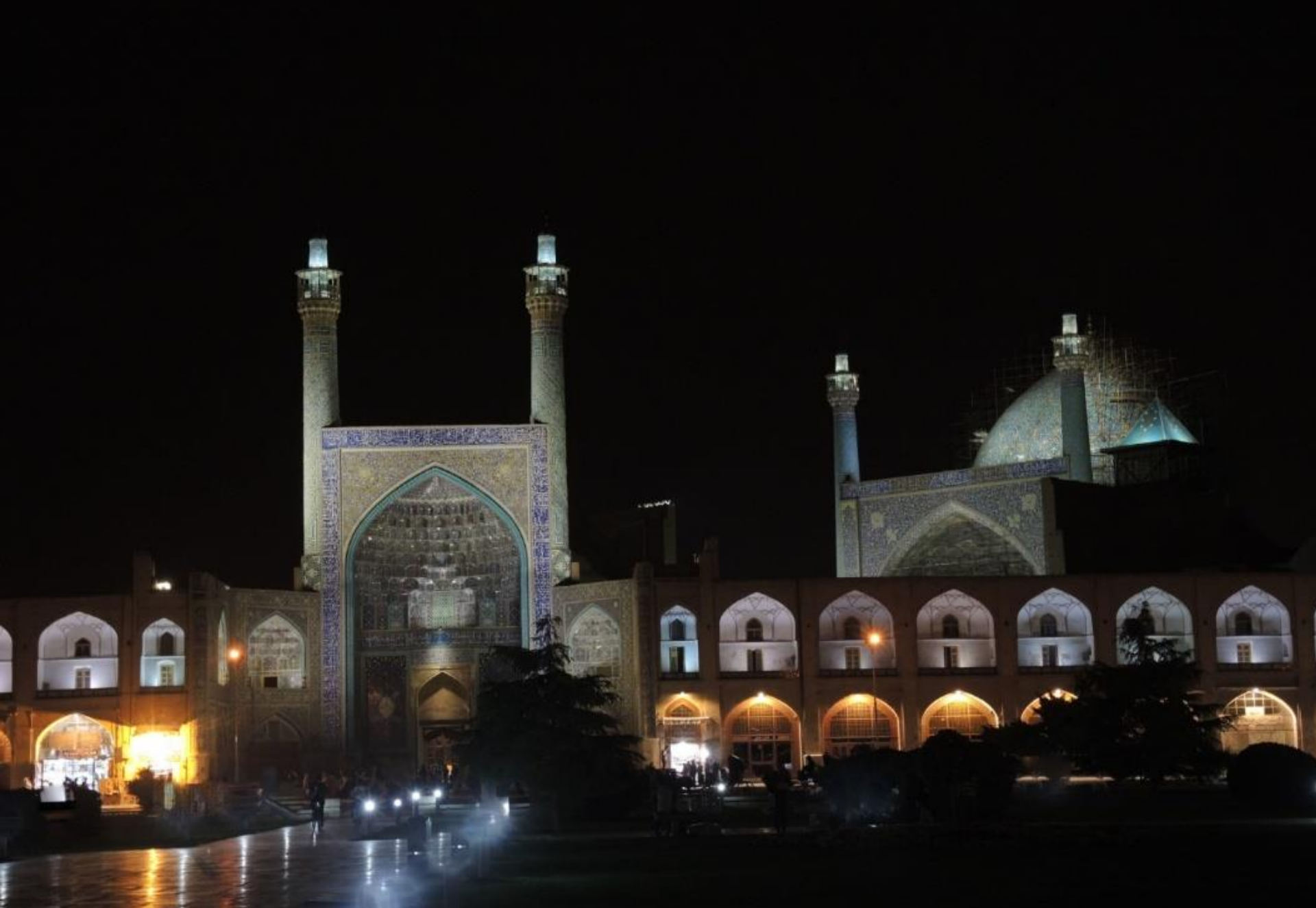
Esfahan - Naqsh e Jahan (Imam Square)