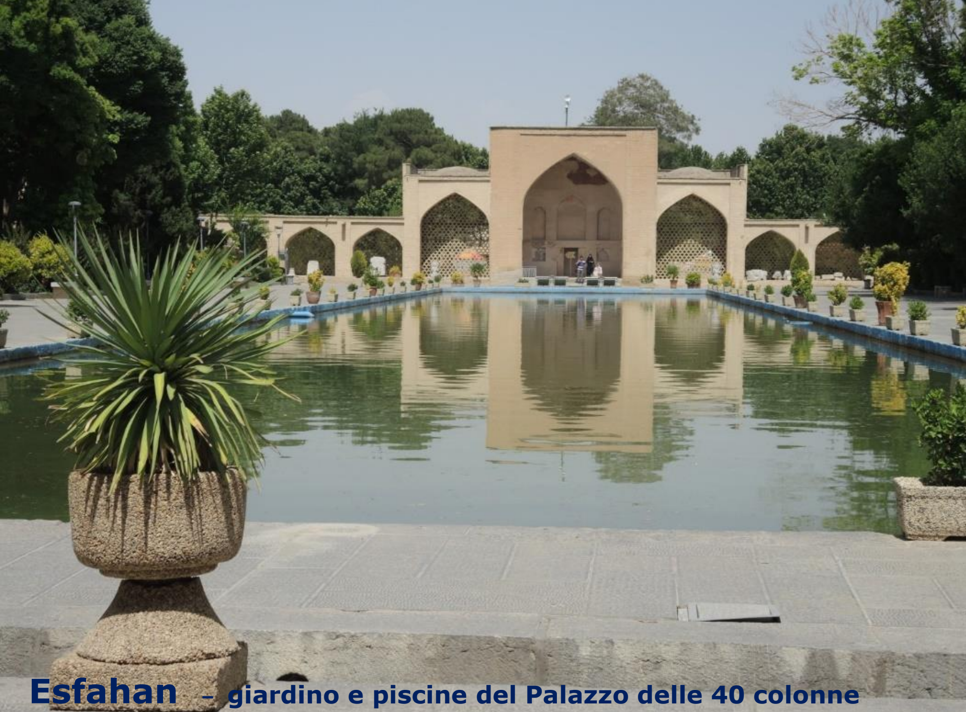
Esfahan – giardino e piscine del Palazzo delle 40 colonne