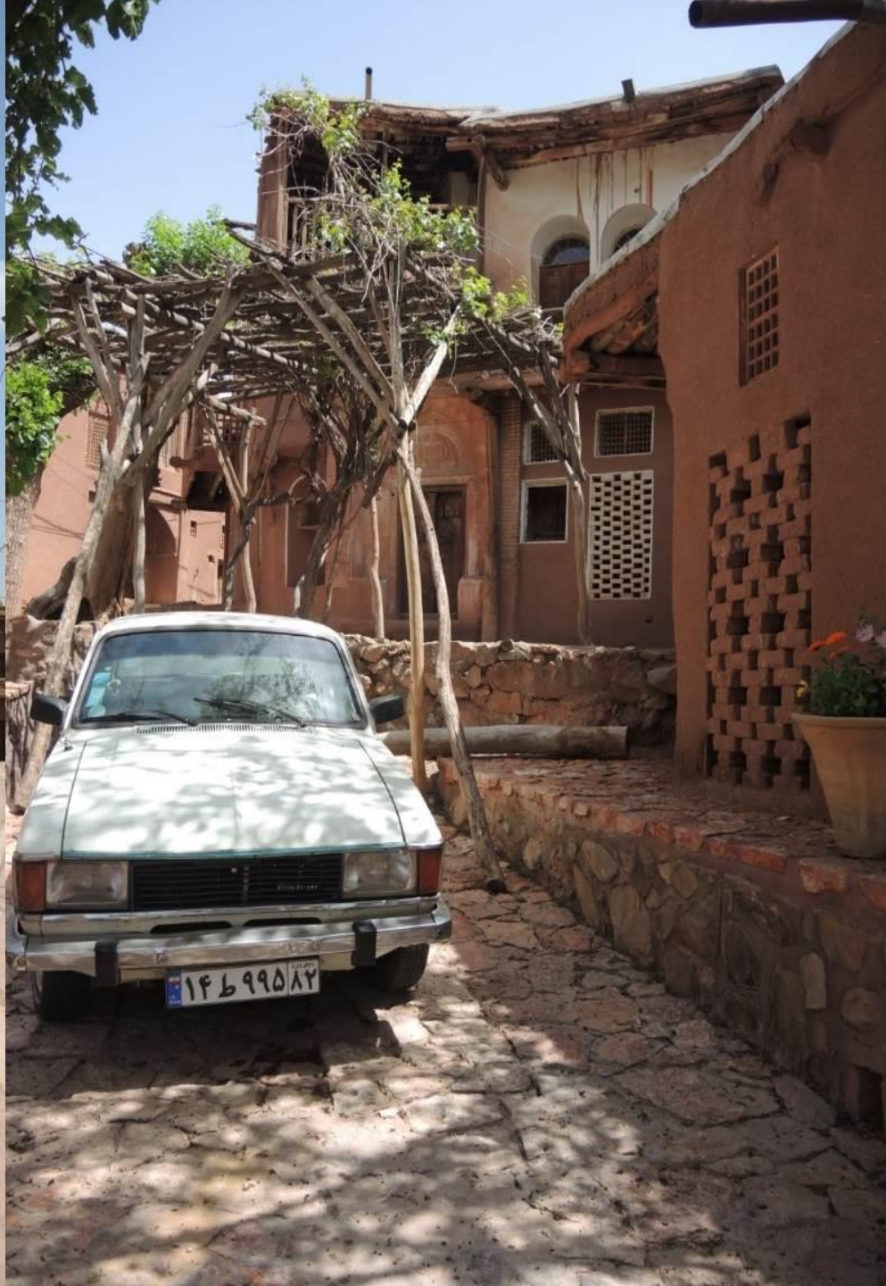
Abyaneh – Monti Zagros