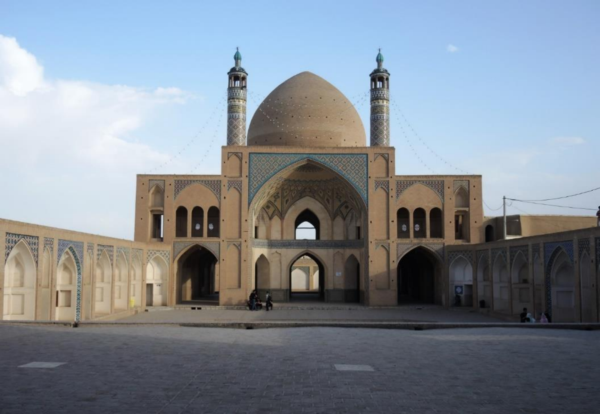
Kashan – Scuola coranica