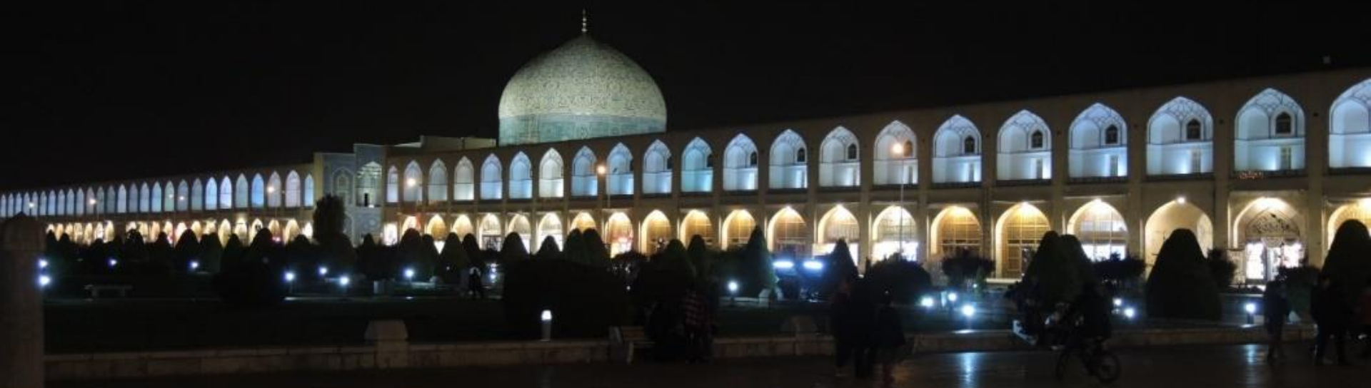
Esfahan - Naqsh e Jahan (Imam Square)