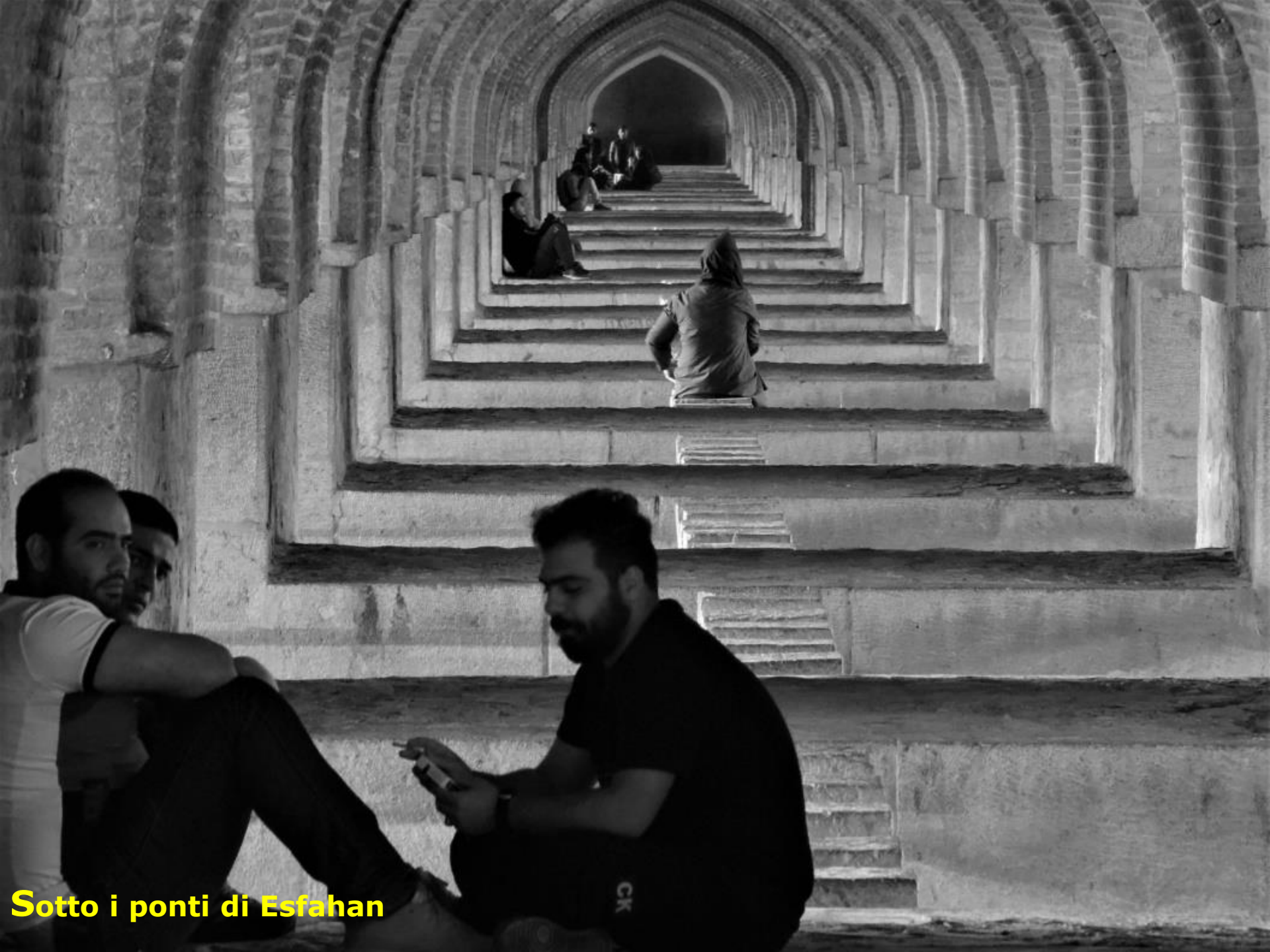
Sotto i ponti di Esfahan