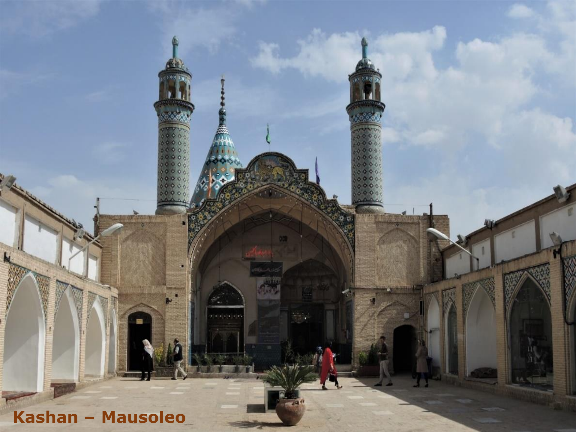
Kashan – Mausoleo