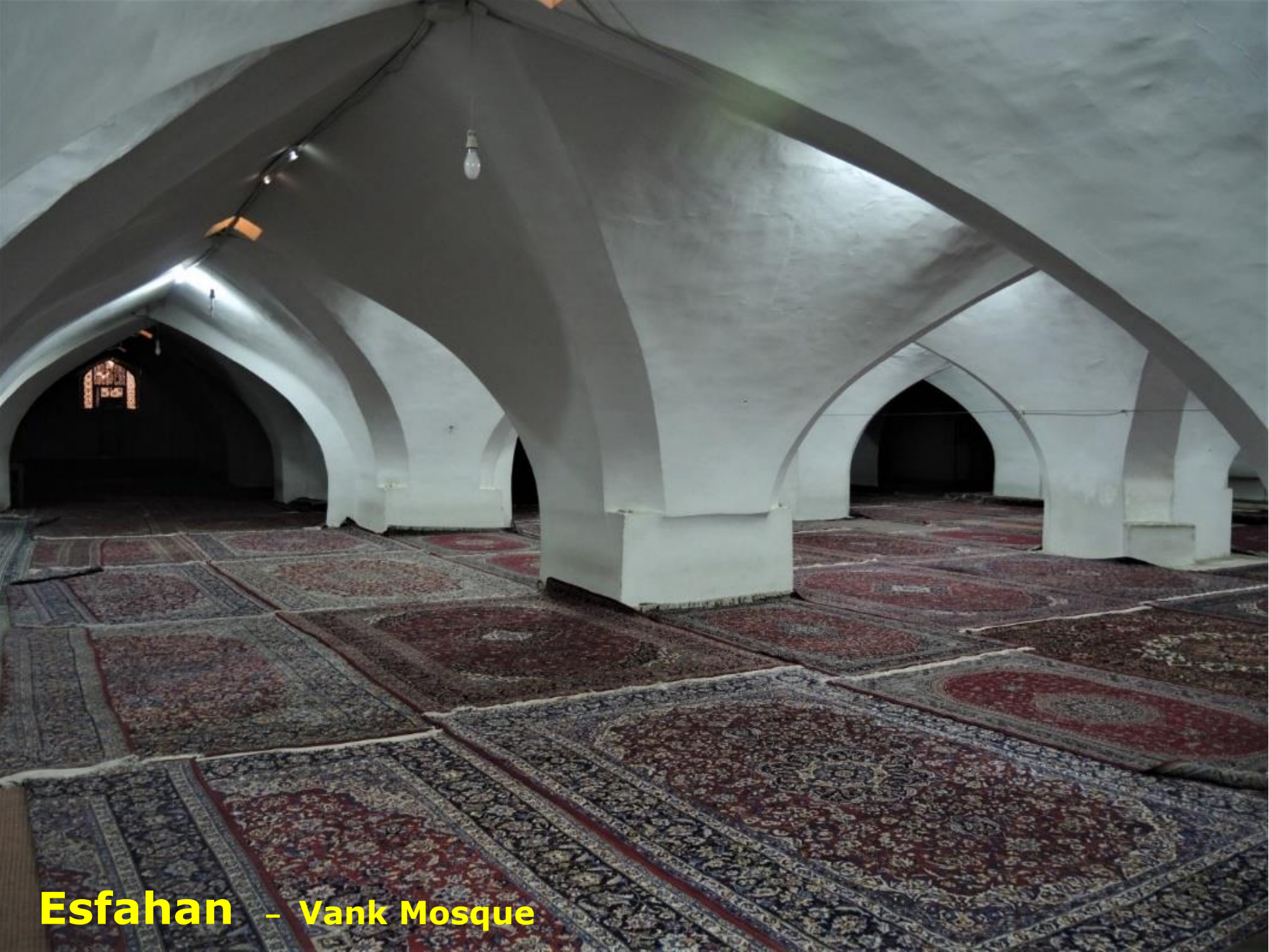
Esfahan - Vank Mosque