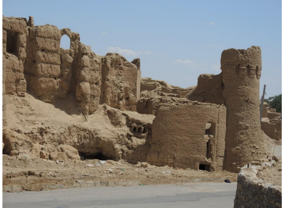
Meybod – costruzioni in adobe