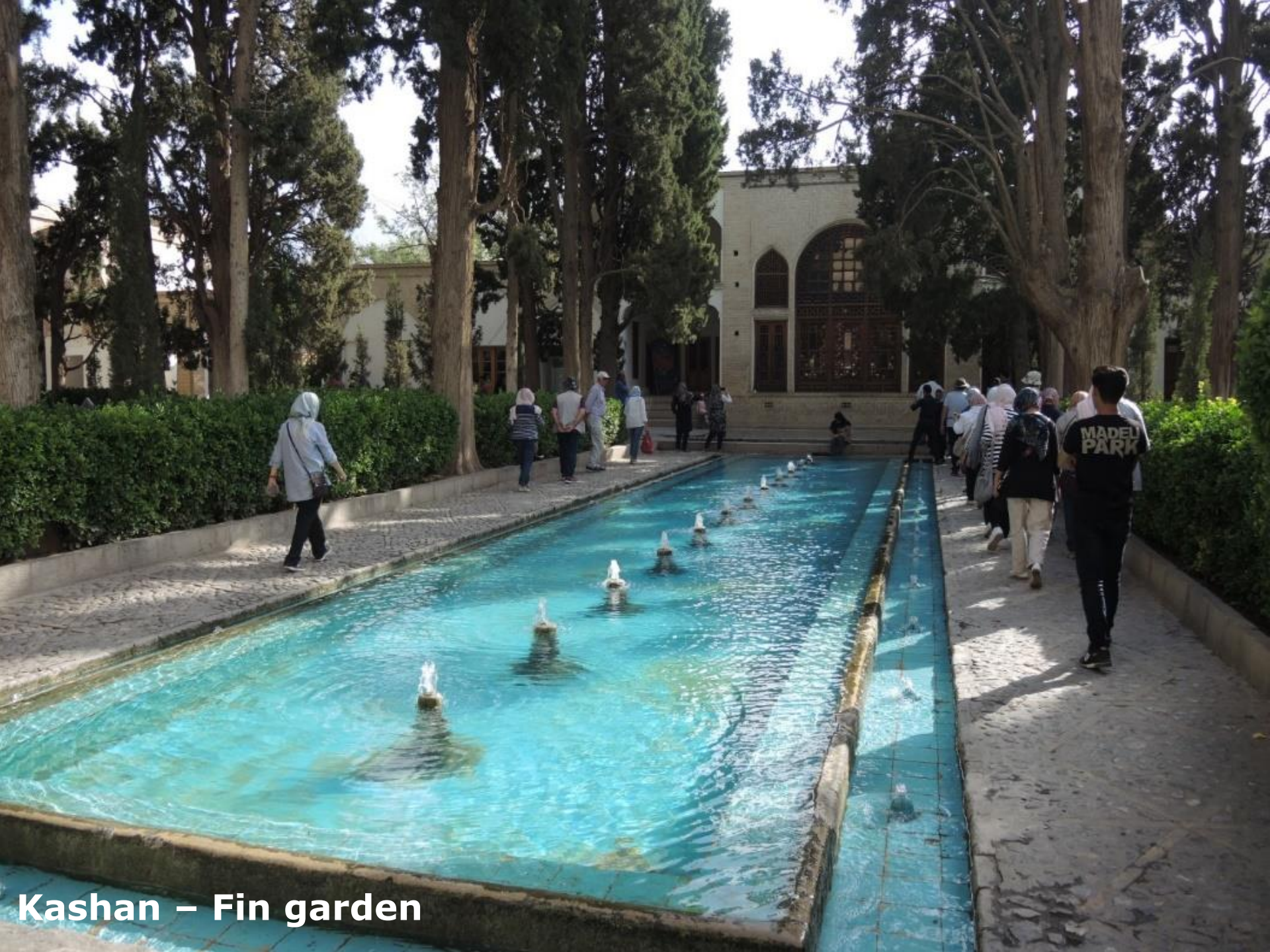
Kashan – Fin garden