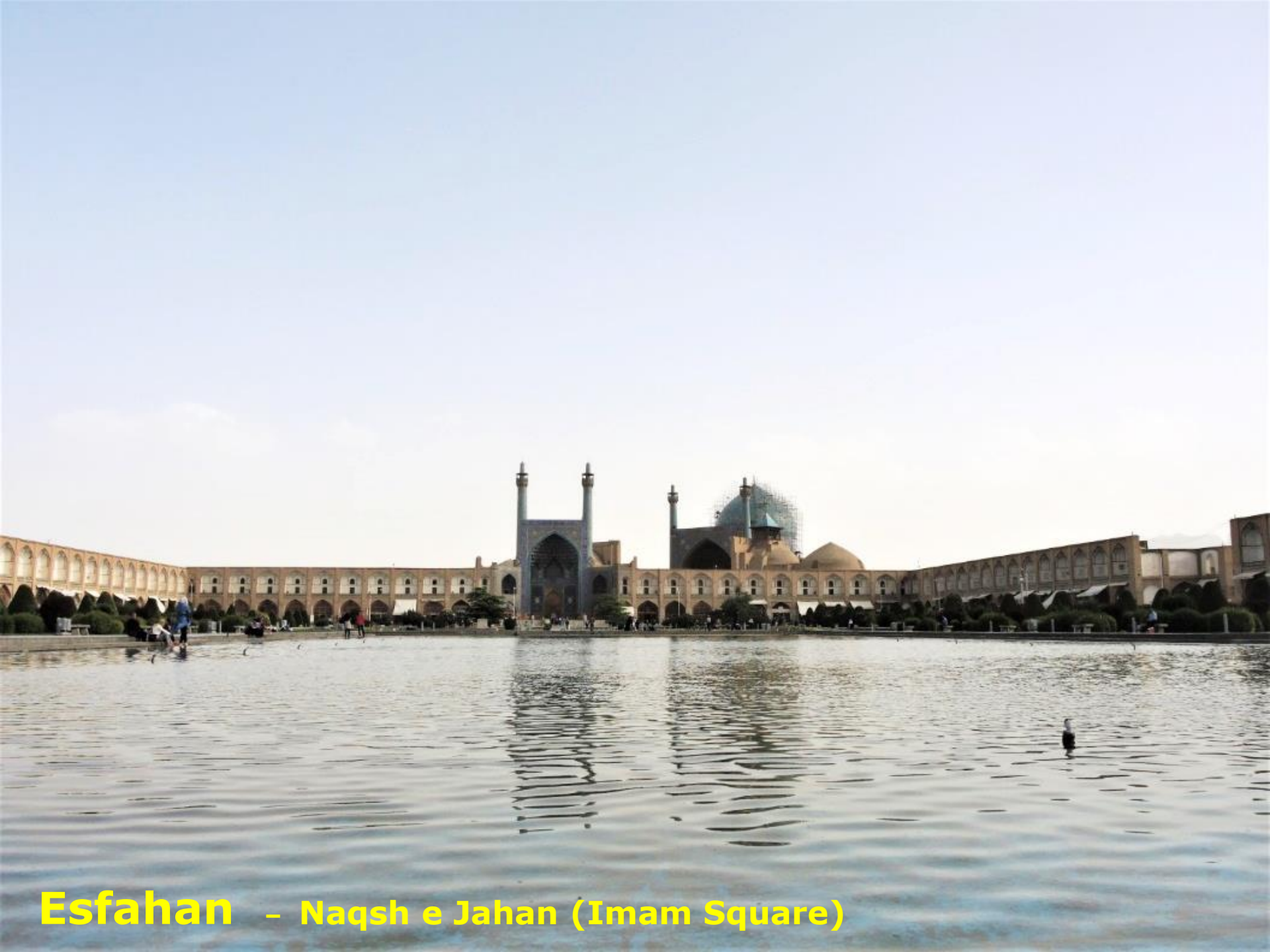
Esfahan - Naqsh e Jahan (Imam Square)