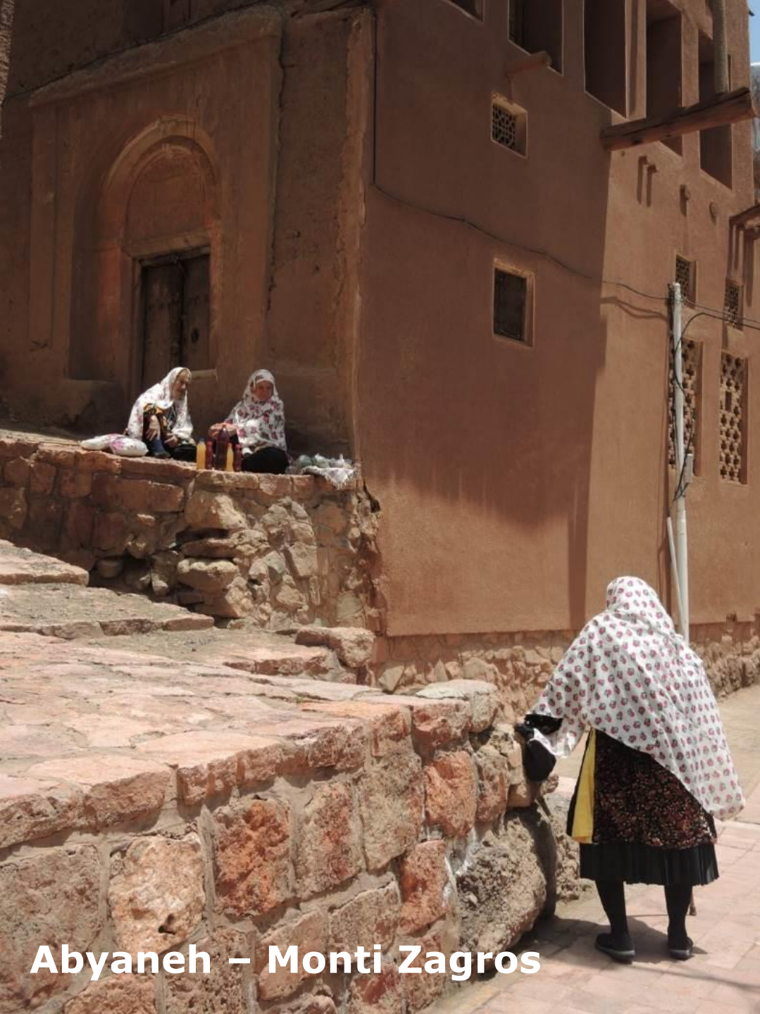
Abyaneh – Monti Zagros