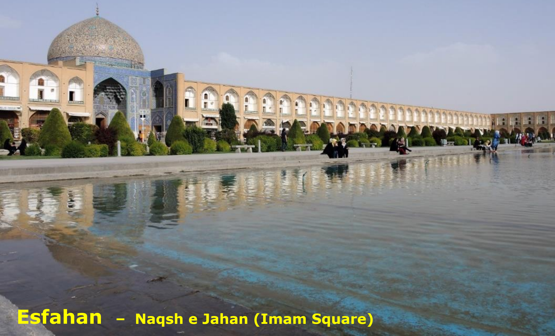
Esfahan – Naqsh e Jahan (Imam Square)