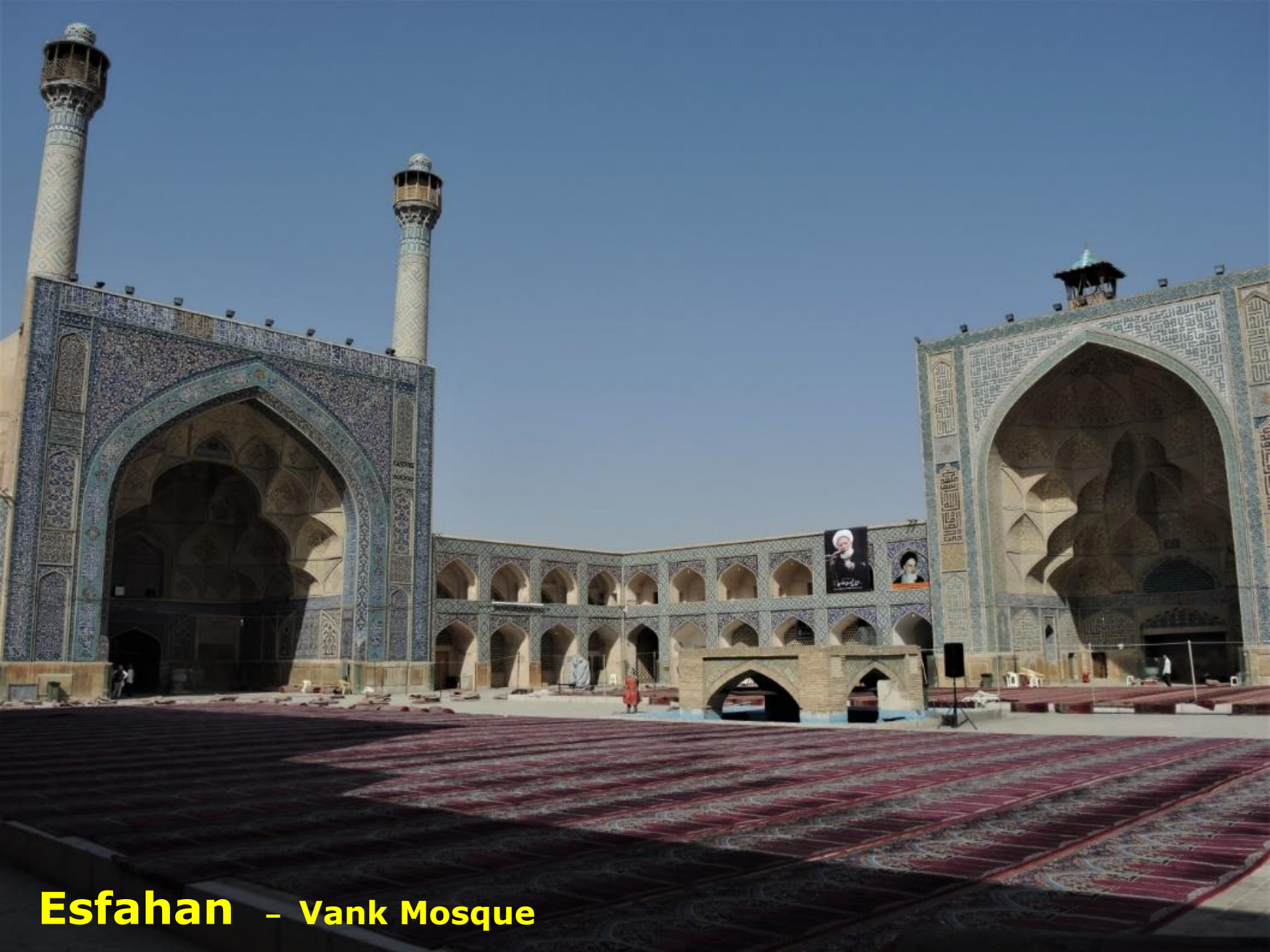
Esfahan - Vank Mosque