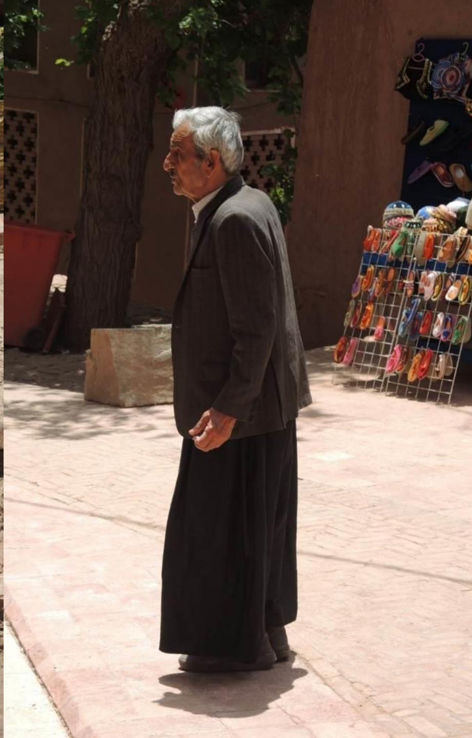
Abyaneh – Monti Zagros