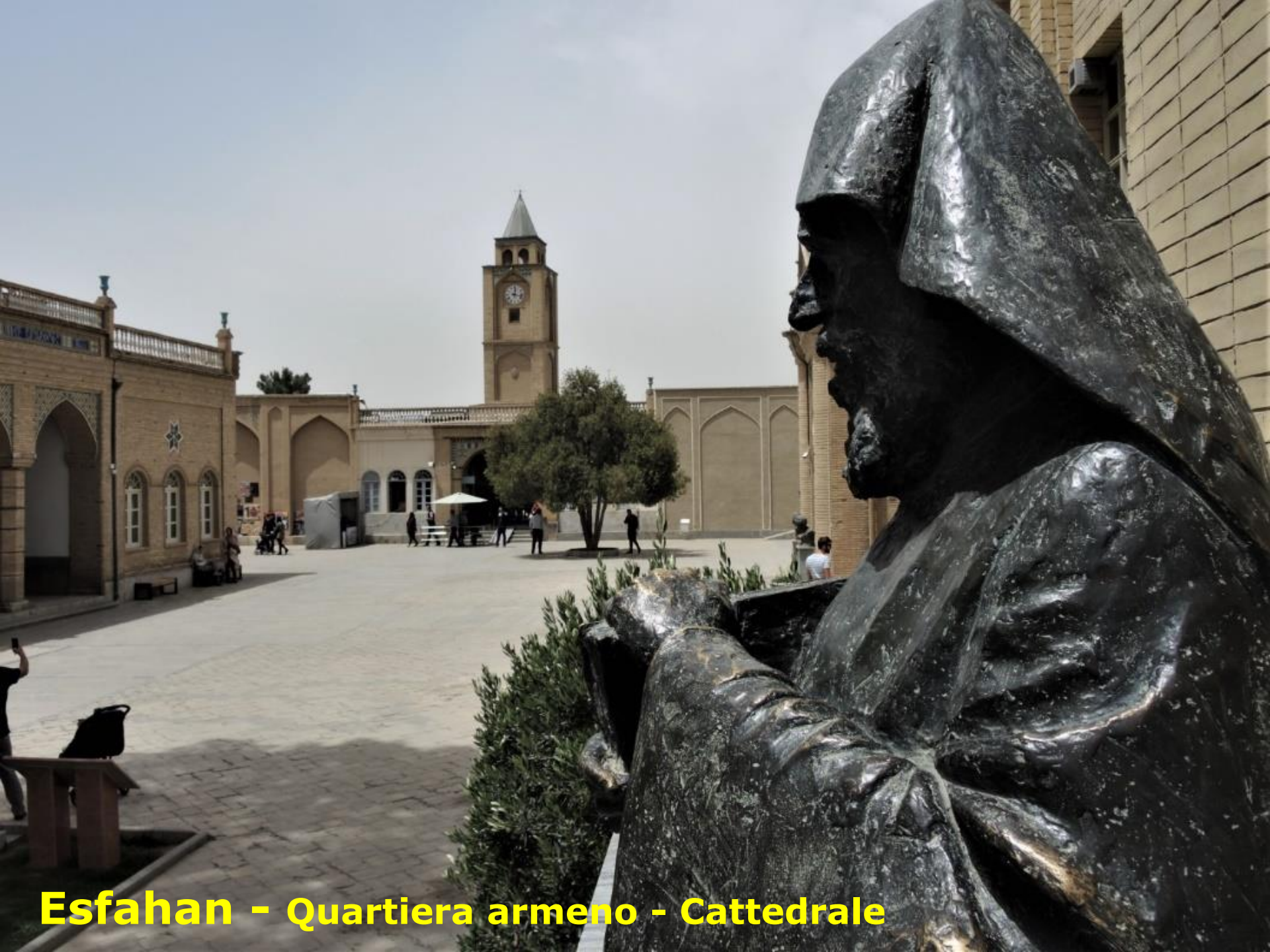
Esfahan - Quartiera armeno - Cattedrale