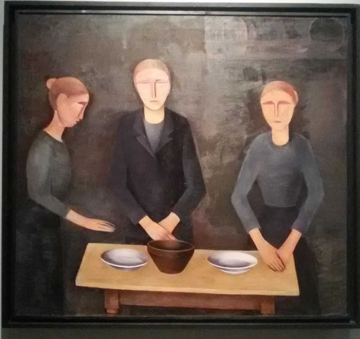
Francis Bacon Three Women at a Table 1950