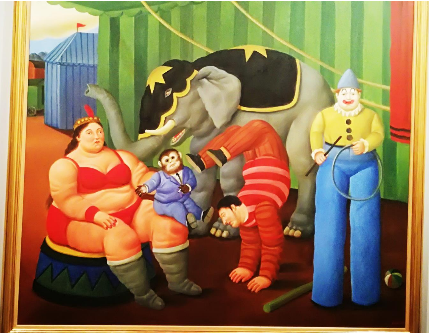
Titian Circus Performer with Elephant 1511 Oil on canvas National Gallery, London