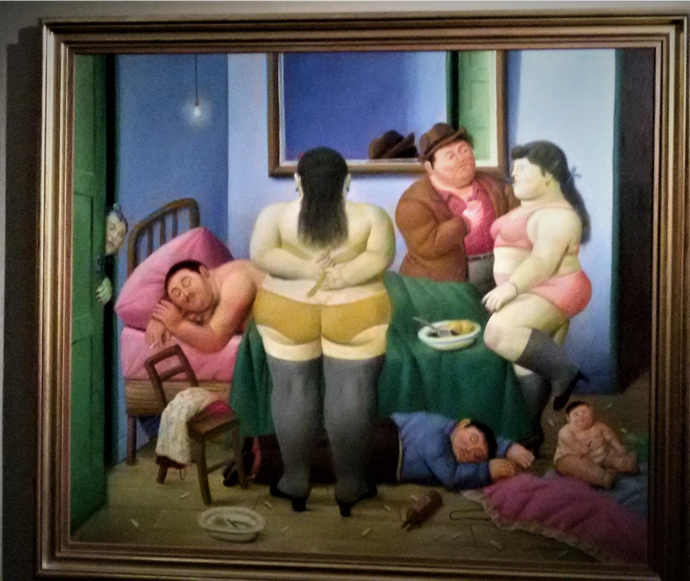
Diego Rivera The Family Reunion 1928 Oil on canvas 100 x 130 cm Museum of Modern Art, New York