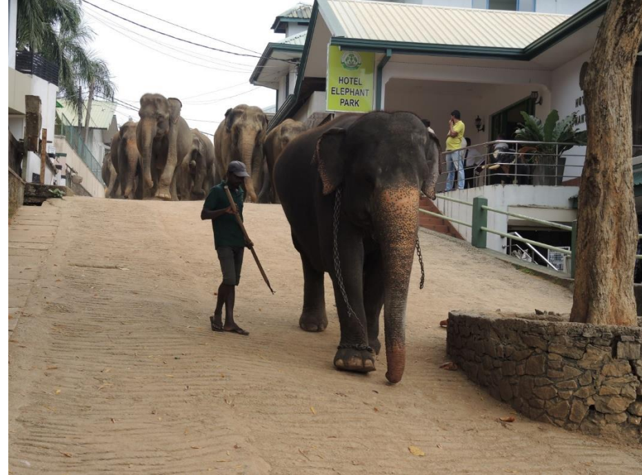
PINNAWALA: baby elefanti o. . . .quasi