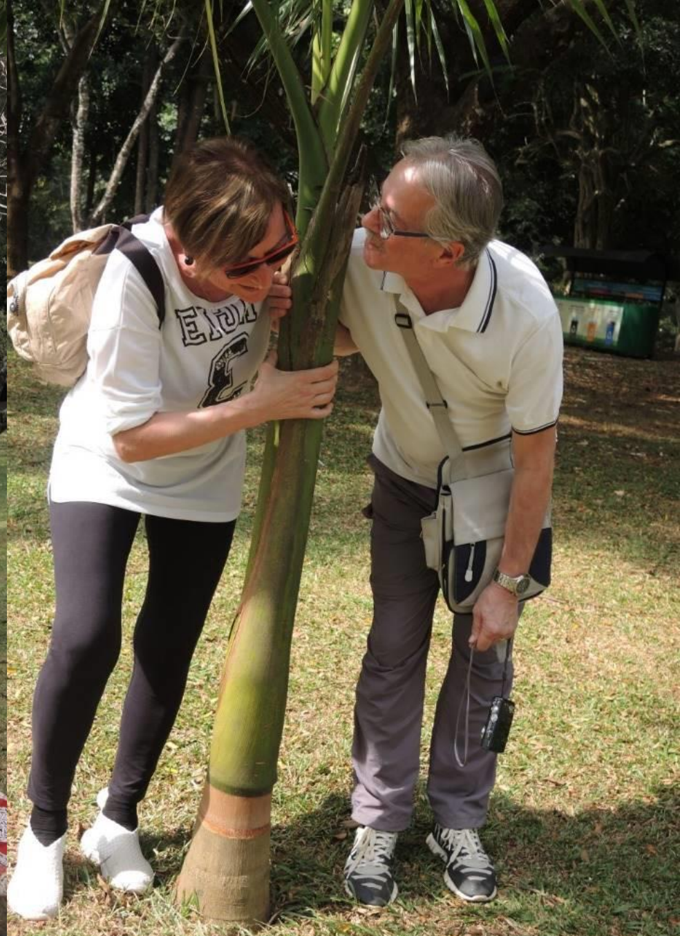
Prima . . . . . dopo . . .