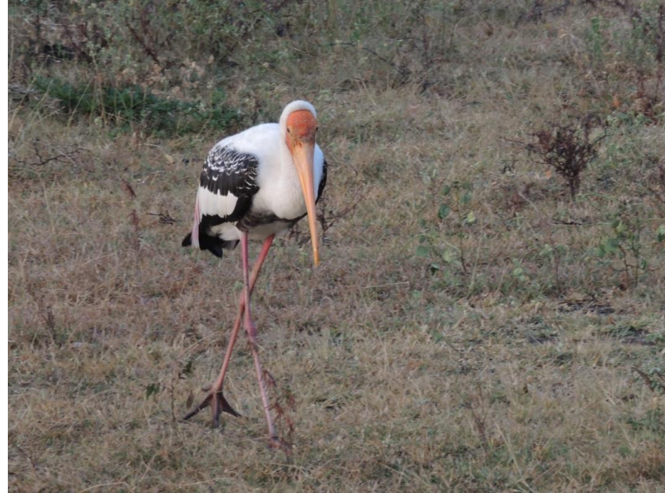
YALA National Park (south Ceylon)