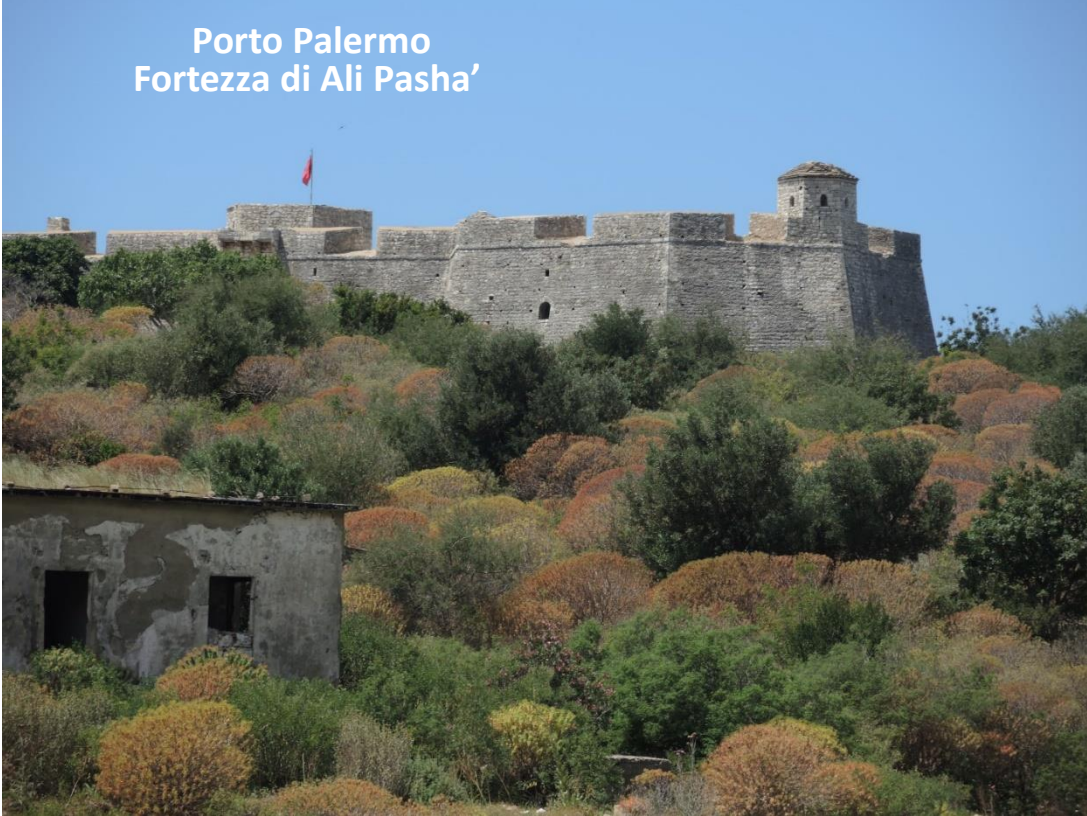
Porto Palermo Fortezza di Ali Pasha'