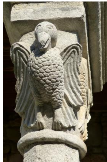
Apollonia Chiesa di Santa Maria XIV° sec.