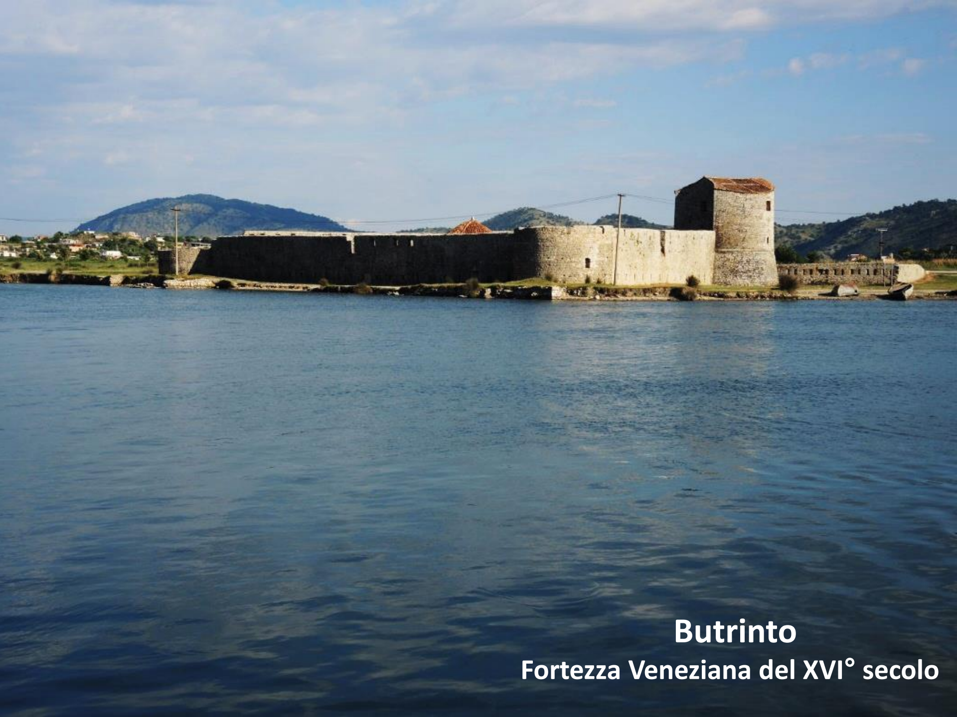
Butrinto Fortezza Veneziana del XVI° secolo