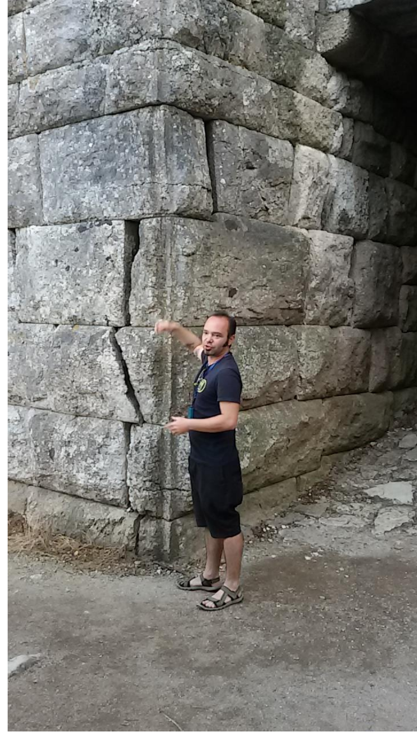
Butrinto Colonia greca – città romana