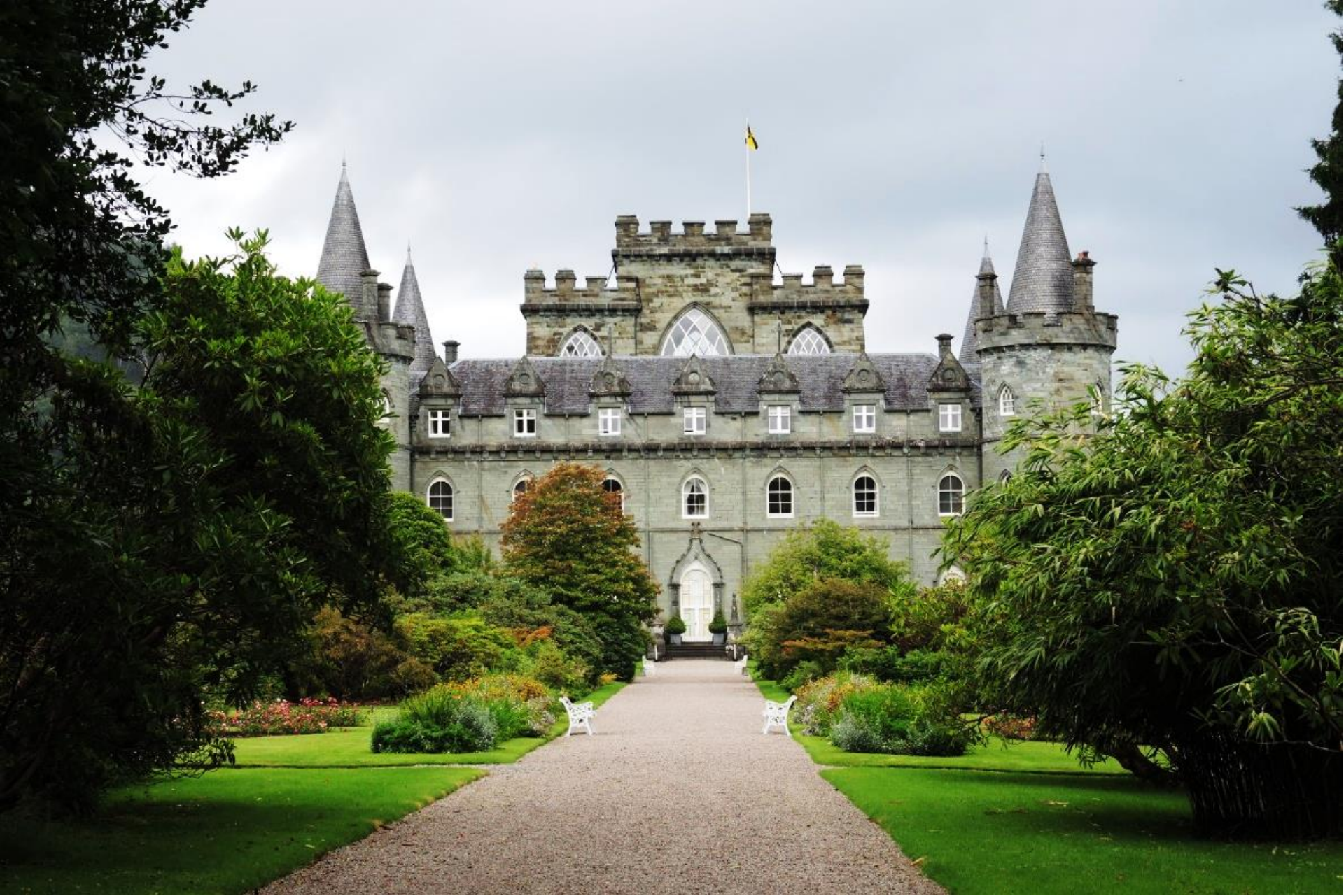
INVERARAY castle dei Duchi di Argyll