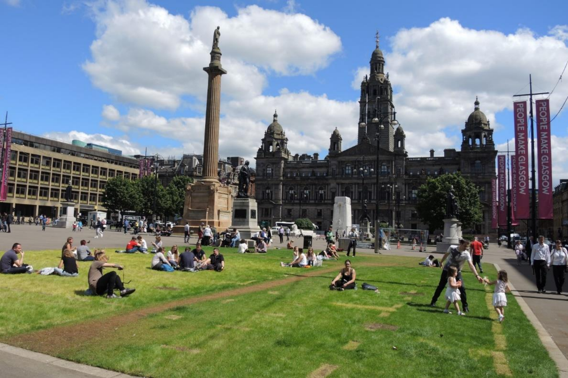
GLASGOW, George square