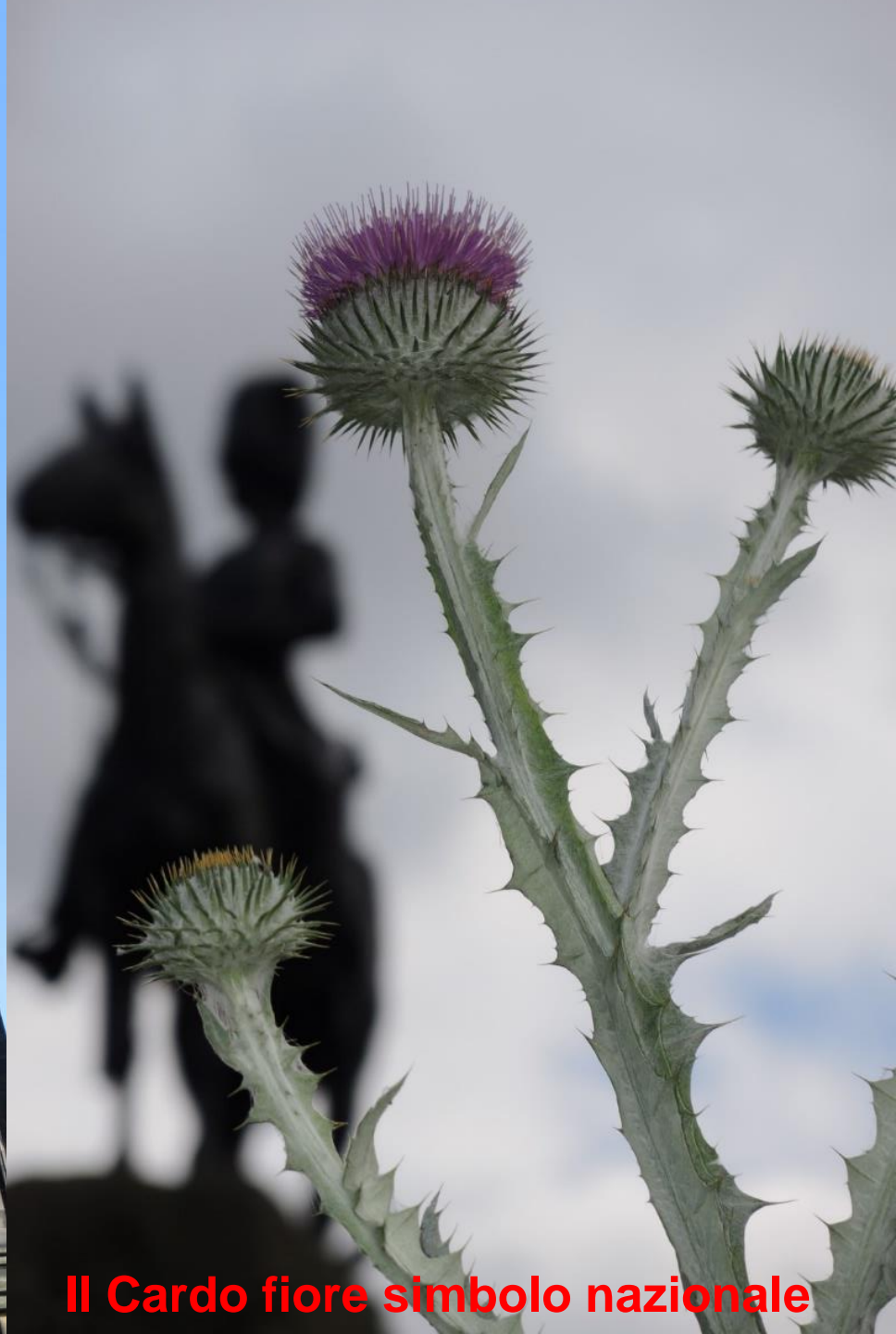
Il Cardo fiore simbolo nazionale