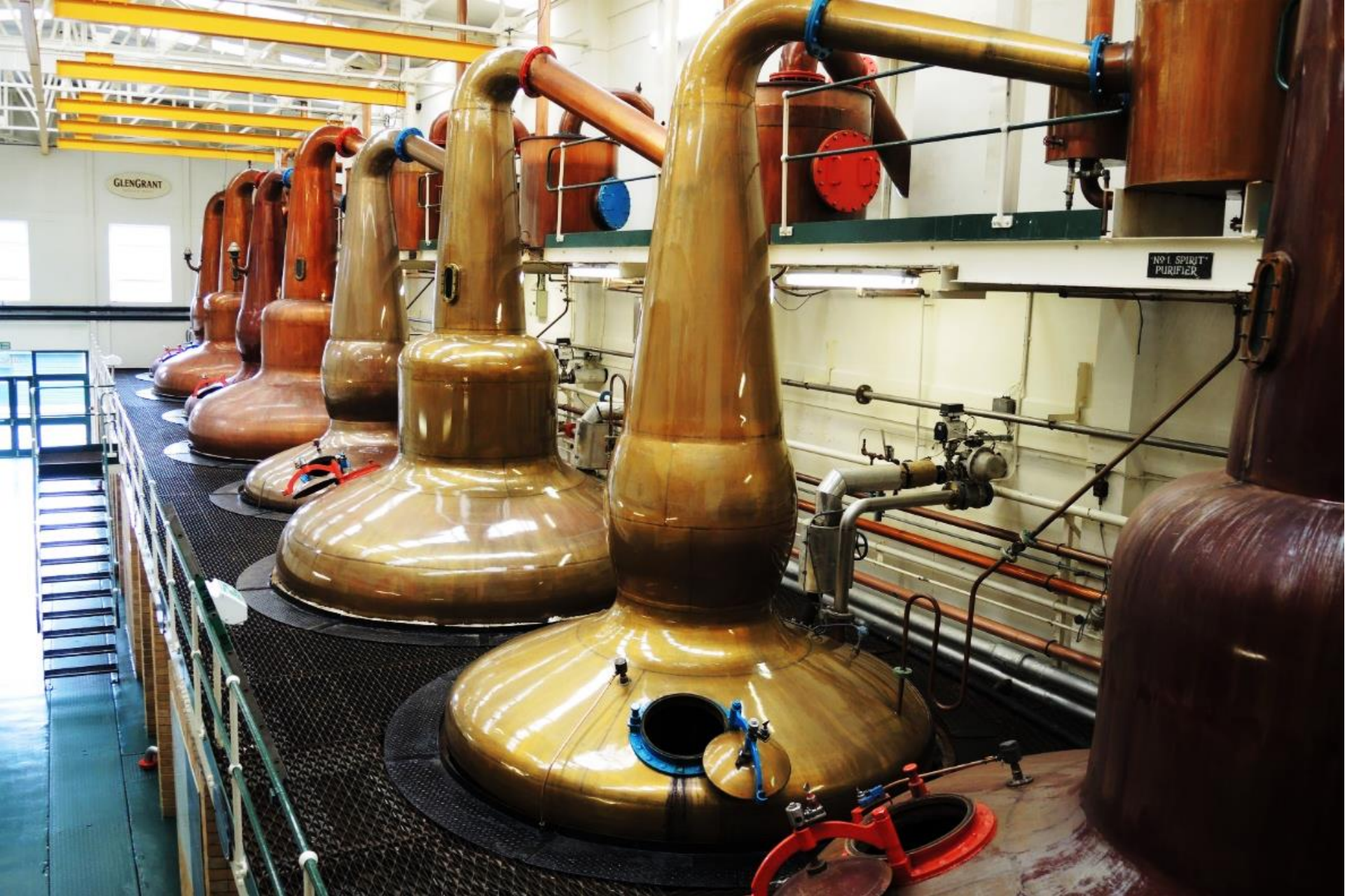
Distilleria GLEN GRANT