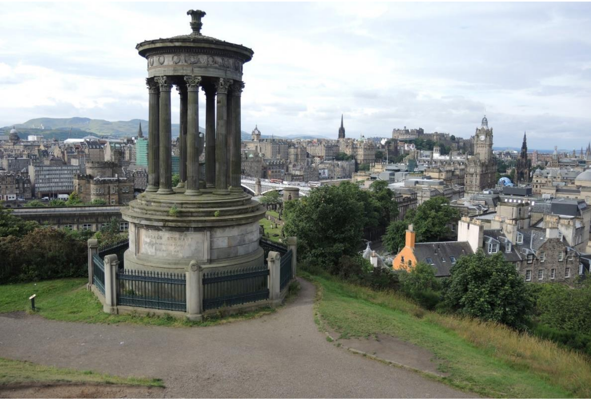
EDINBURGH vista da Calton Hill