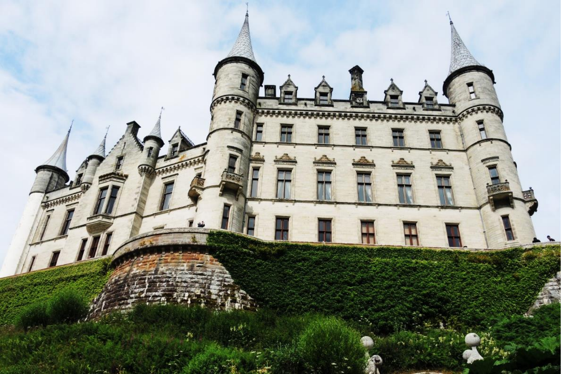
DUNROBIN castle – proprietà dei Duchi di Sutherland