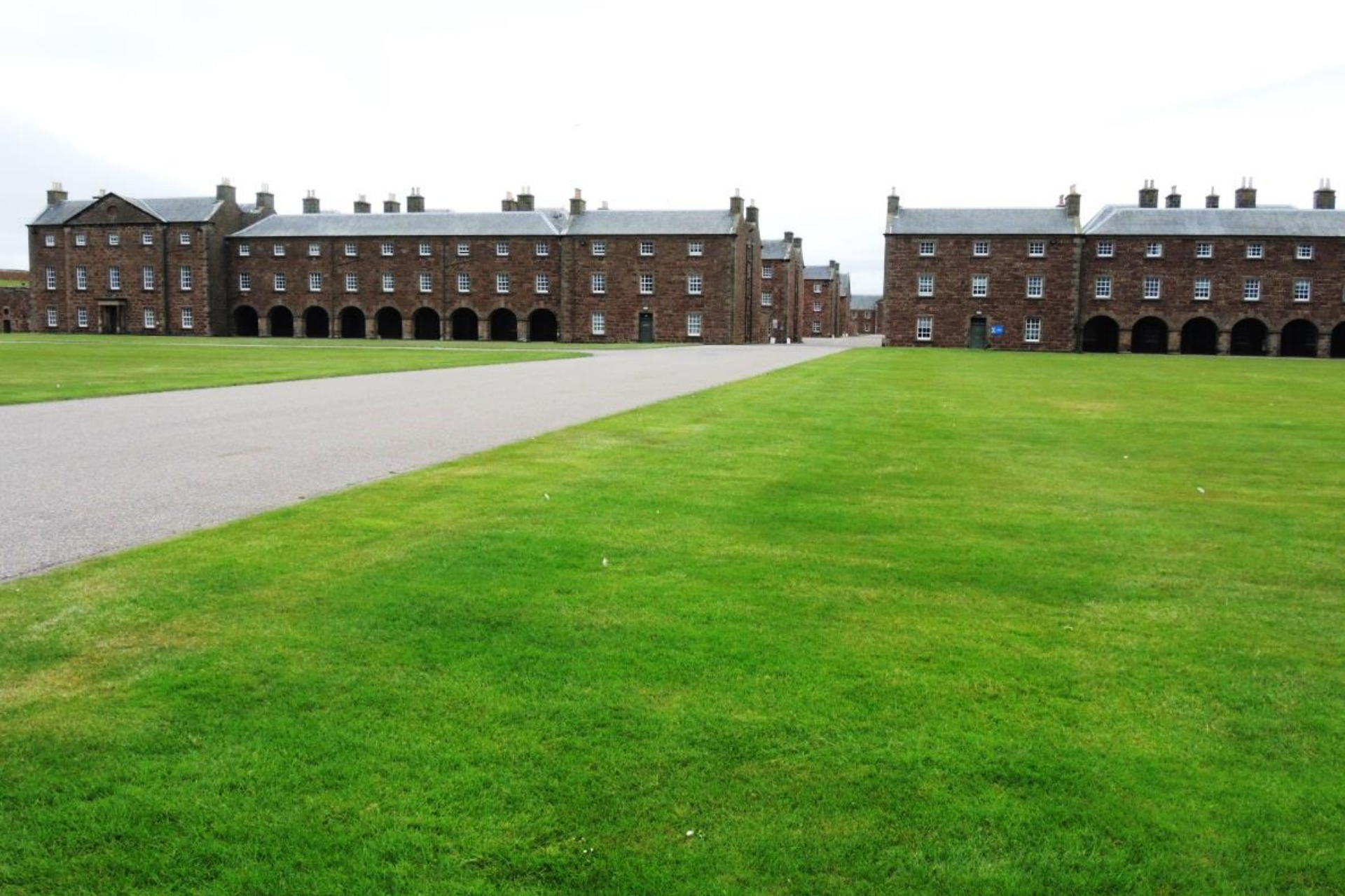
Caserma militare di FORT GEORGE