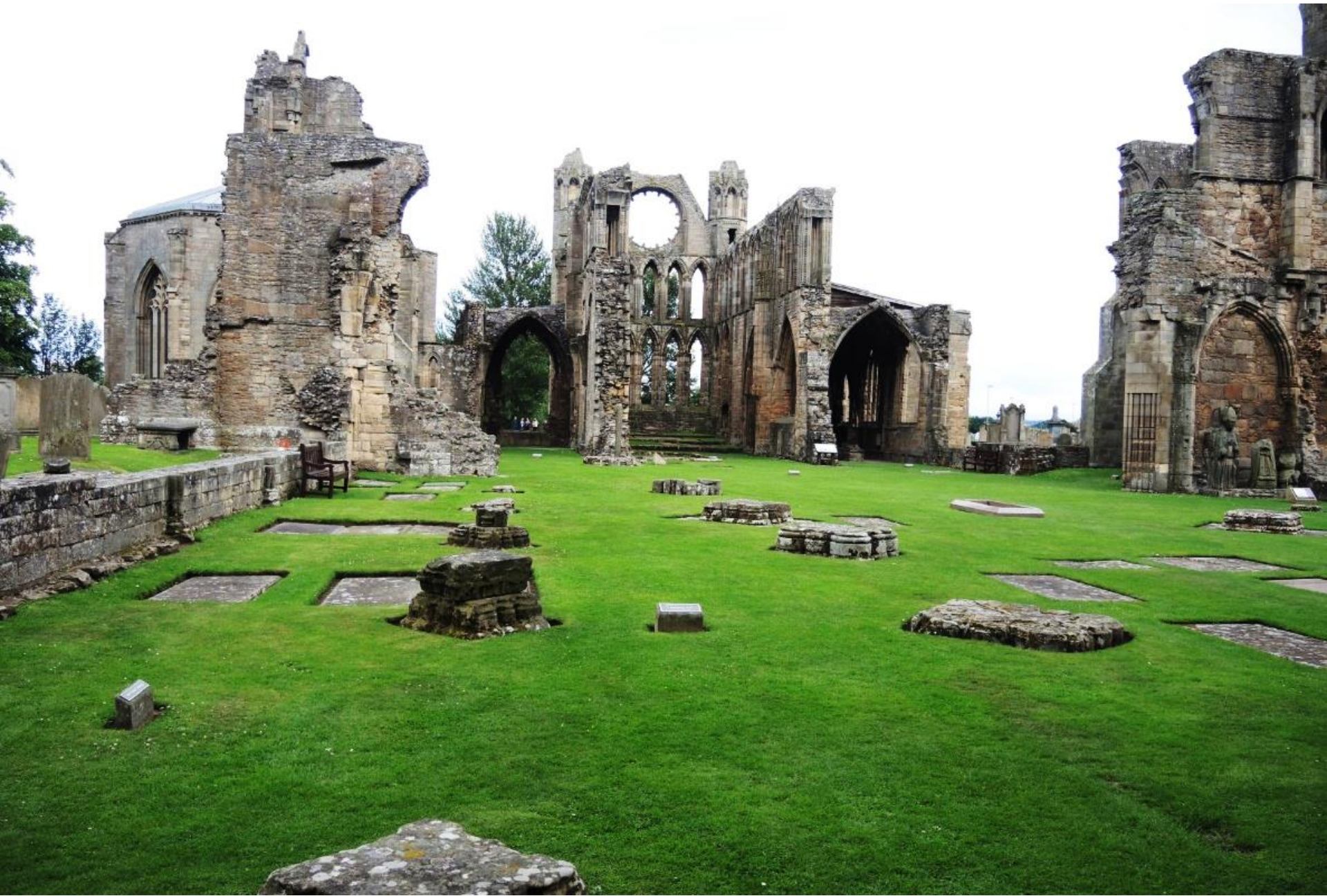
Cattedrale di ELGIN