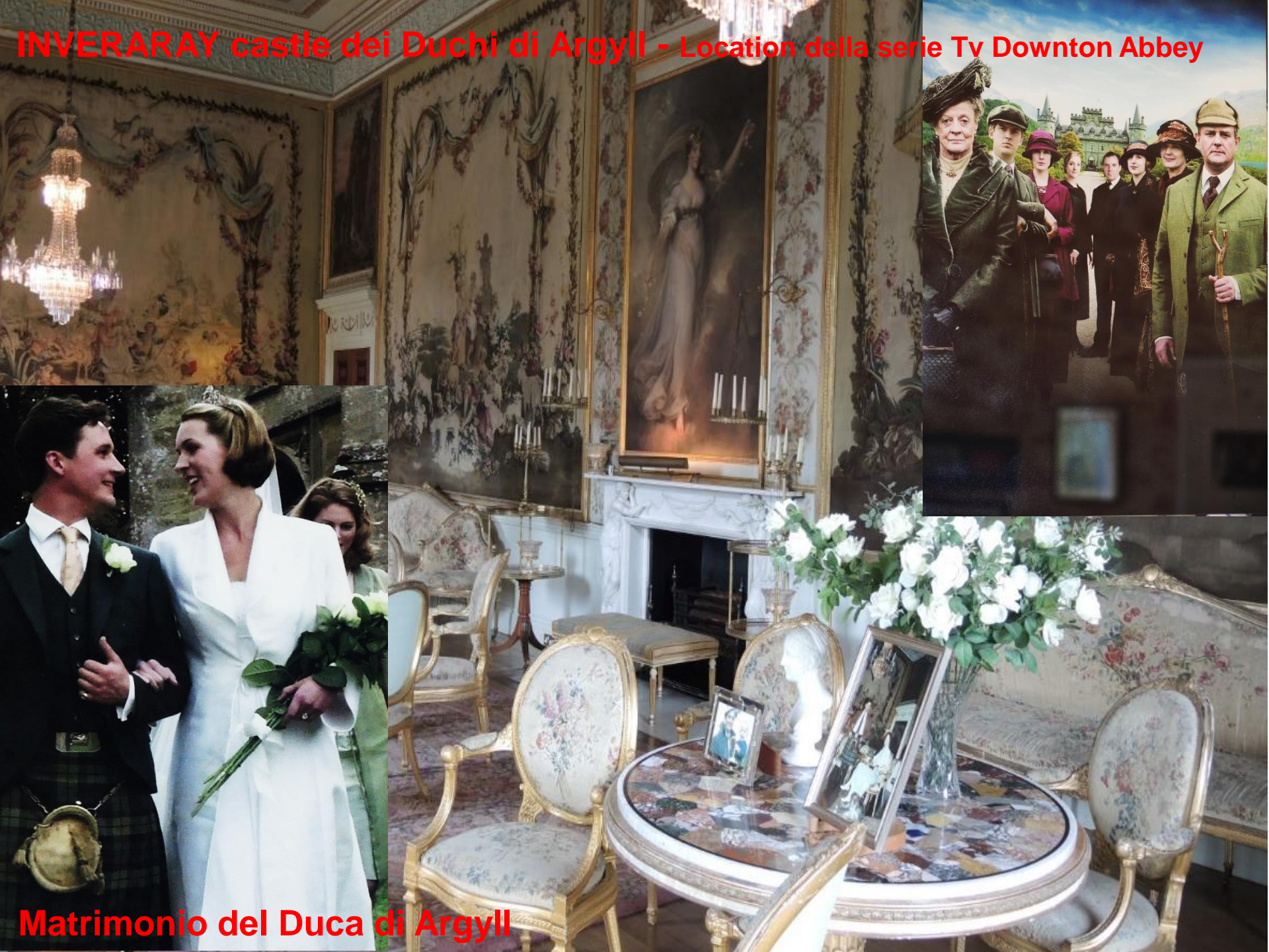
Matrimonio del Duca di Argyll