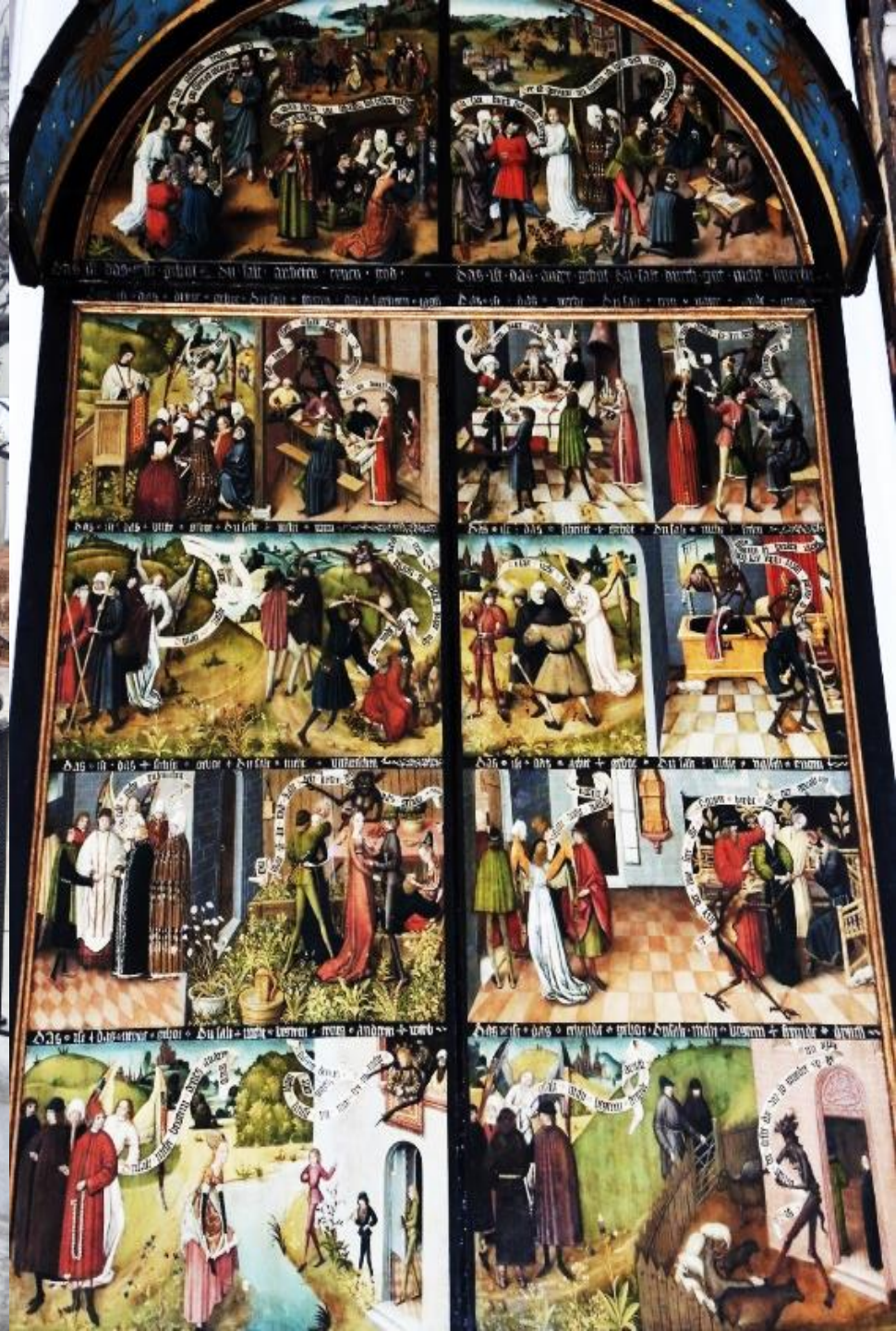
Danzica - Basilica dell'Assunzione