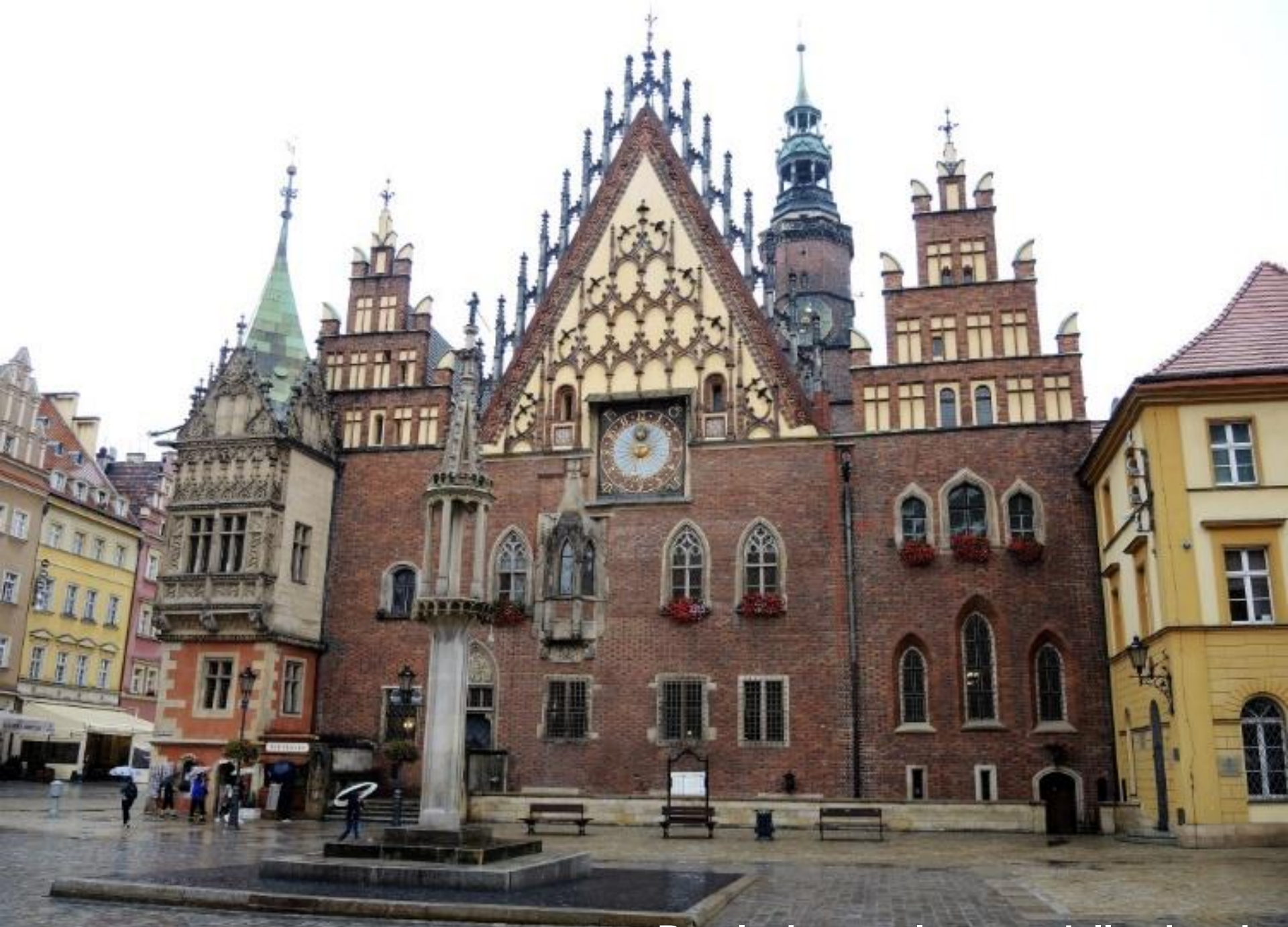
Breslavia . . . al tempo della pioggia