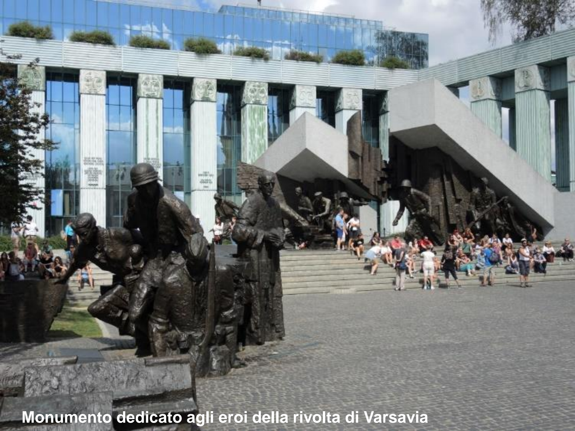
Monumento dedicato agli eroi della rivolta di Varsavia