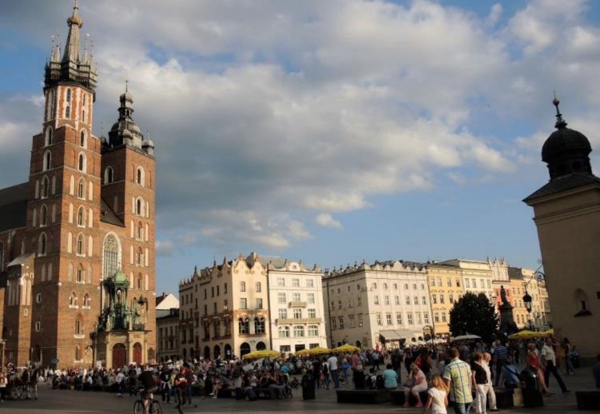
Cracovia, piazza del mercato (Rynek Glowny)