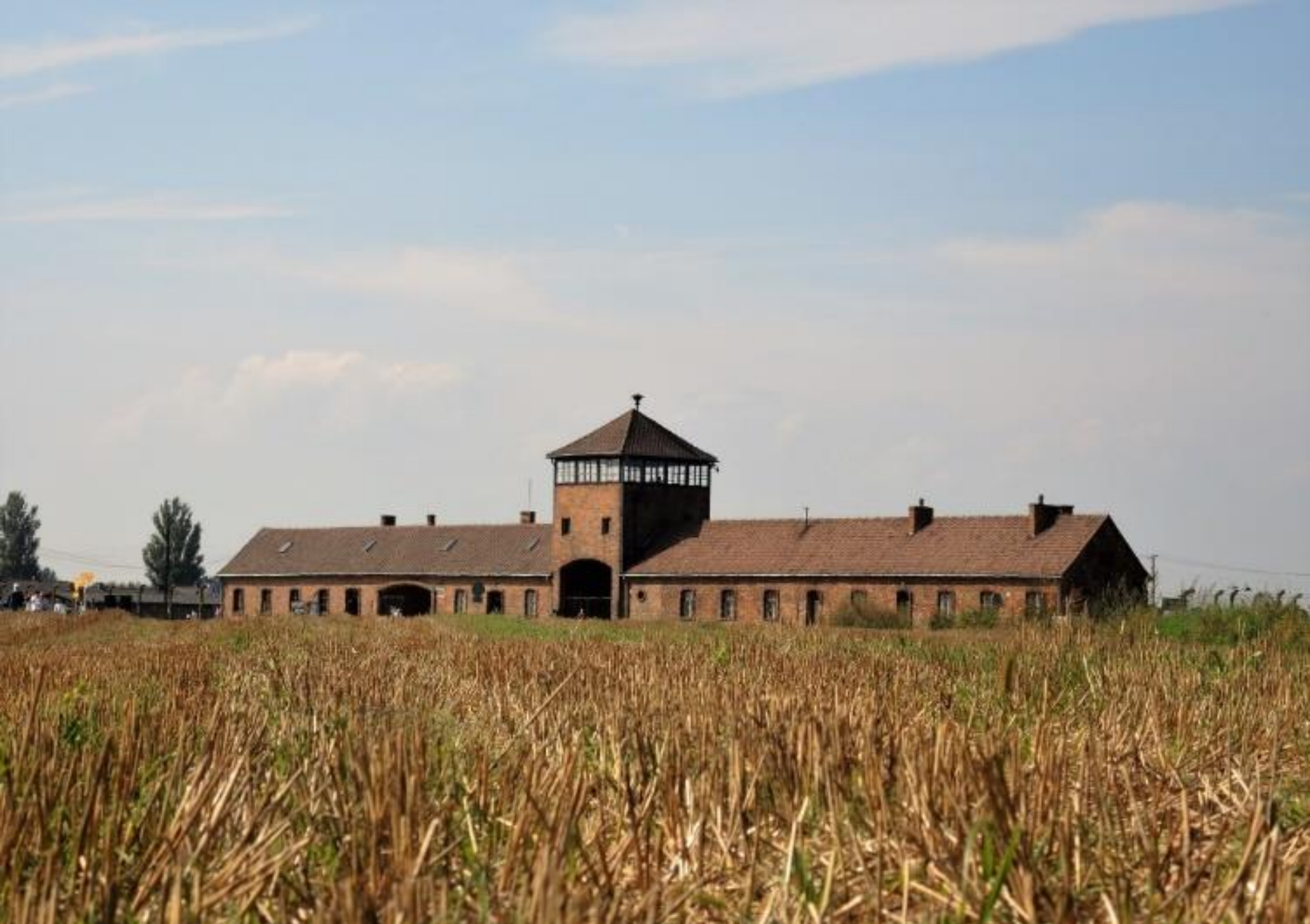
Auschwitz/Birkenau – Difficile ed angosciante questa visita - 1.500.000 i deportati periti nel lager !