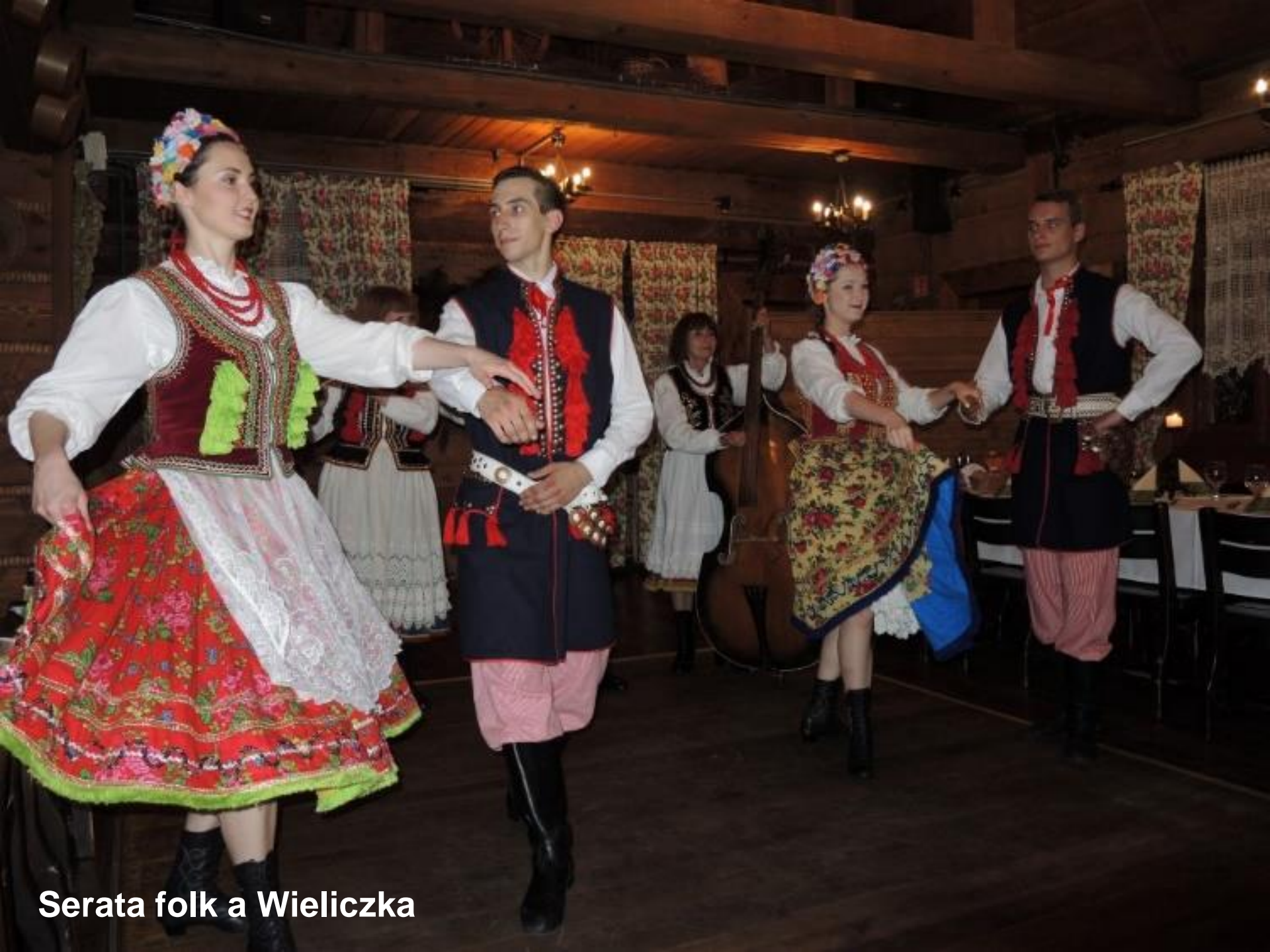
Serata folk a Wieliczka