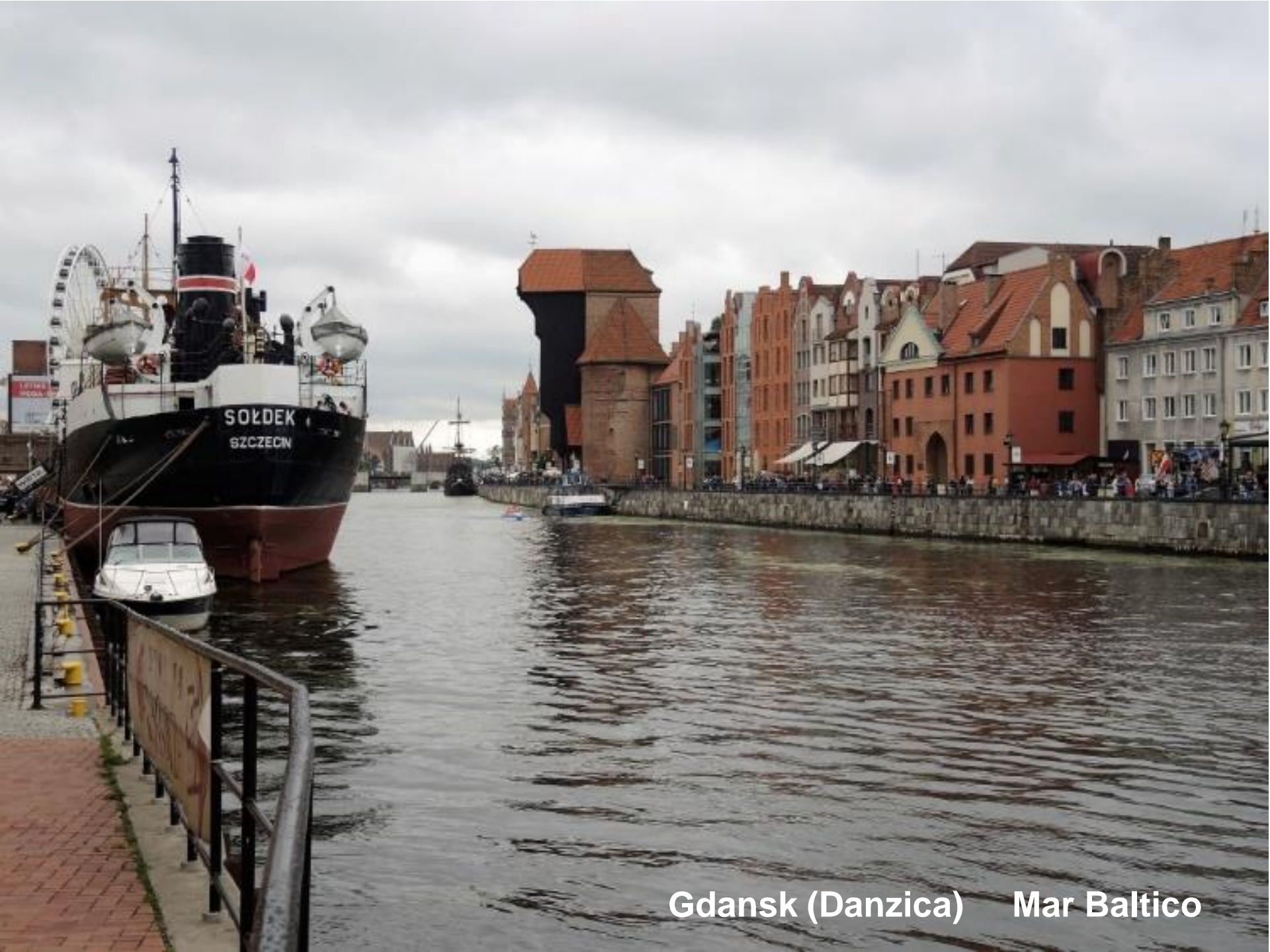
Gdansk (Danzica) Mar Baltico