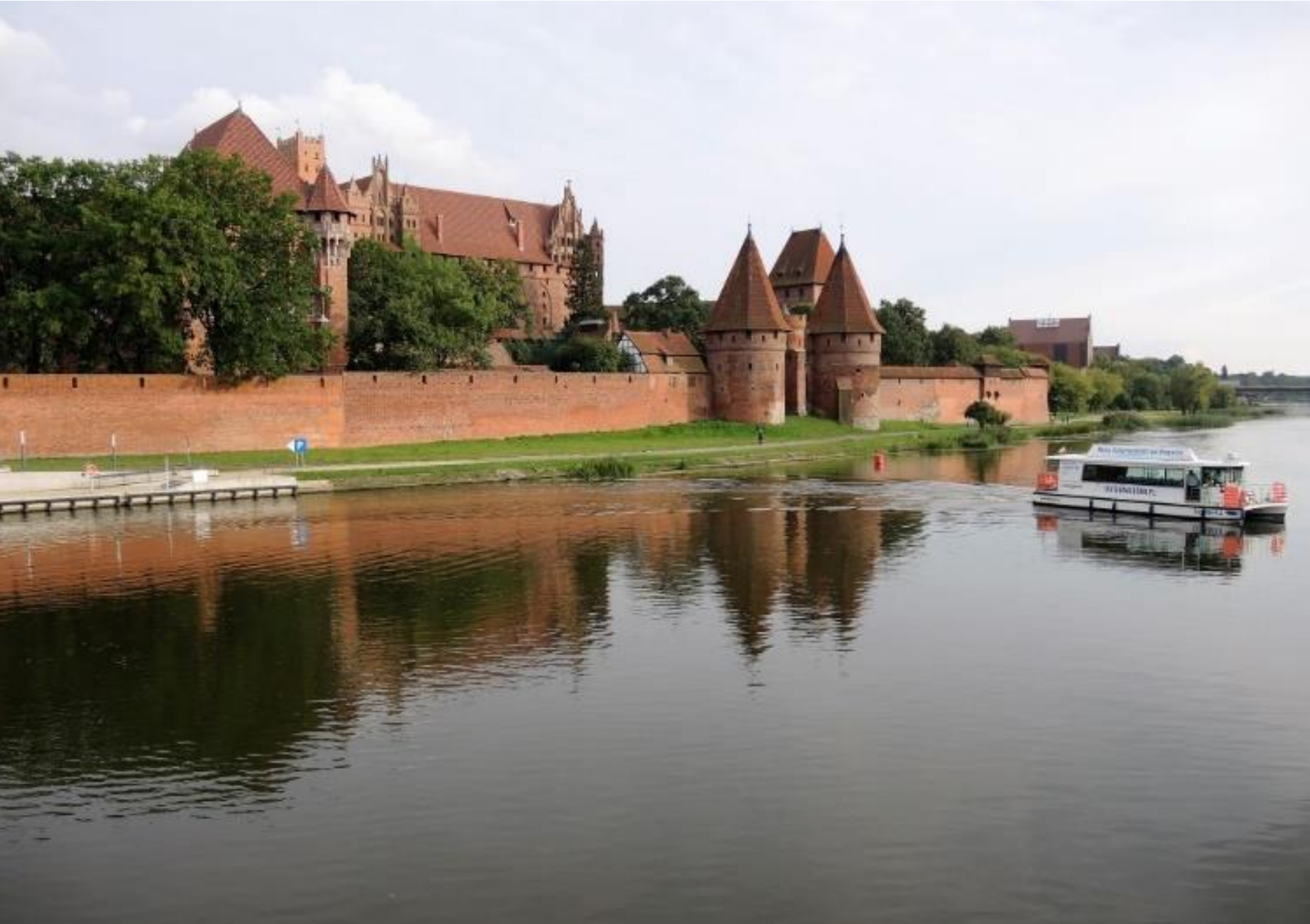
Malbork e la Fortezza dei Cavalieri Teutonici