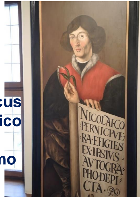
Torun e la Vistola

Nicolaus Copernicus Matematico ed astronomo