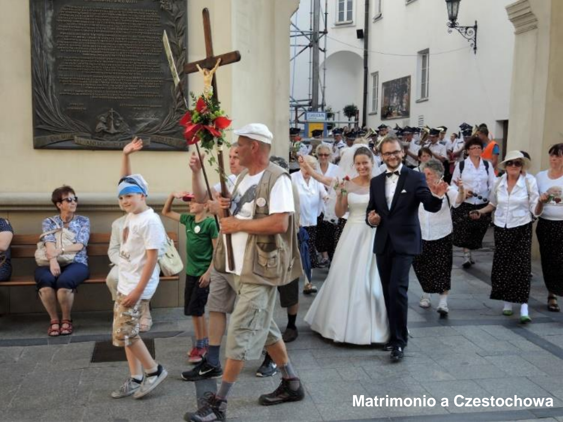
Matrimonio a Czestochowa