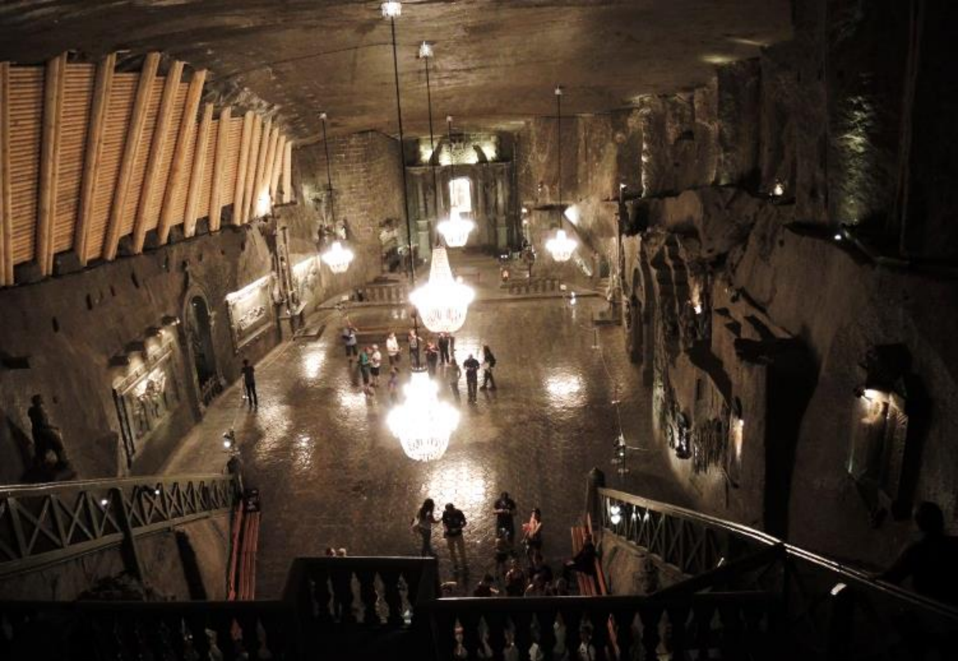
La grande sala sotterranea nella miniera di sale di Wieliczka