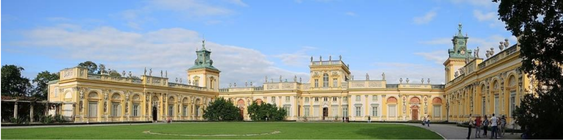
Varsavia - Palazzo di Wilanow, costruito da Giovanni III° Sobieski