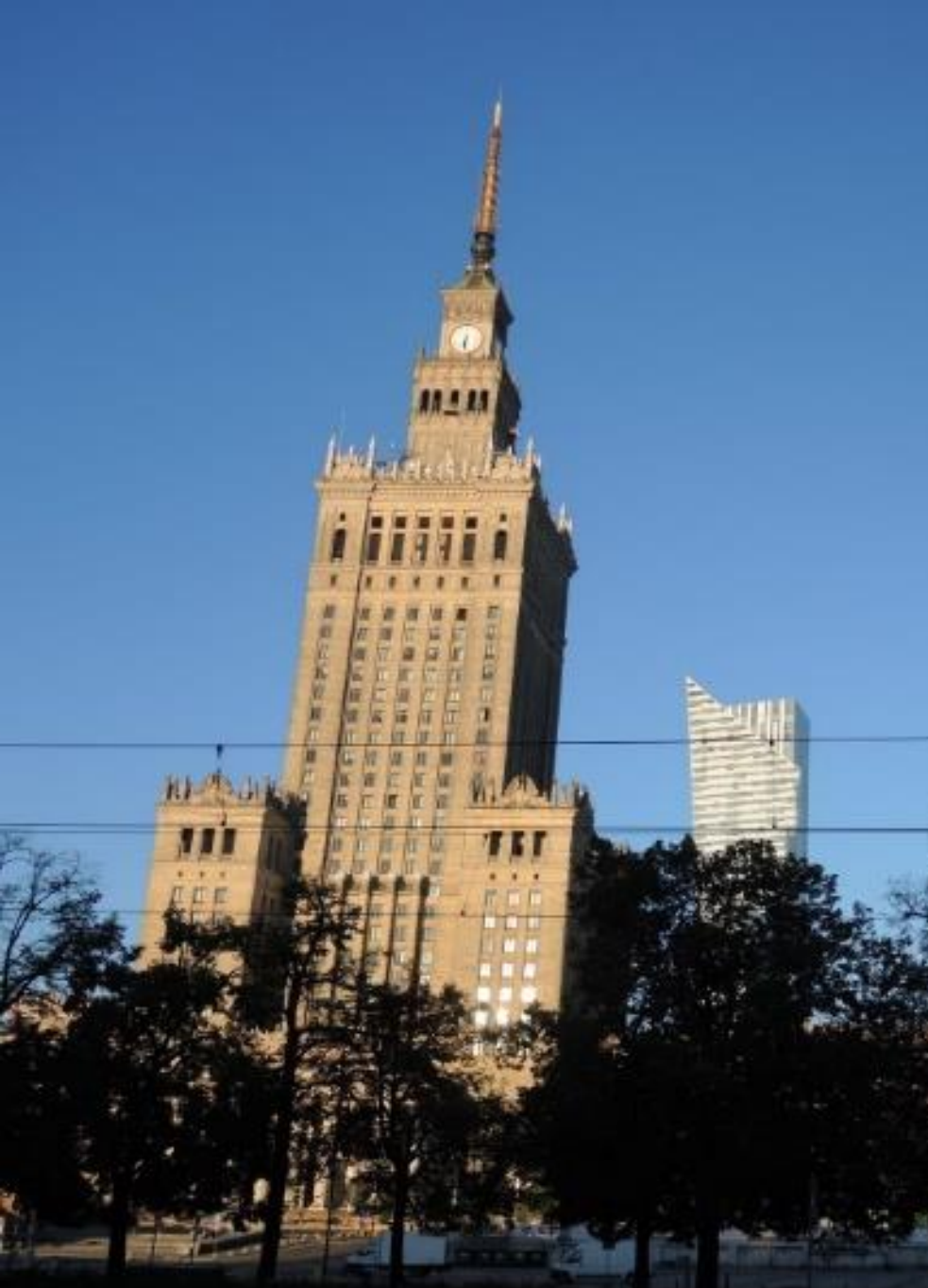
Palazzo della Cultura – “dono” di Stalin