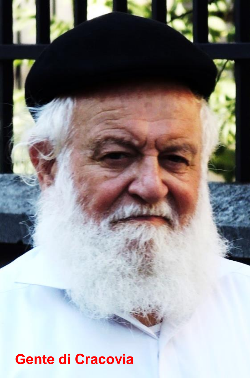
Gente di Cracovia