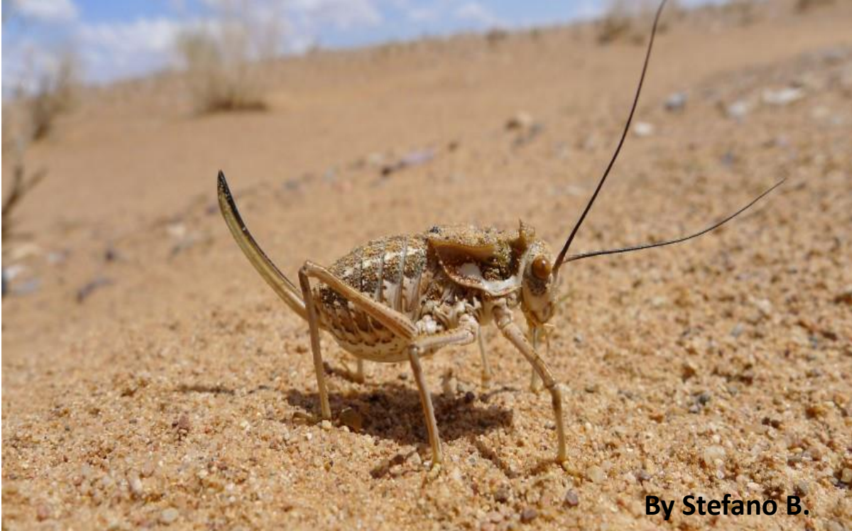
By Stefano B.