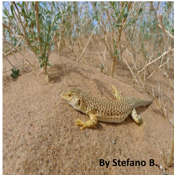
By Stefano B.