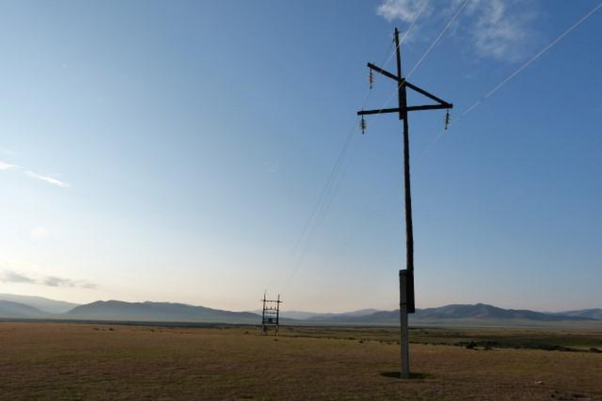
Sud Mongolia 20 Kv "Nulla"