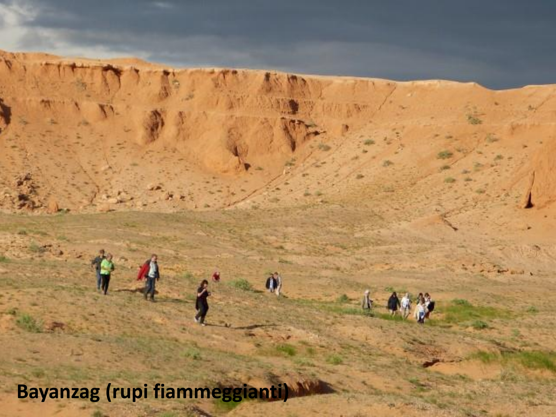
Bayanzag (rupi fiammeggianti)