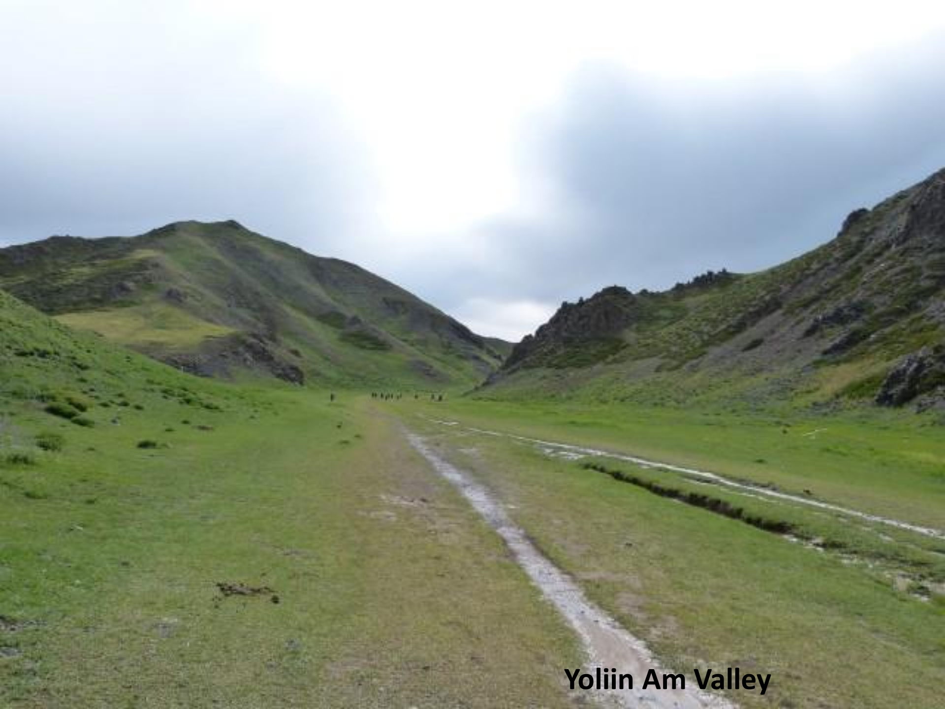
Yoliin Am Valley