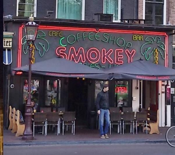
Amsterdam by night: Red Light District e Coffee Shop