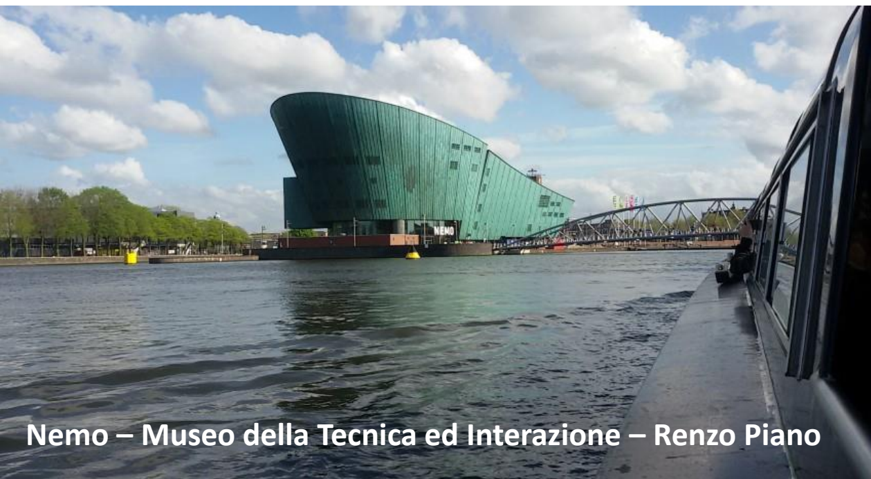
Nemo – Museo della Tecnica ed Interazione – Renzo Piano