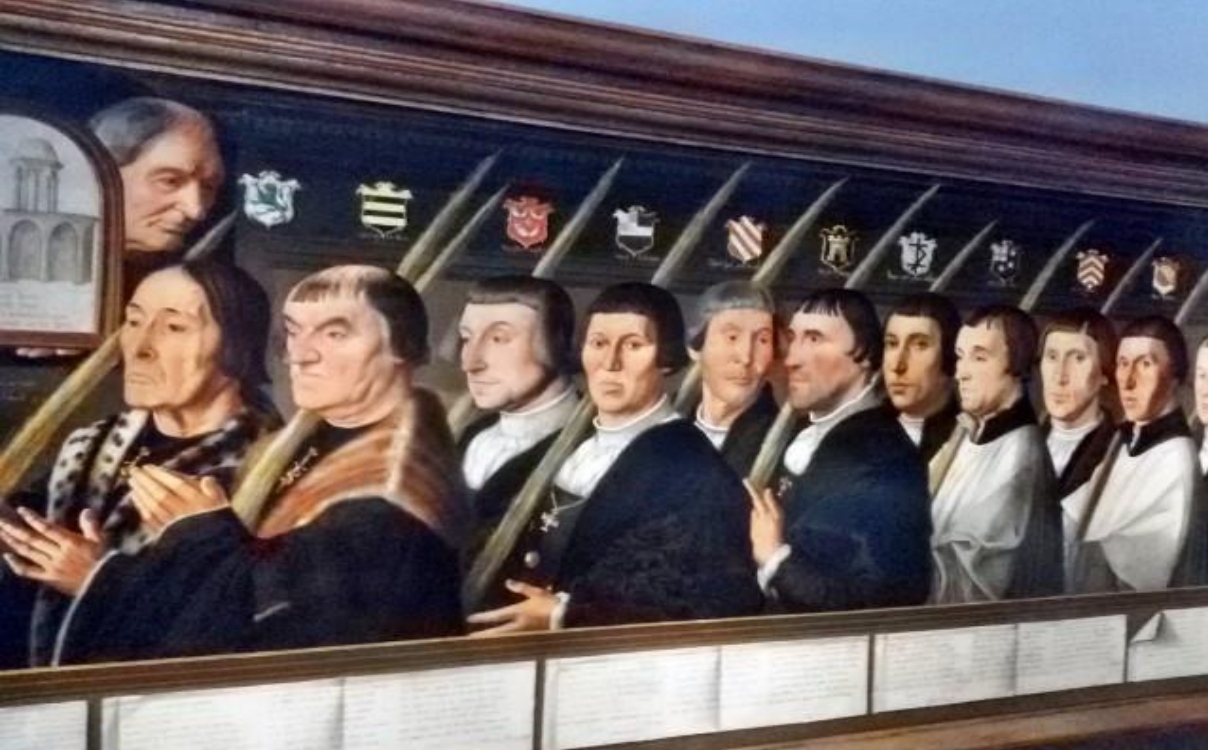
Harlem (Paesi Bassi*) Museo dedicato a Frans Hals