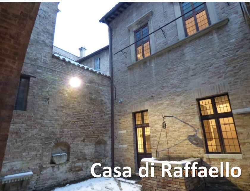
Casa di Raffaello