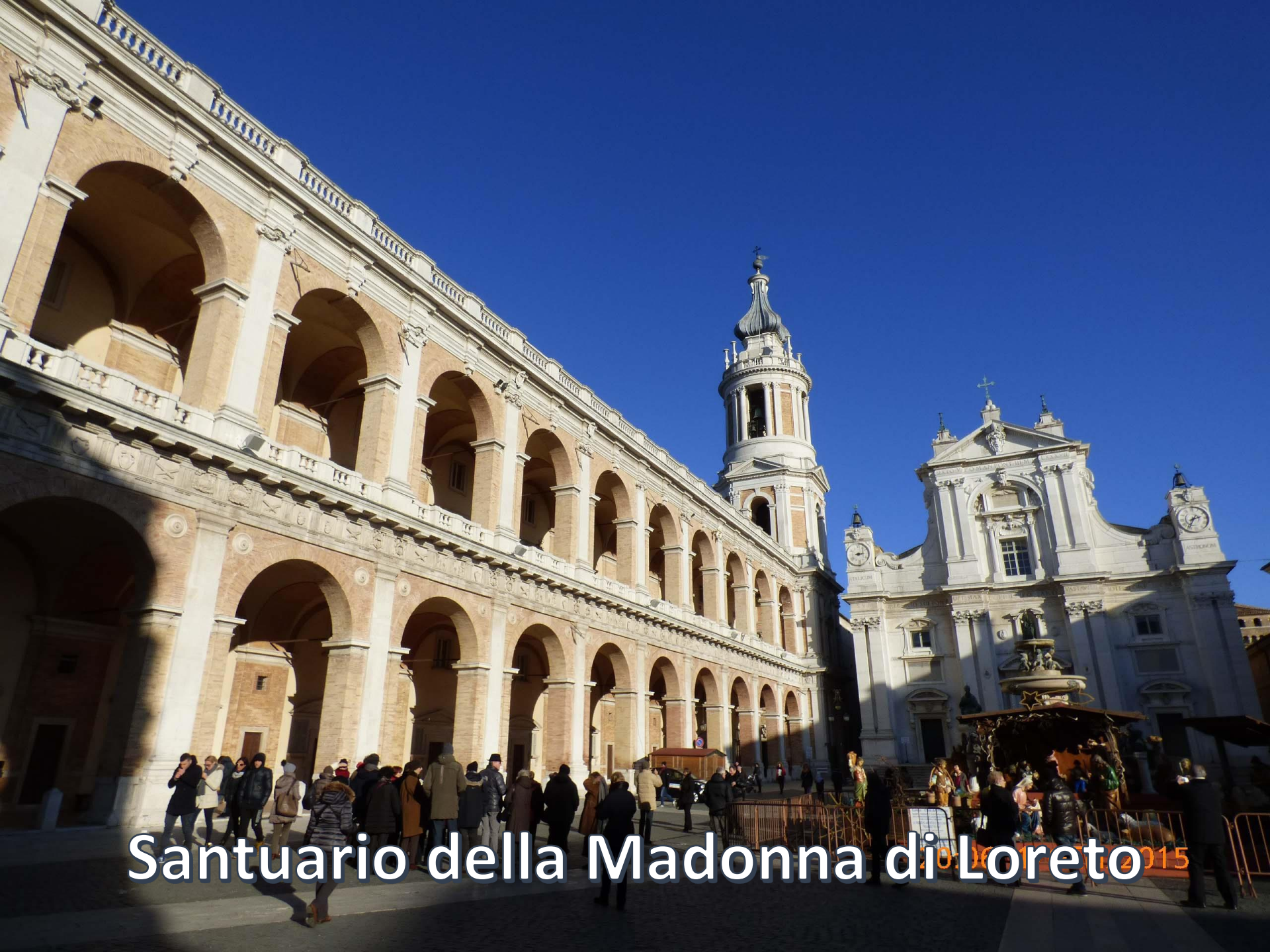
Santuario della Madonna di Loreto