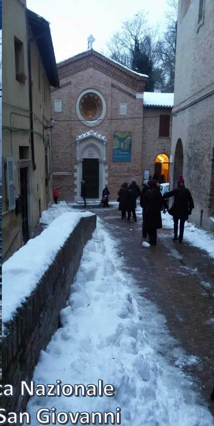
URBINO: visita della Pinacoteca Nazionale Casa di Raffaello – Oratorio di San Giovanni