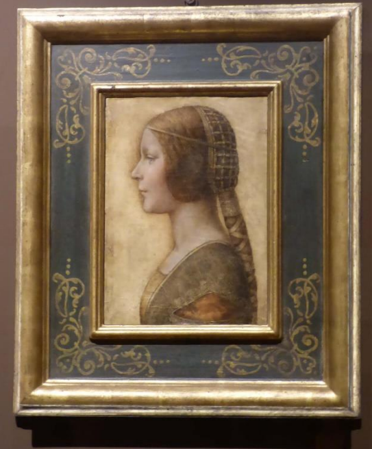
La Bella Principessa Leonardo da Vinci