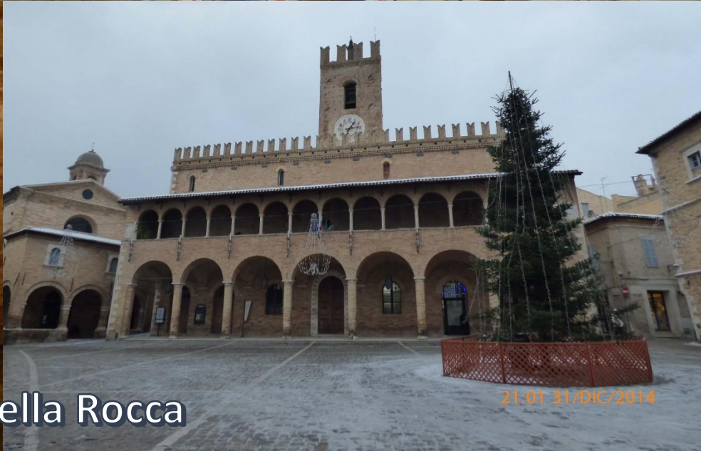
OFFIDA - Santa Maria della Rocca