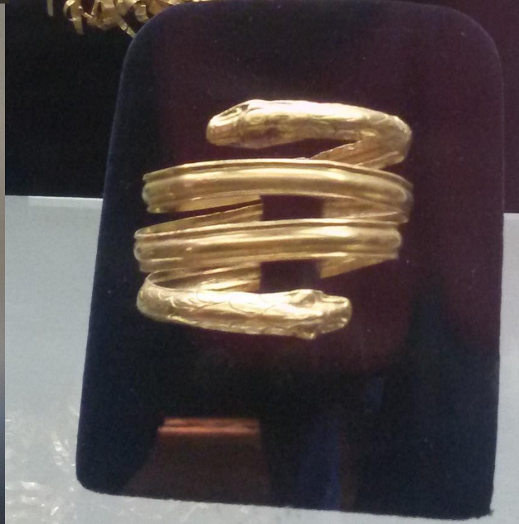
ANCONA Museo Archeologico Nazionale