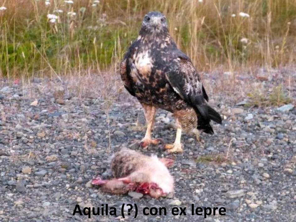
Aquila (?) con ex lepre