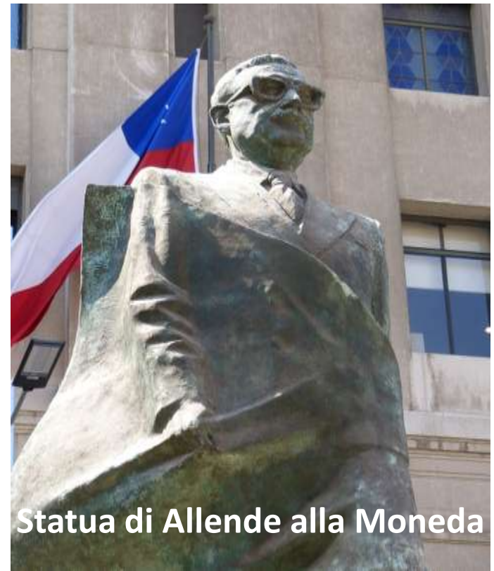
Statua di Allende alla Moneda