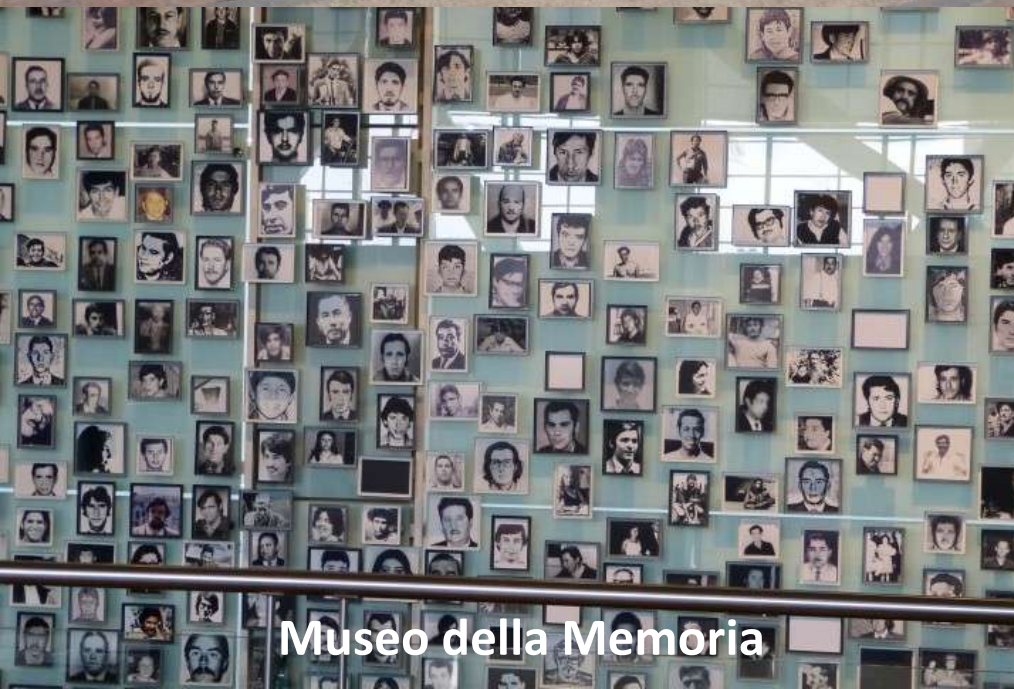
Museo della Memoria

SANTIAGO de CHILE 11 settembre 1973 Un colpo di stato pone fine al governo Allende ed inizia la dittatura del generale Pinochet