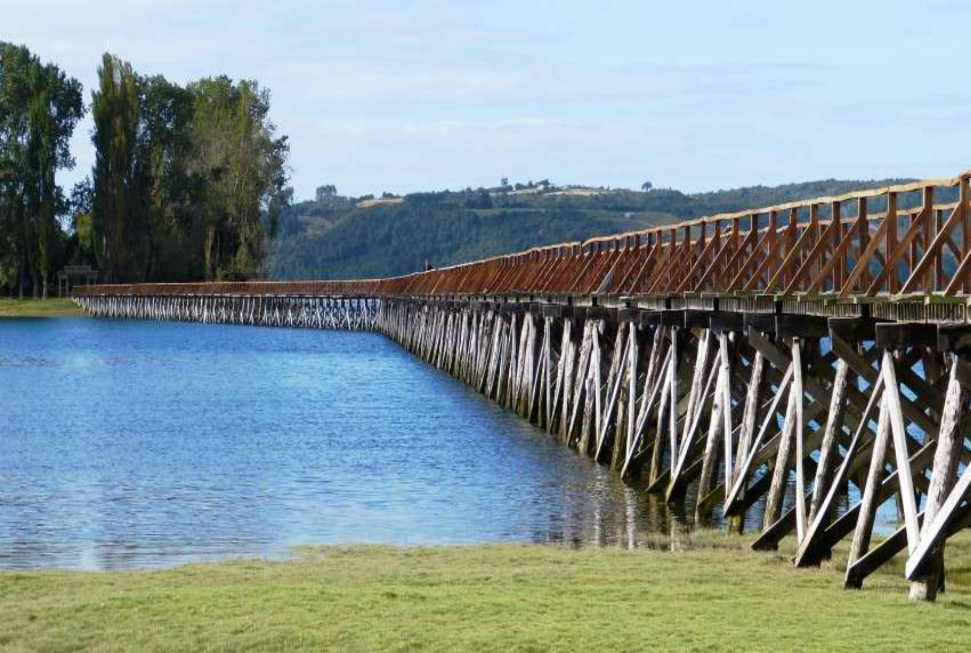
Isola di Chiloè - Castro