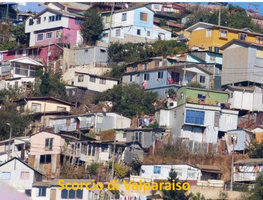
Scorcio di Valparaiso