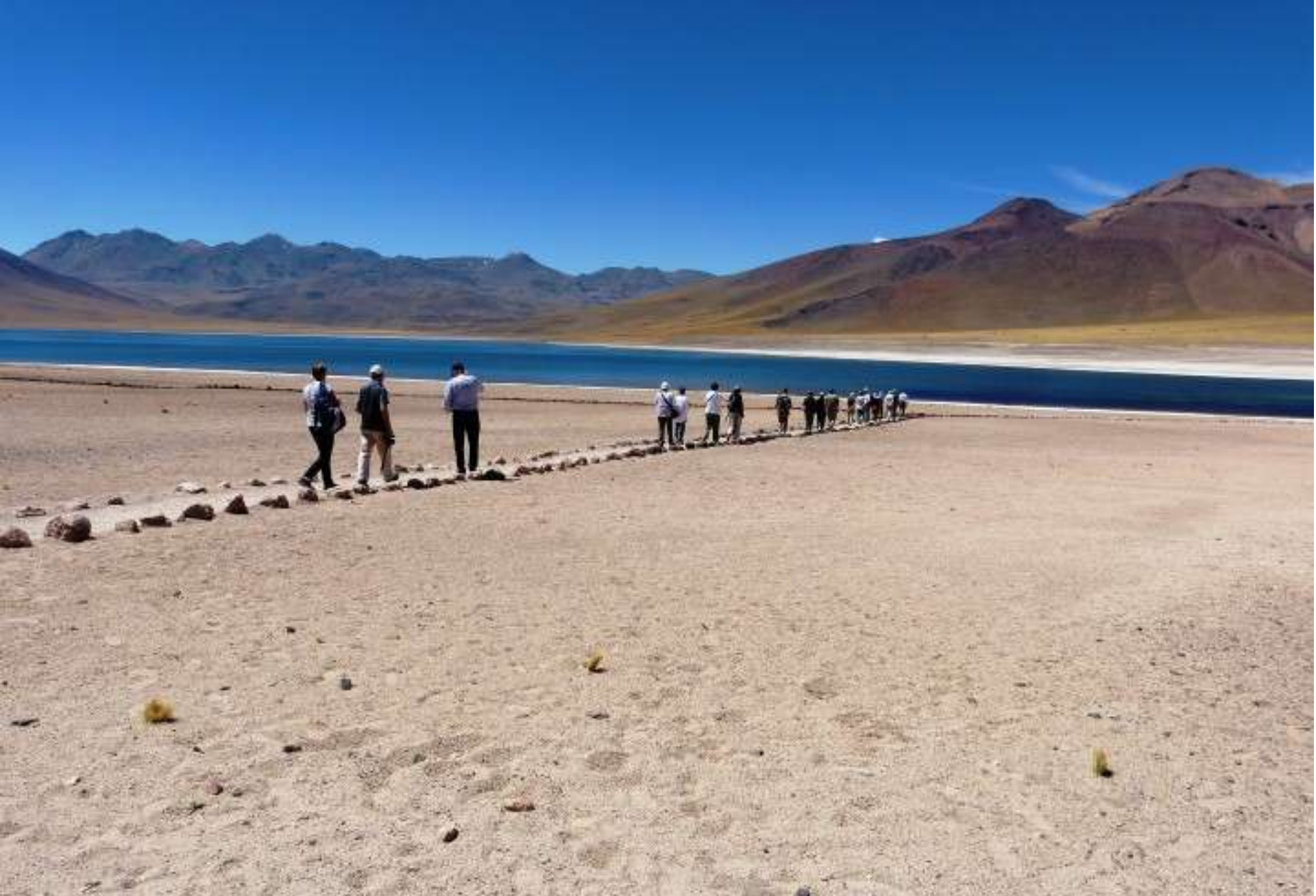
Atacama – Laguna altiplanica – m.4.200 slm