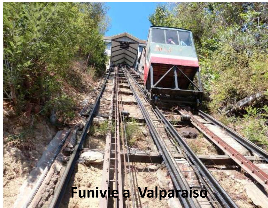
Funivia a Valparaiso