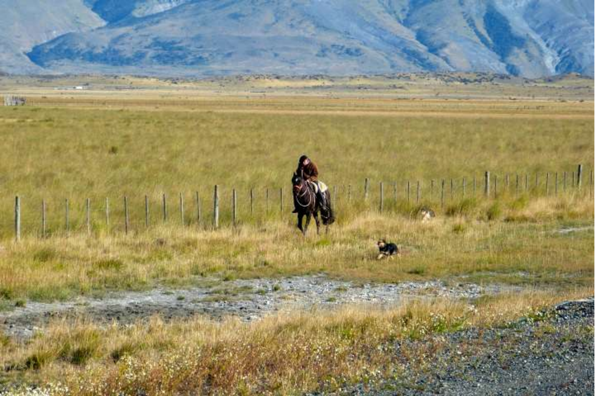
PATAGONIA CILENA – Puerto Natales - Gaucho con il fido cane pastore