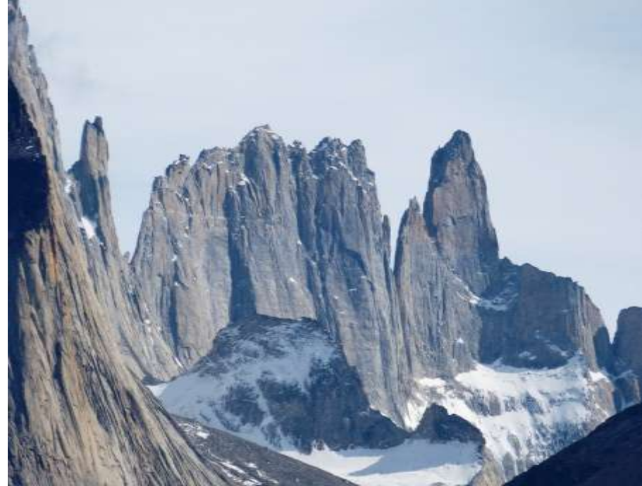
Torres del Paine