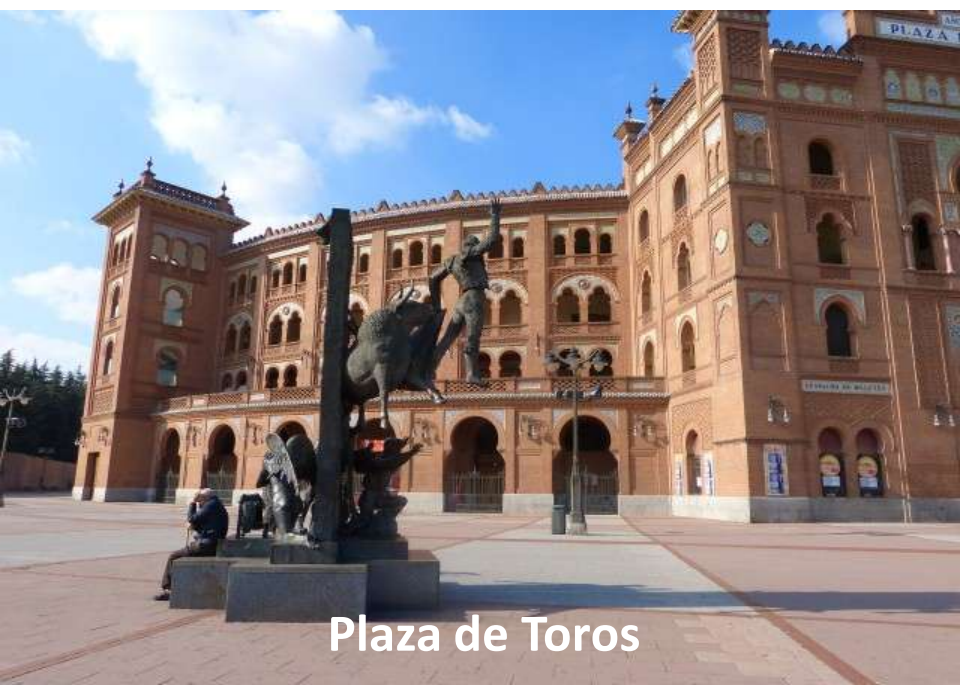
Plaza de Toros

Chile ? No, España! Il viaggio inizia con una visita di Madrid organizzata “last minute” approfittando della sosta in aeroporto . . . dai colonizzatori alle colonie!