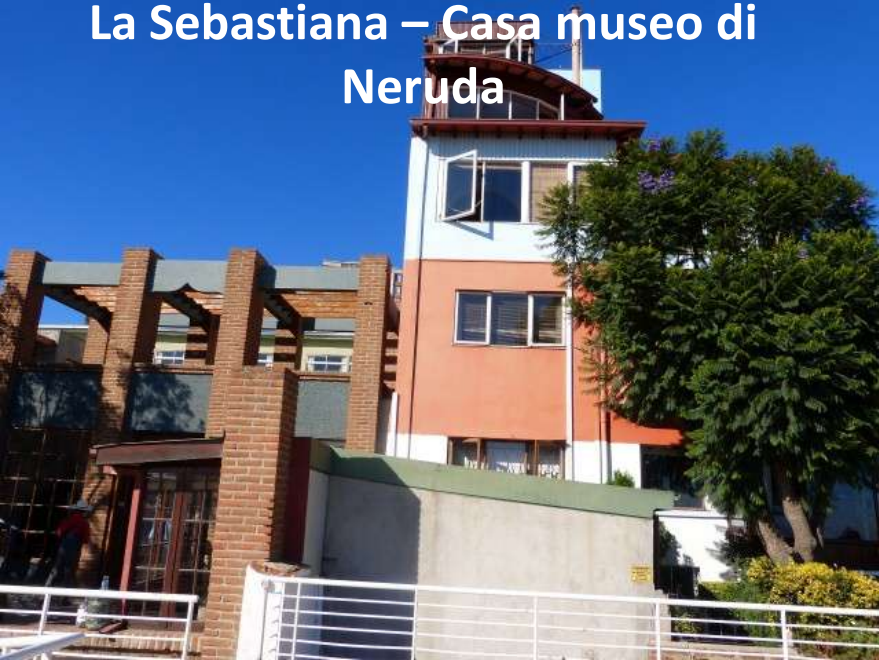
La Sebastiana – Casa museo di Neruda