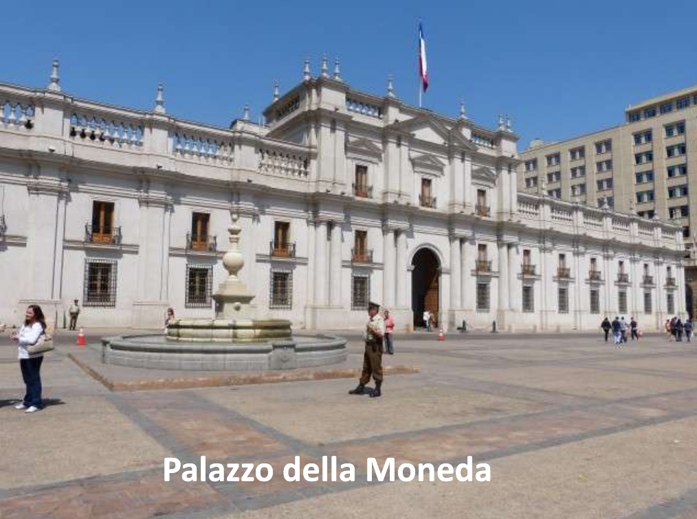
Palazzo della Moneda