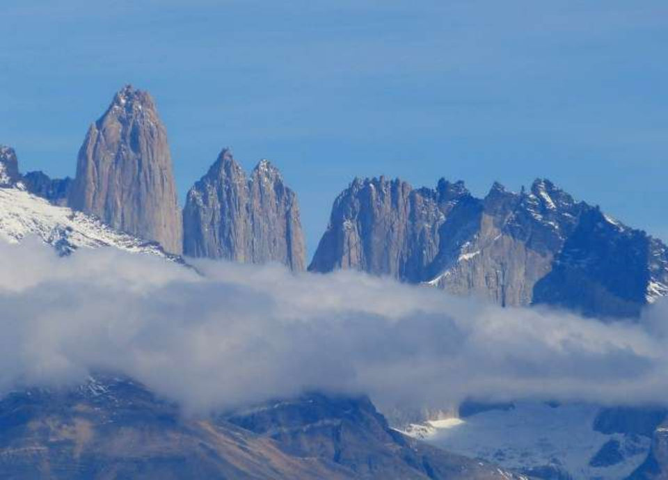
Cordigliera del Paine