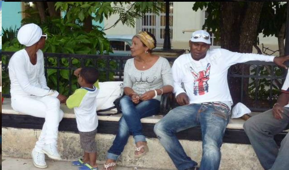
Camaguey - a dx, in completo bianco, una "Santeros" (Santeria)