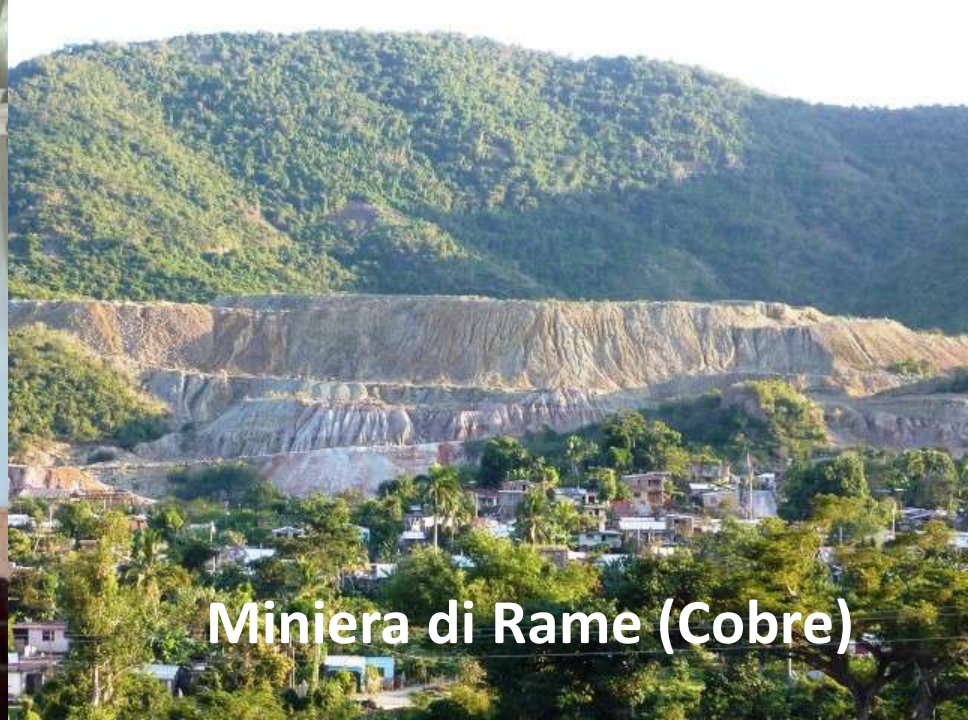
Miniera di Rame (Cobre)