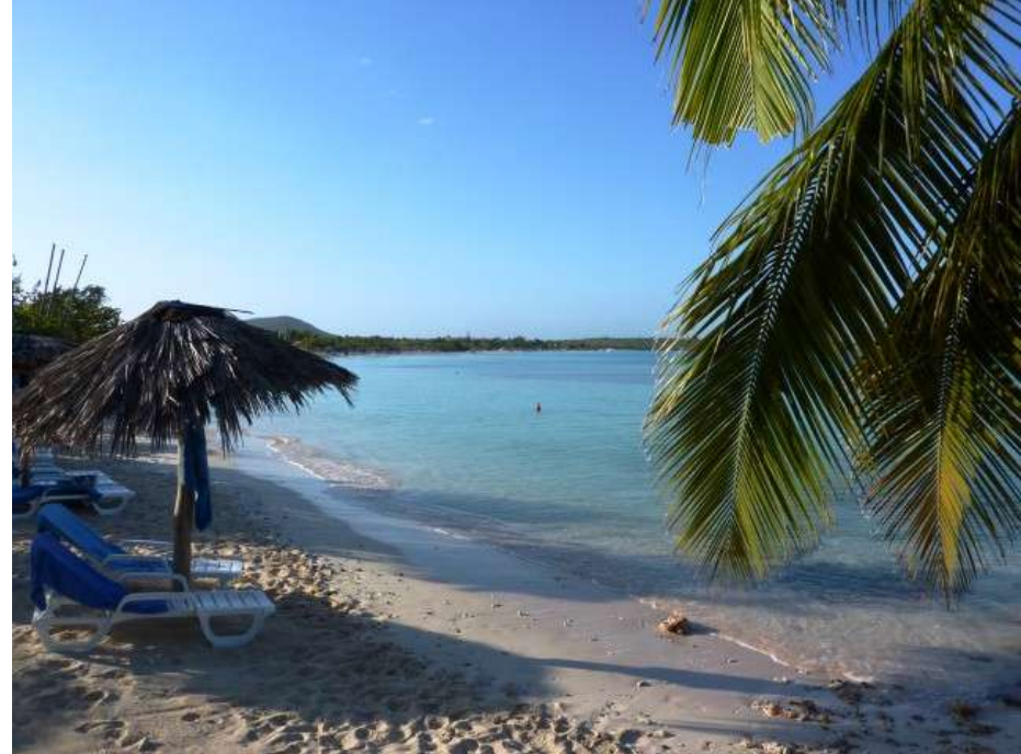
Playa Pesquero e Playa Esmeralda