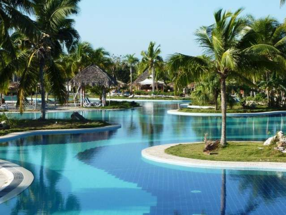
Piscina dell'hotel Playa Pesquero