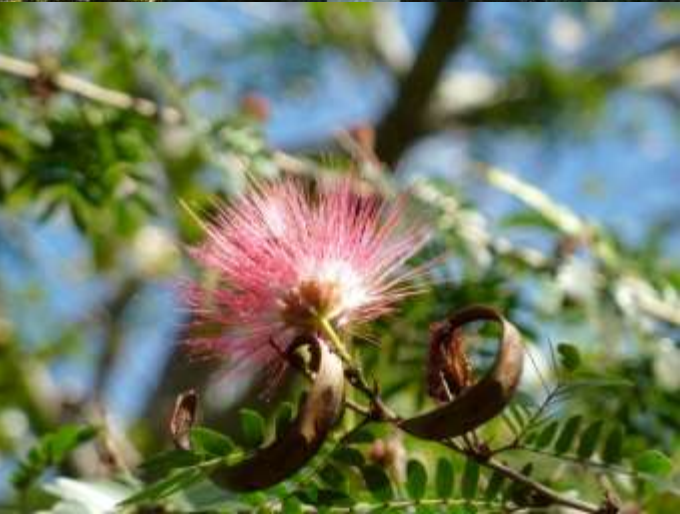
Jardin Botánico de Cienfuegos