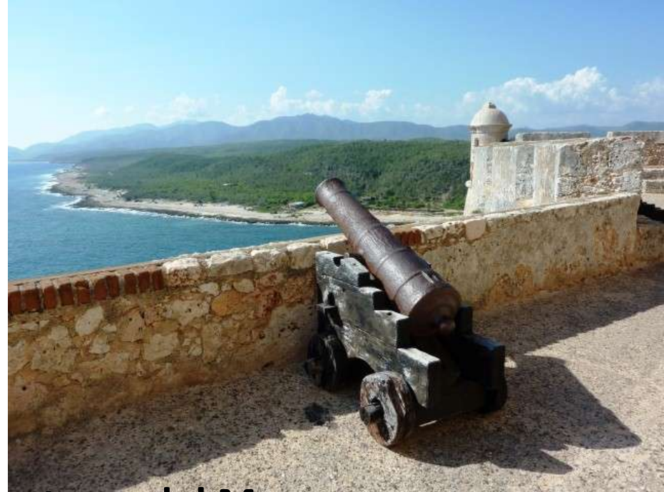
Santiago de Cuba – Fortezza del Morro