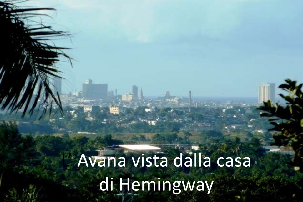
Avana vista dalla casa di Hemingway