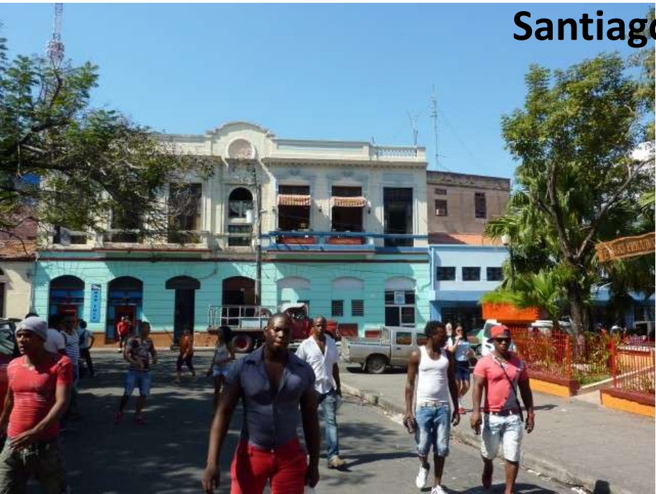
Santiago de Cuba