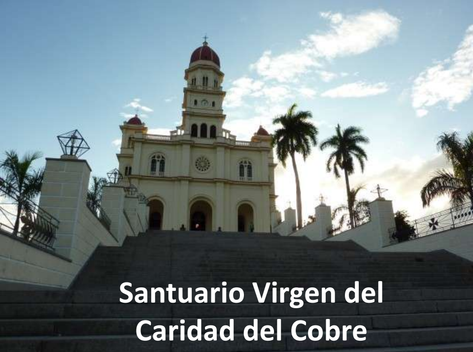
Santuario Virgen del Caridad del Cobre