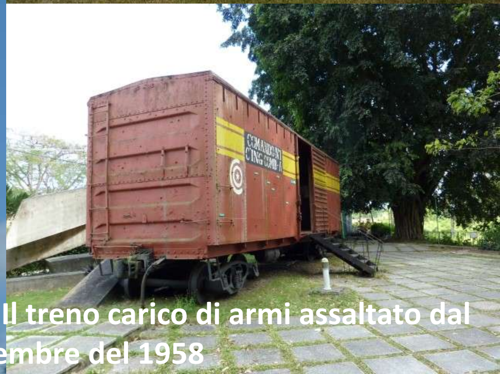
Santa Clara: la tomba del "Che" – Il treno carico di armi assaltato dal "Che" il 29 dicembre del 1958