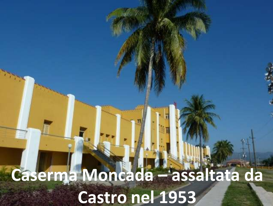
Caserma Moncada – assaltata da Castro nel 1953