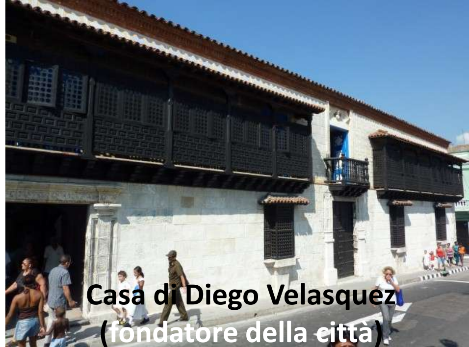
Casa di Diego Velasquez (fondatore della città)