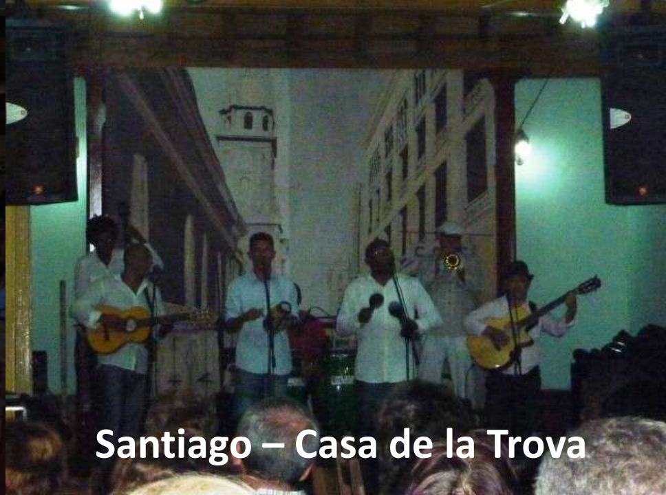
Santiago – Casa de la Trova