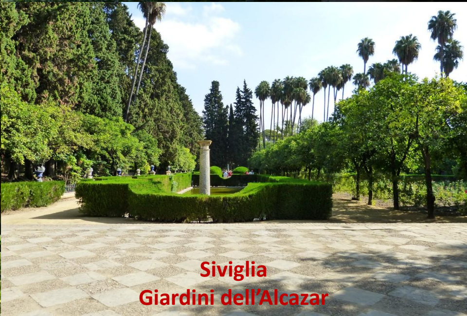
Siviglia Giardini dell'Alcazar