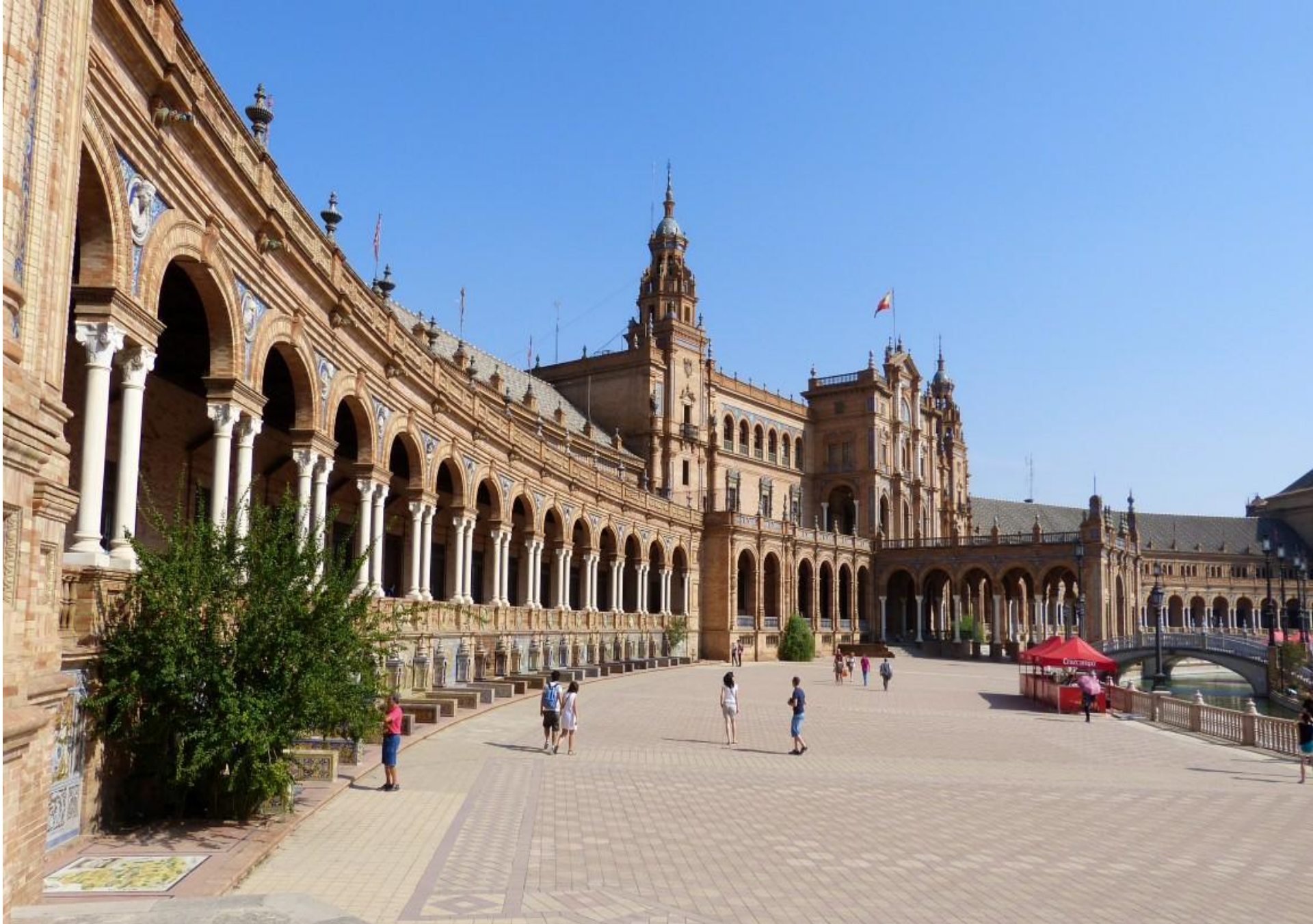
Siviglia - Plaza de Espana