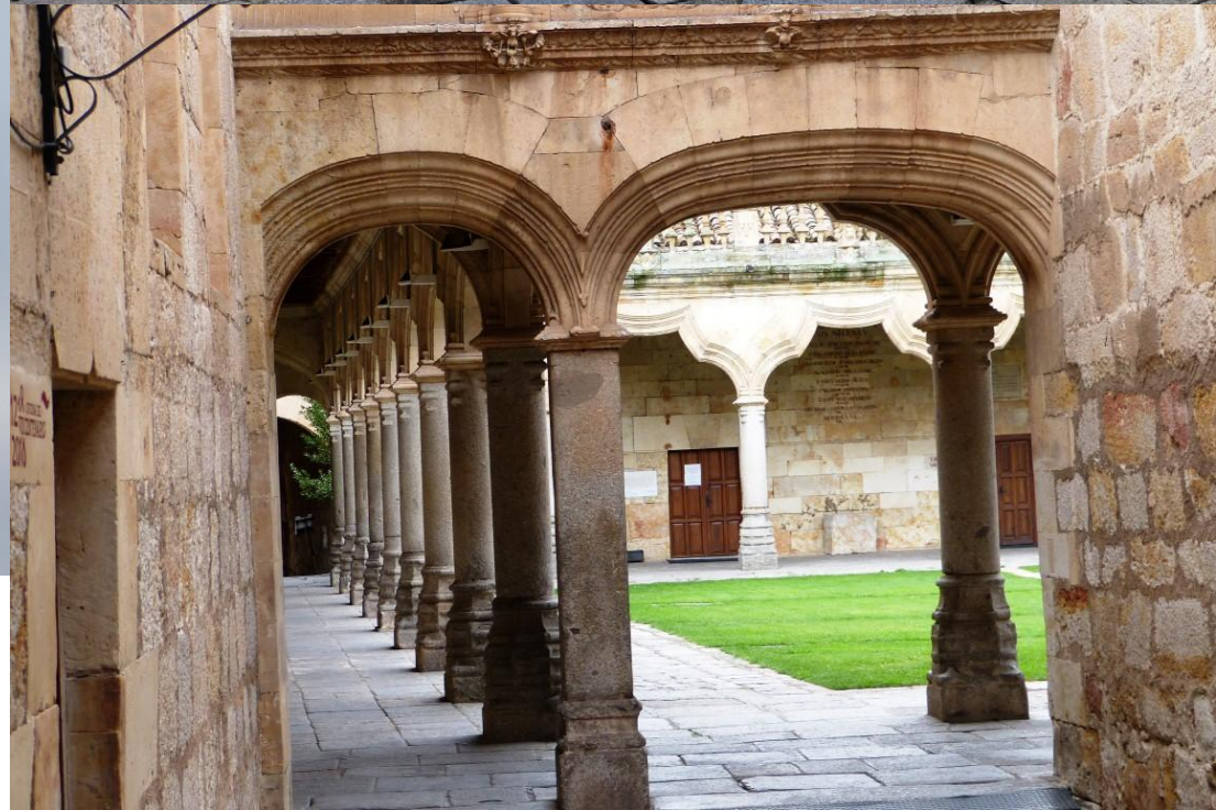
Salamanca plaza Major