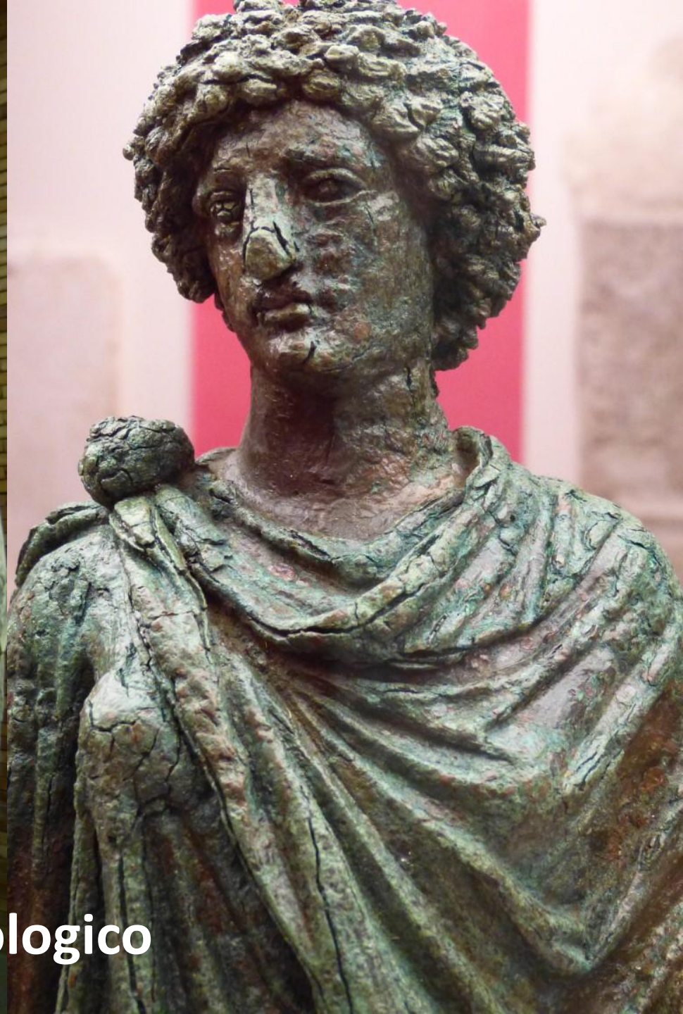
Merida - Museo Archeologico