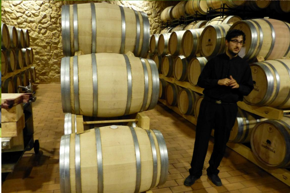
Toro (Castilla y Leon) Sangre de Toro