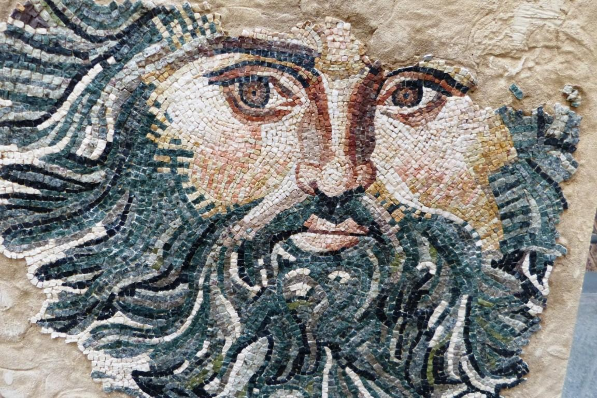
Merida (Augusta Emerita) – Museo Archeologico