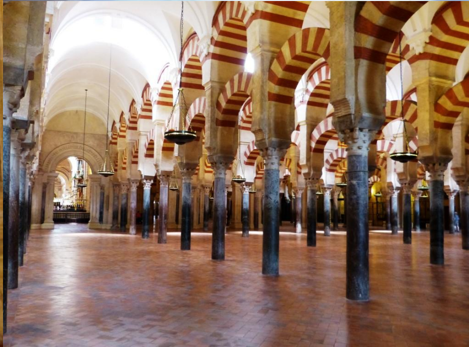
Cordoba - Mezquita