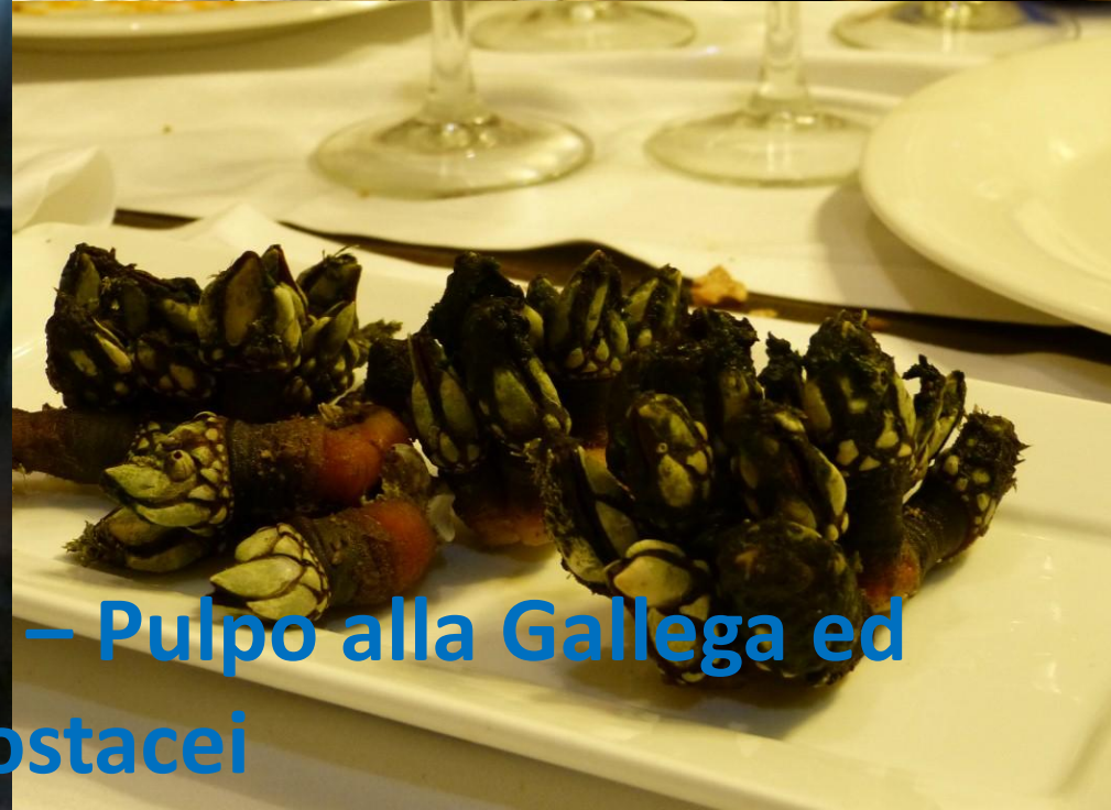
Santiago de Compostela – Pulpo alla Gallega ed altri crostacei