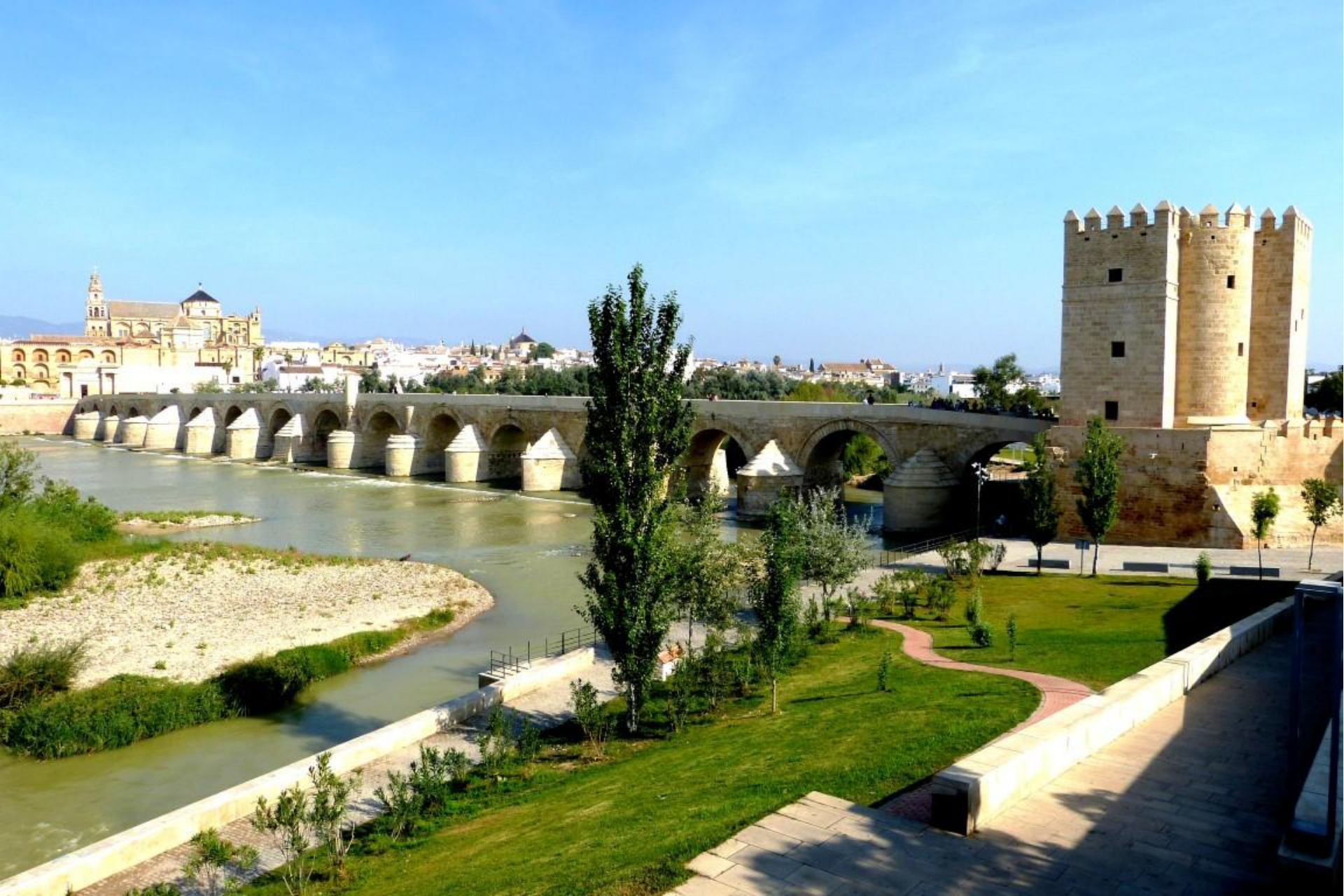
Cordoba – Ponte Romano