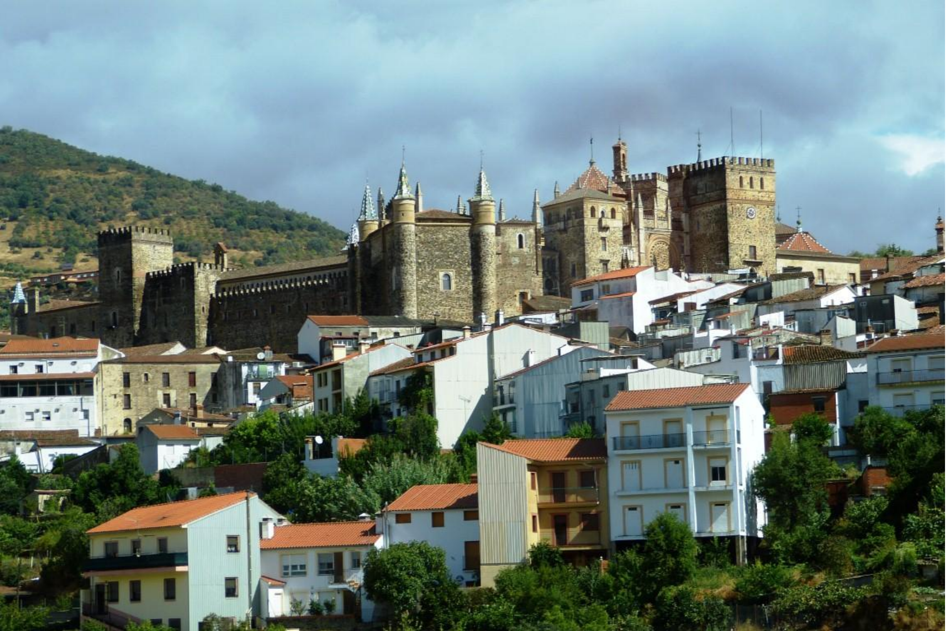
Extremadura – Santuario di Guadalupe