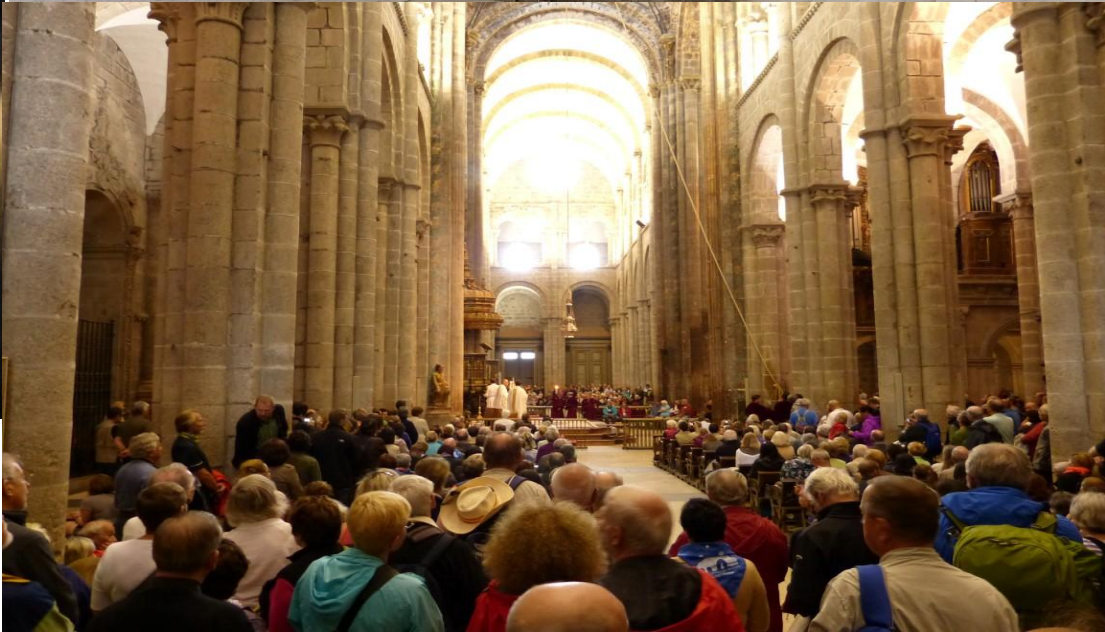
Santiago de Compostela Cattedrale