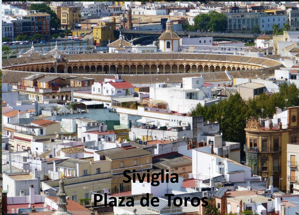
Siviglia Plaza de Toros