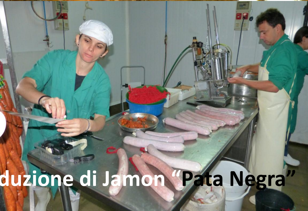
Estremadura Jerez de Los Caballeros – Produzione di Jamon “Pata Negra”