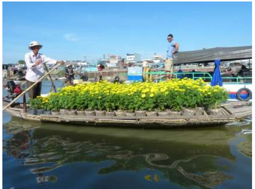
Can Tho – Delta Mekong mercato galleggiante