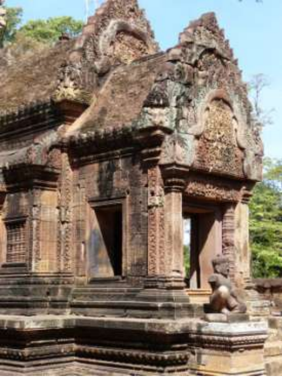
Banteay Srei “Fortezza delle donne” Tempio induista del X° sec. dedicato a Shiva