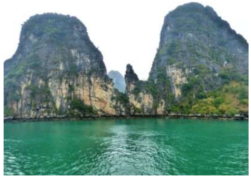
Baia di Halong