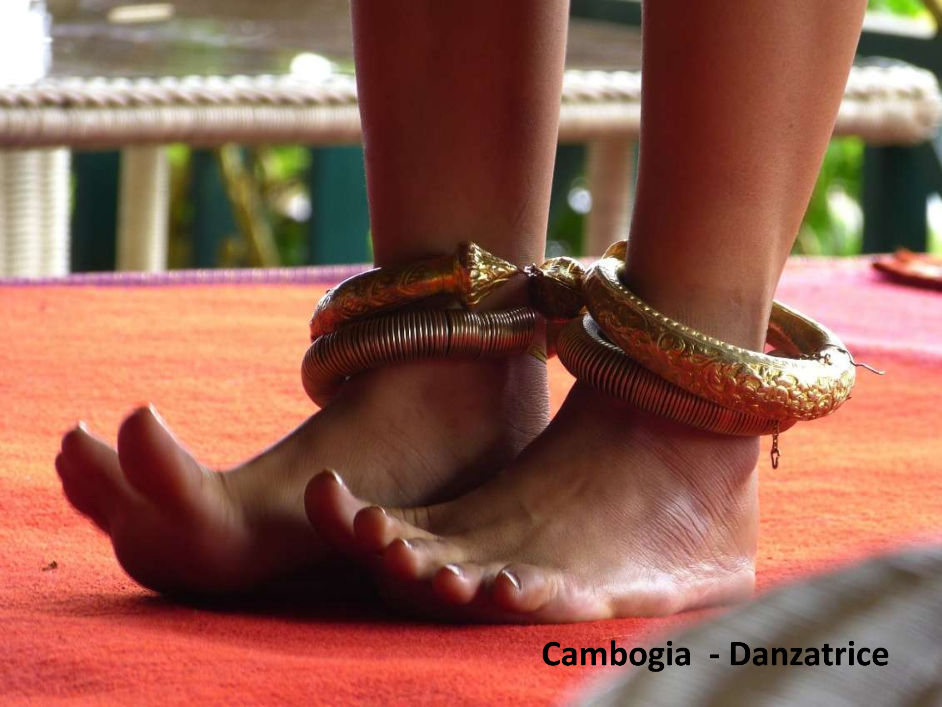
Cambogia - Danzatrice