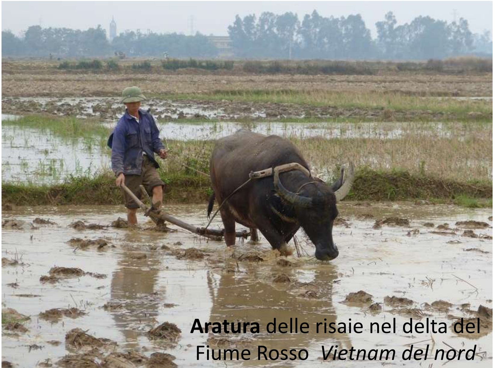
Aratura delle risaie nel delta del Fiume Rosso Vietnam del nord