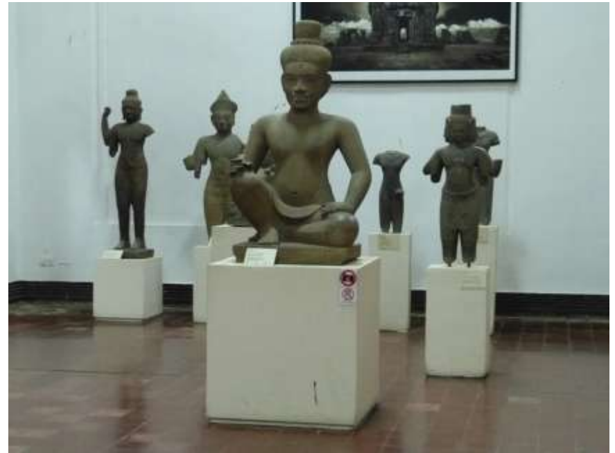
Museo archeologico di Phnom Penh