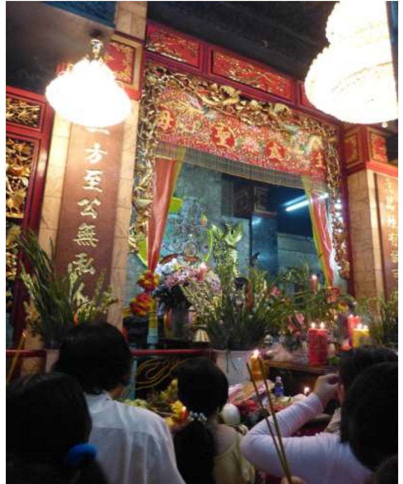
Chau Doc - Mekong Pellegrinaggio alla Pagoda di Tay An