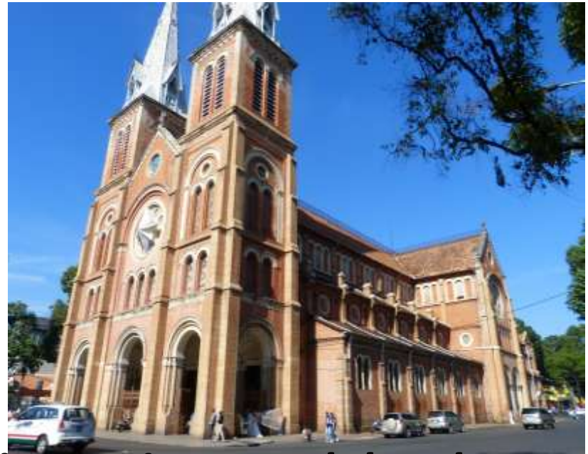
Saigon – Ho Chi Minh City – Vietnam del sud