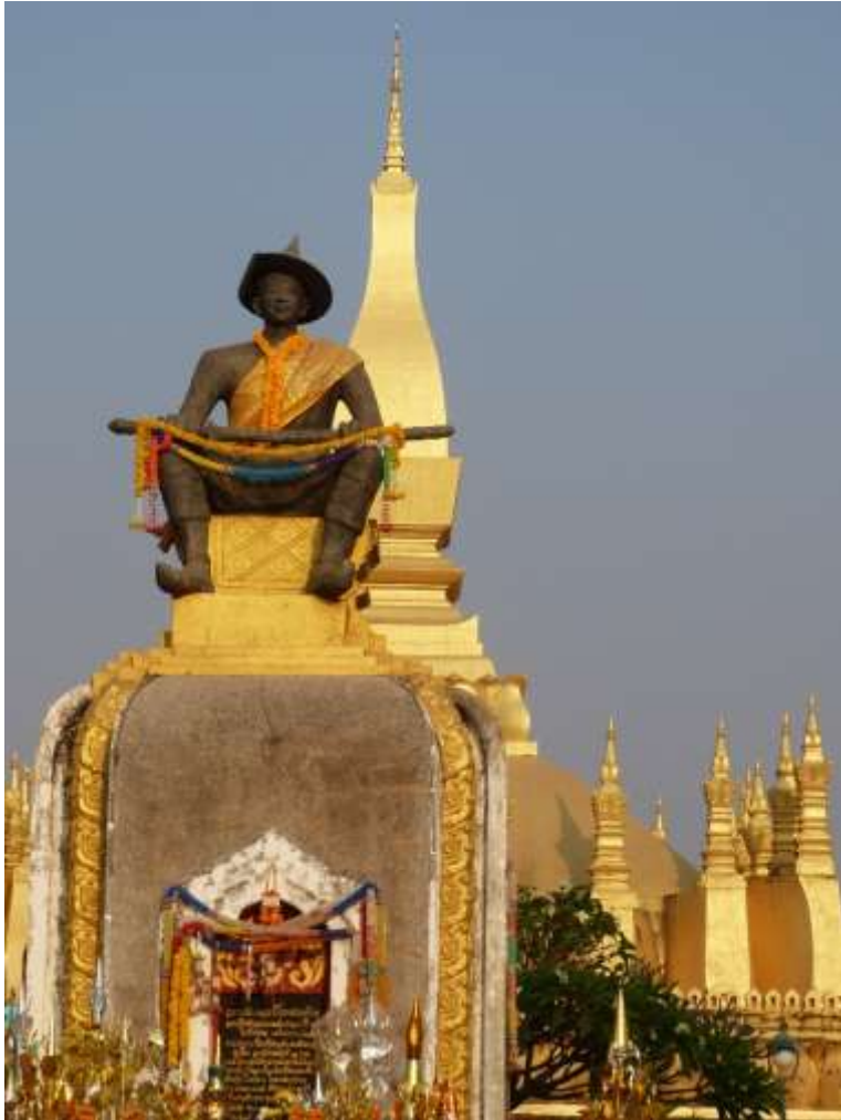
La capitale del Laos